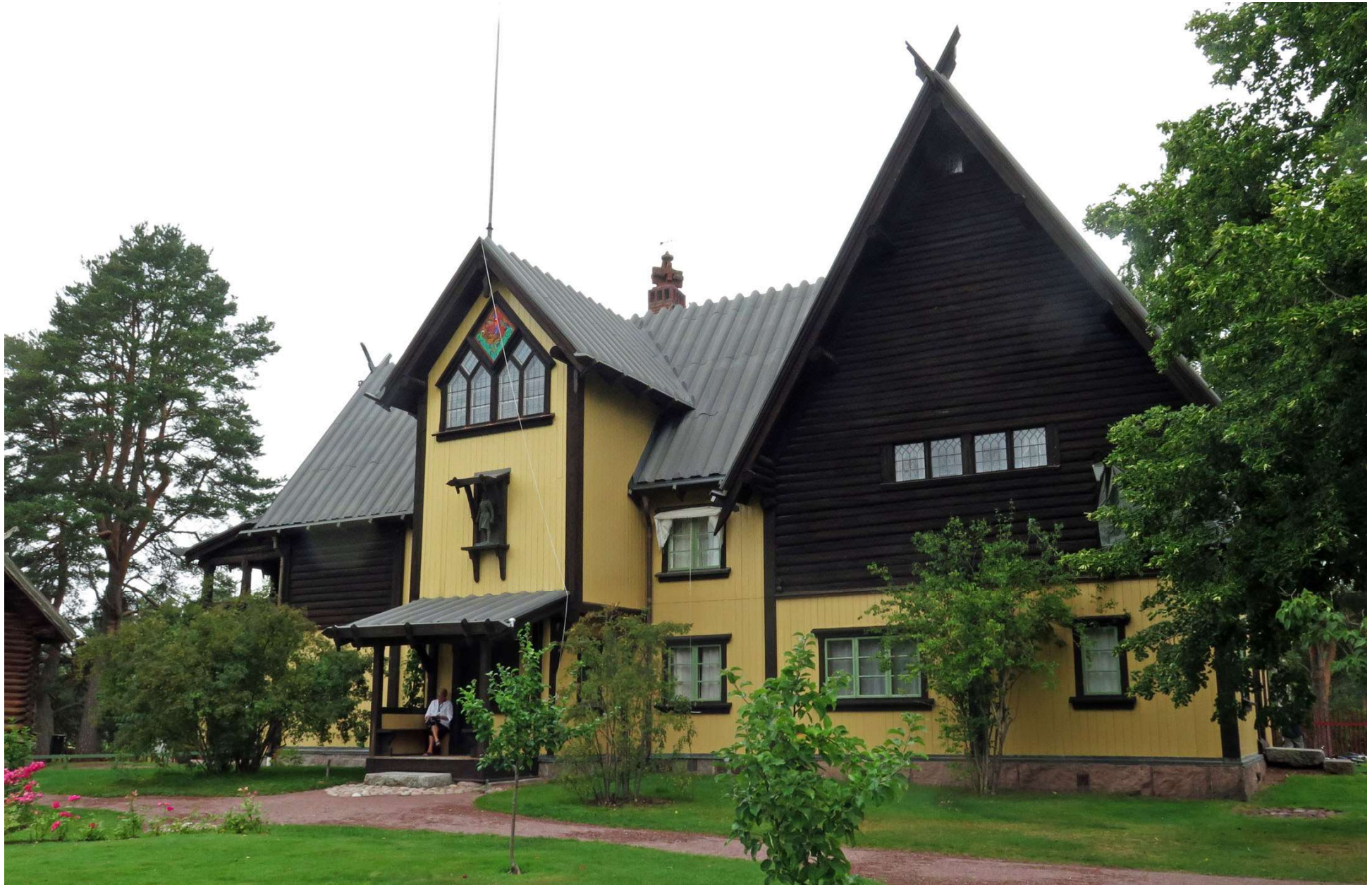
Nära museet ligger det hus som Zorn ritade och från 1896 bodde i tillsammans med sin hustru Emma. Omkring 1910 stod gården klar så som den ser ut idag.