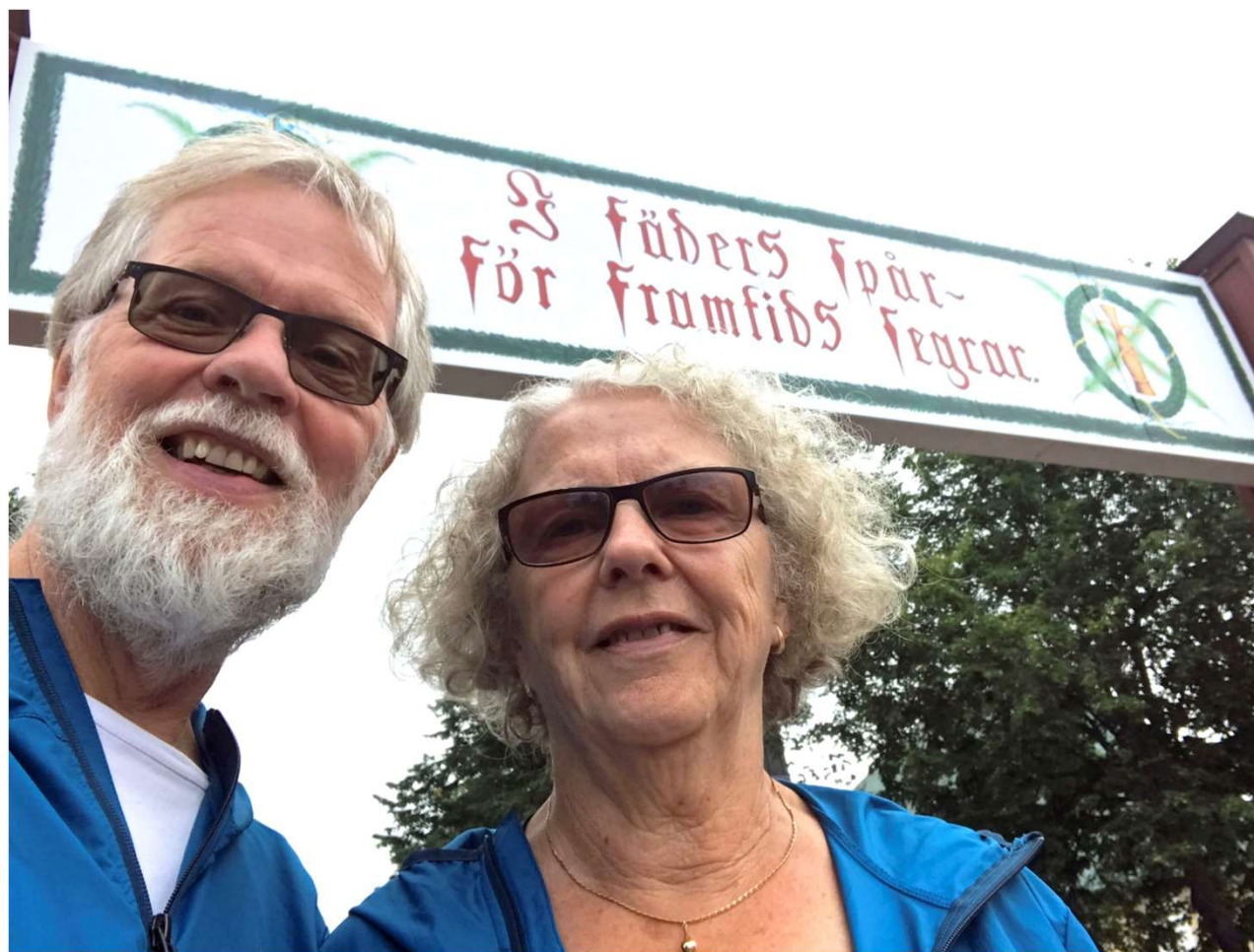
Text och foto (där ej annat anges) © Ingemo & Charley Nilsson, augusti 2022.