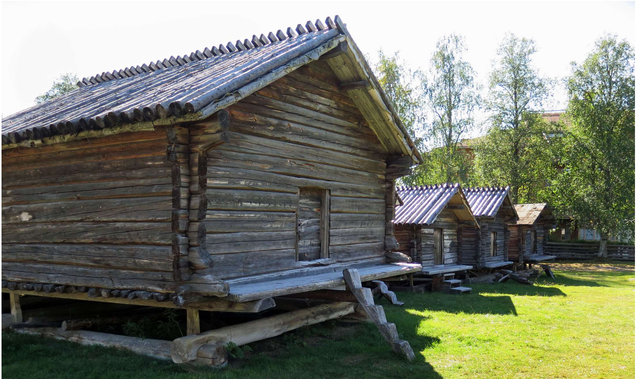
I Lappstaden finns utöver 31 timmerkåtor även 54 härbren (förråd), på samiska kallade aittor .