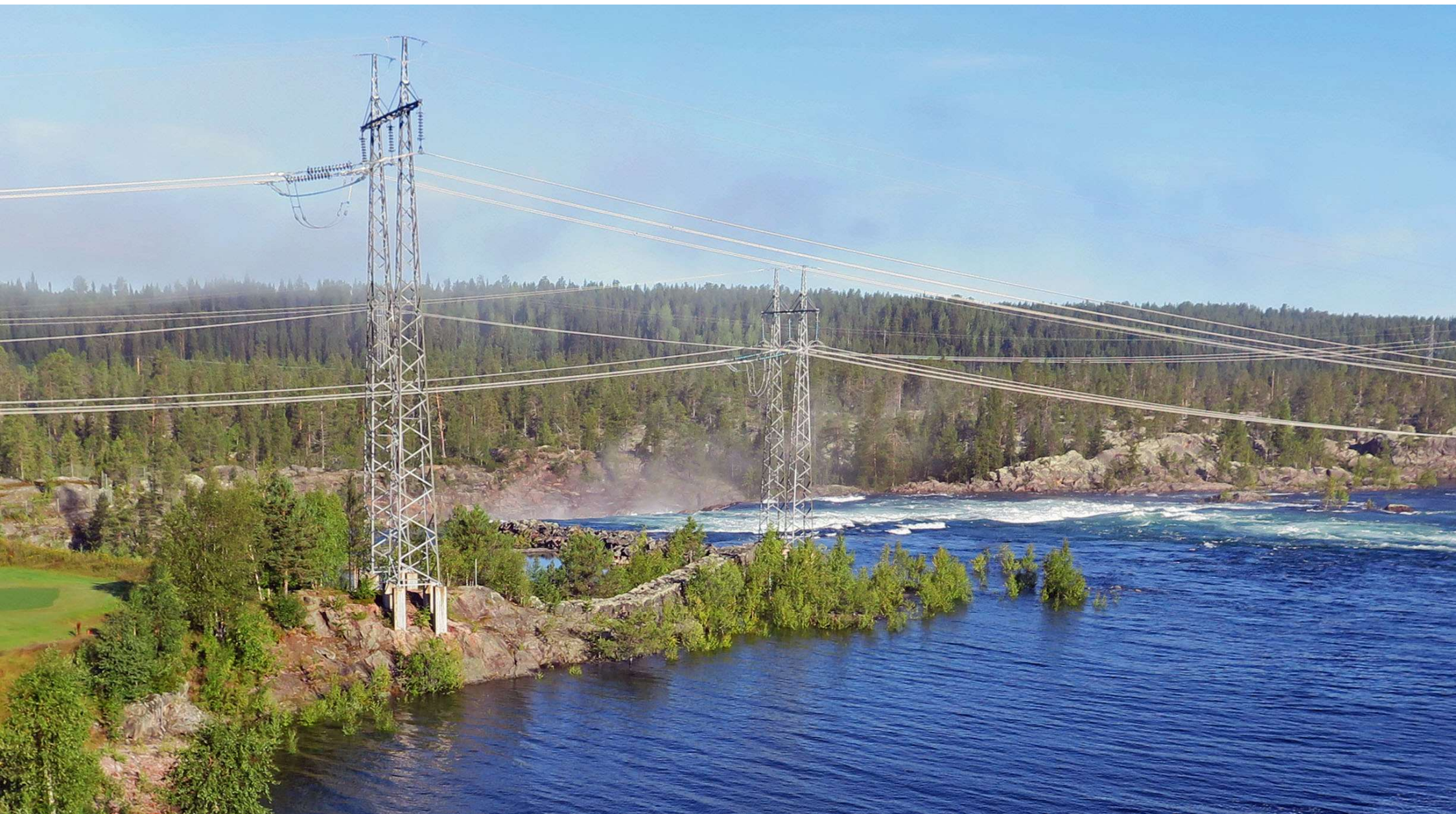
Stora Lule älv vid Porjus.