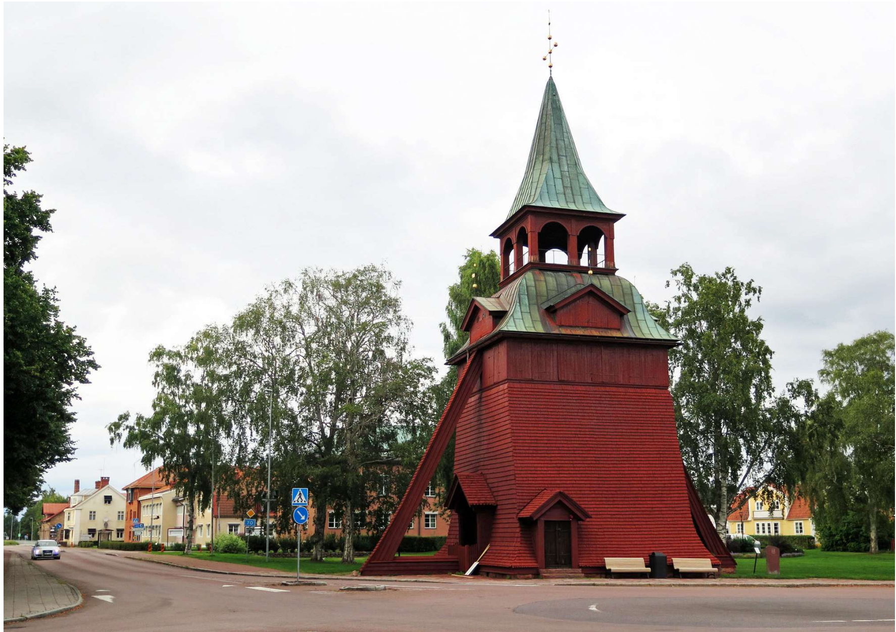
Med Moras välkända klockstapel avslutar vi detta bildreportage om vår resa med Inlandsbanan.