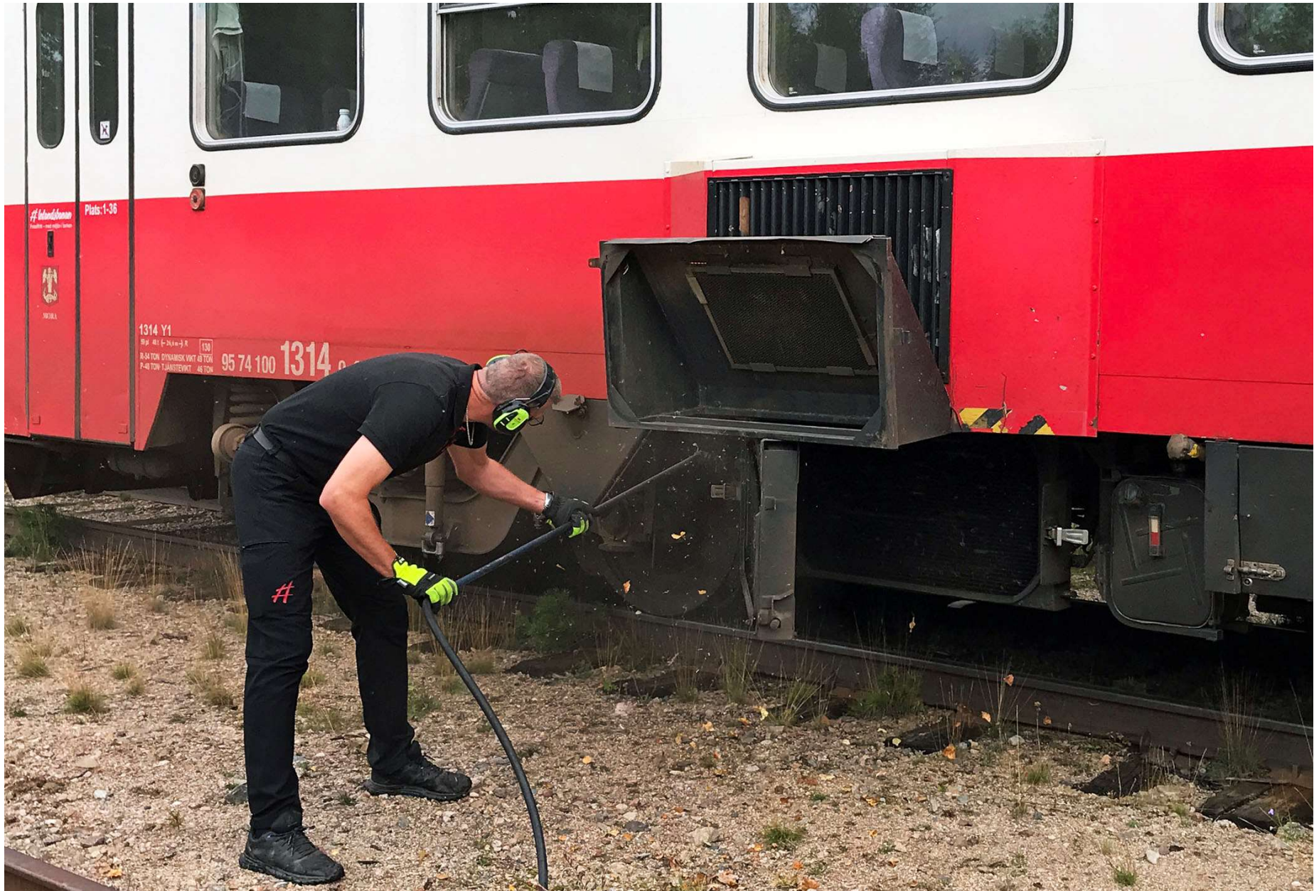
Liksom på vägen norrut tidigare togs fikapaus i Fågelsjö, där lokföraren passade på att blåsa motorerna rena från löv och annat skräp.