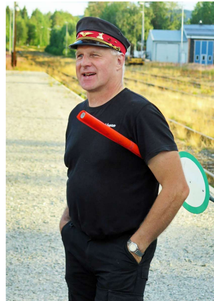
Stationen i Hoting är minsann bemannad med tågklarerare.