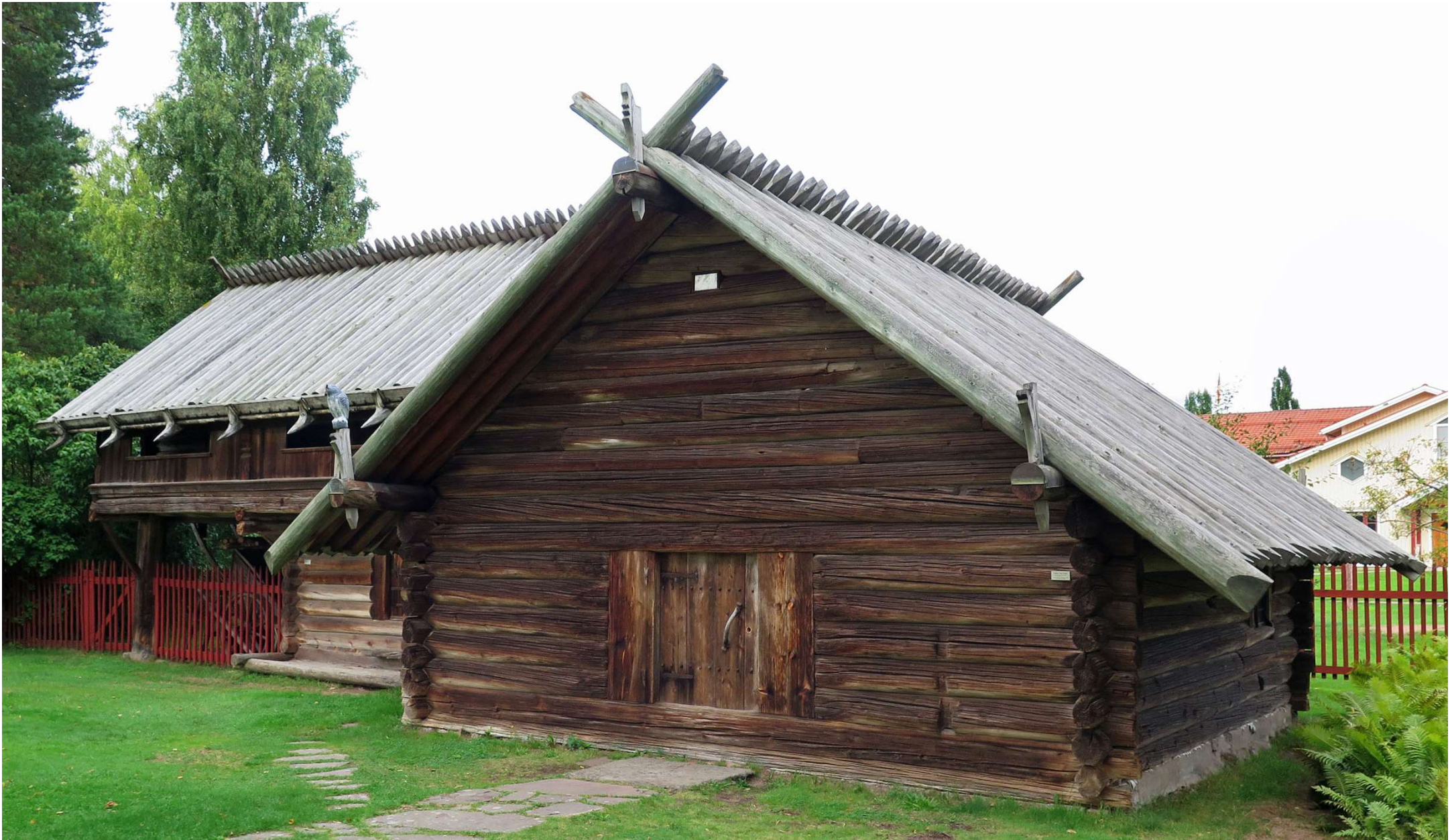
Detta s.k. eldhus flyttades 1898 av Anders Zorn till Zorngården för att där användas som ateljé.