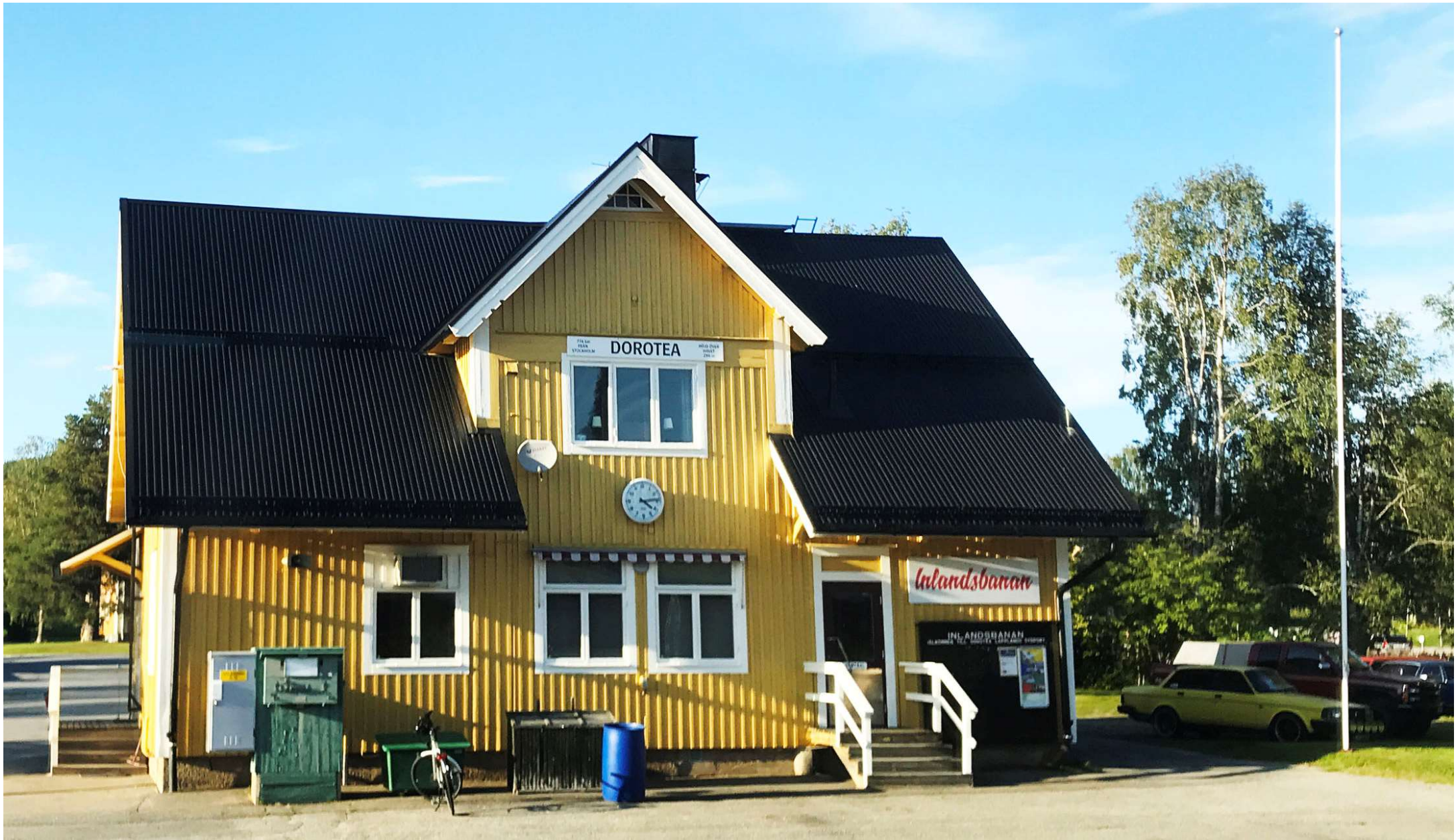
Även stationsorter som Vilhelmina och Dorotea passerades på väg till Östersund.