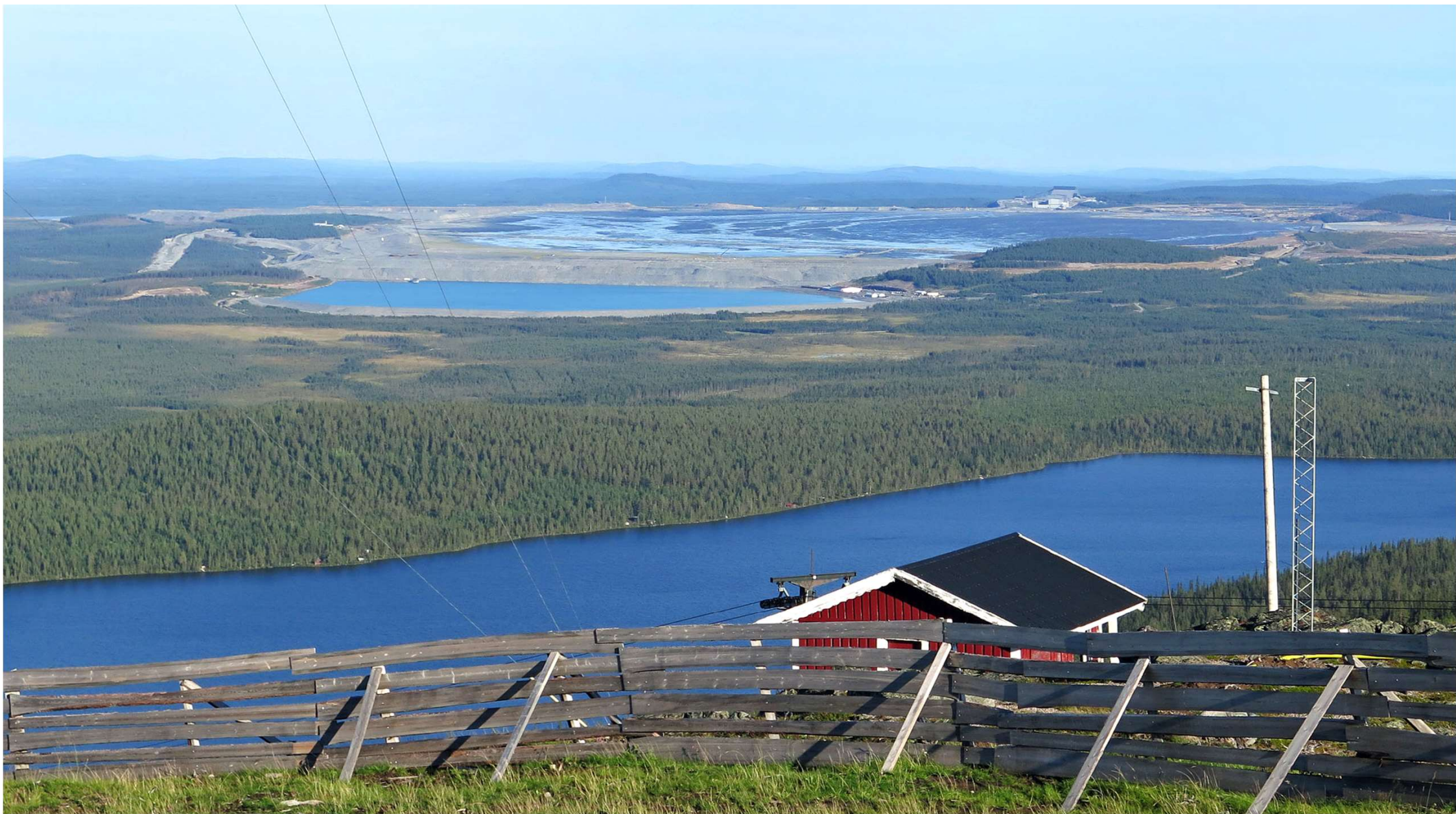
Söder om Dundret ligger Aitik koppargruva, som är Skandinaviens största dagbrott och en av Europas största koppargruvor.