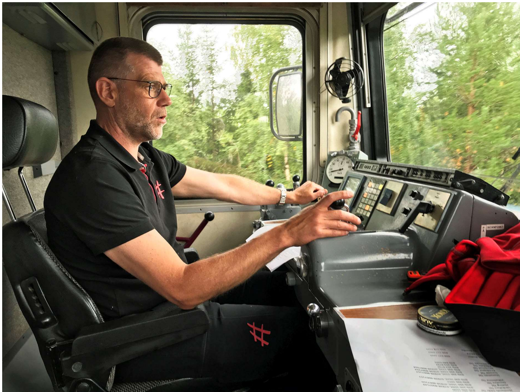
Sedan for vi vidare, och nådde vid lunchtid fram till Mora.