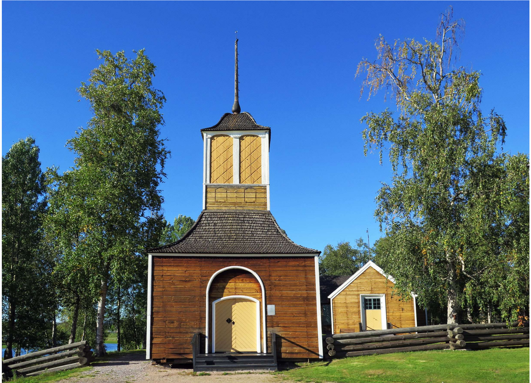
Framme i Gällivare besökte vi Gamla kyrkan som uppfördes under första hälften av 1700-talet. Den kallas även Ettöreskyrkan, eftersom varje hushåll i Sverige ålades att betala ett öre årligen under fyra år för att finansiera byggandet.