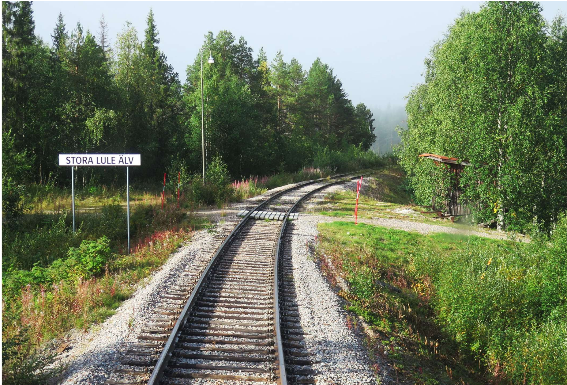
Strax söder om Porjus går en järnvägsbro över Stora Lule älv.