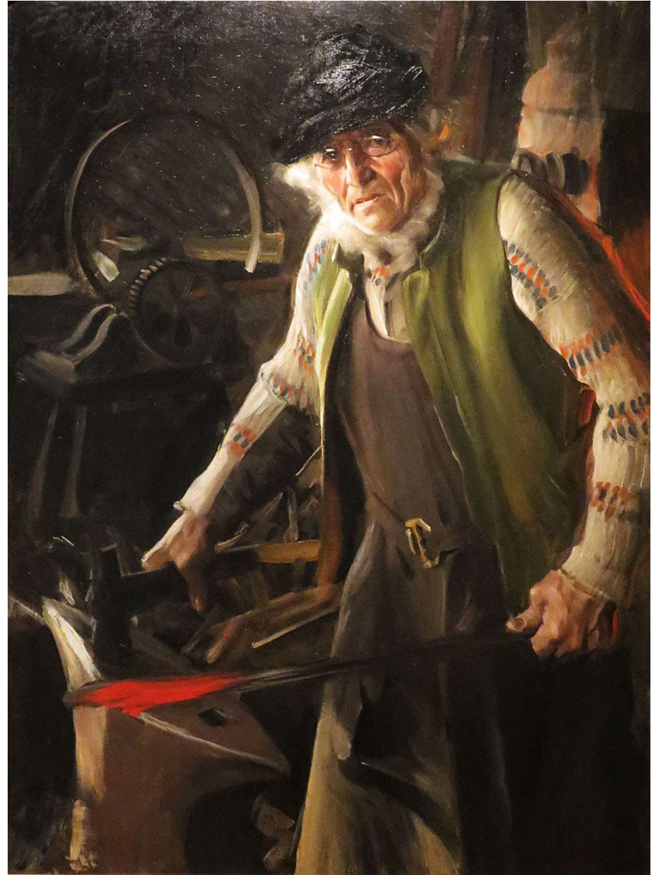
Midsummardans från 1897 och Mästersmeden (1907) är två andra Zorn-målningar som visas på Zornmuseet.