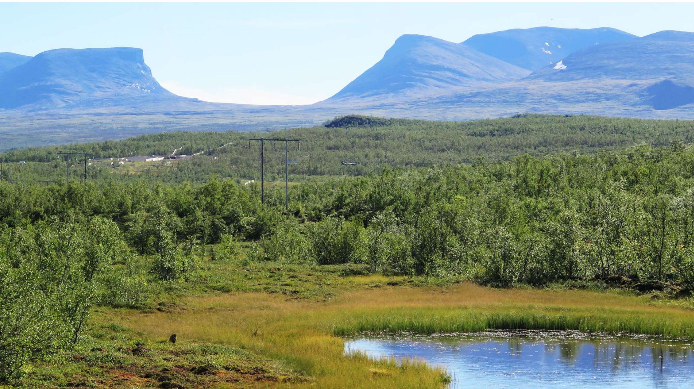
Sydost om Björkliden kan man se Abisko nationalpark med Lapporten.