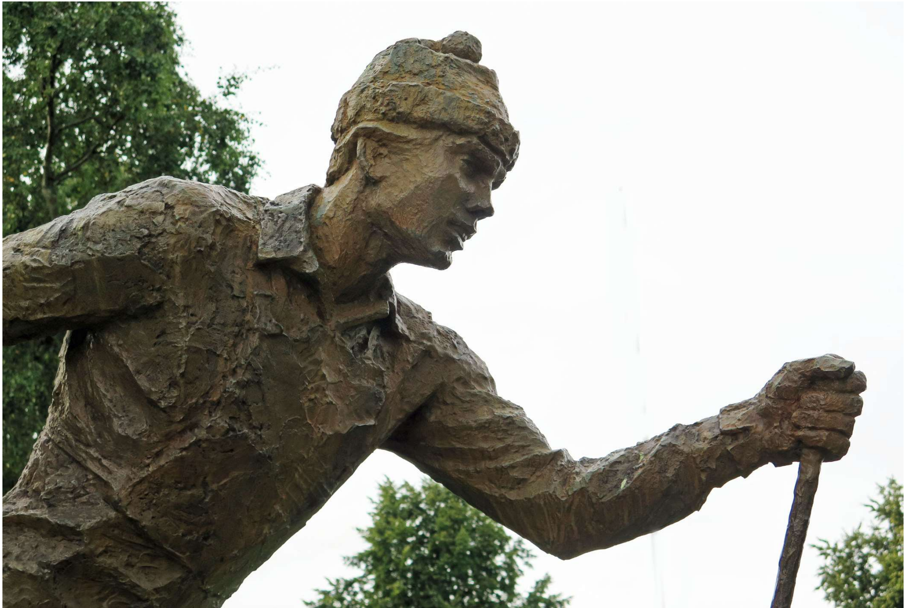
Mycket i Mora handlar om Vasaloppet, däribland statyn Vasalöparen av Per Nilsson-Öst från 1973.