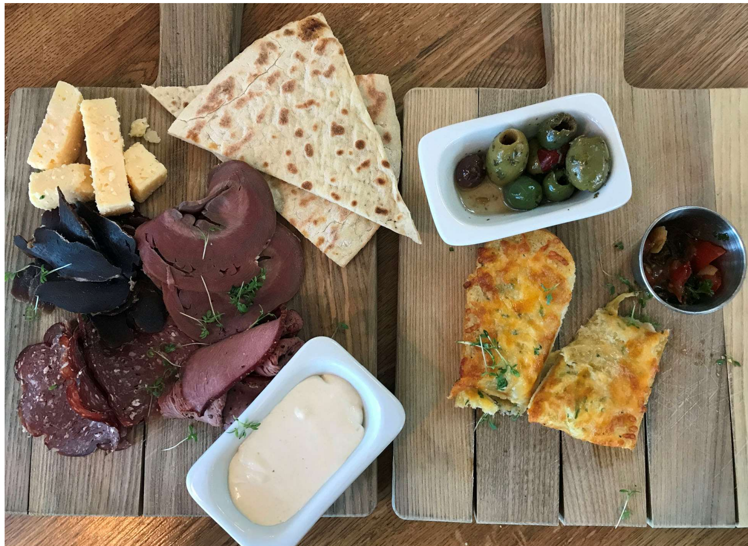
Även i Arvidsjaur passade vi på att inta lokala specialiteter. Till lunch blev det varm renskavsmacka, och till middag åt vi charkuteribricka med bl.a. renhjärta, älgrostbiff, torkat renkött och älgalami, ackompanjerat av västerbottenost, vitlöksbröd och oliver.