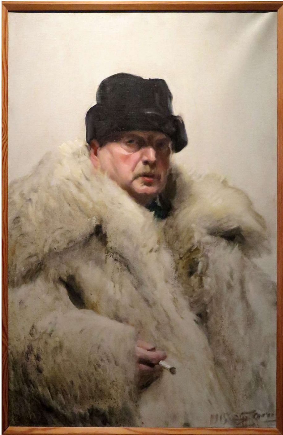
På Zornmuseet visas många verk av Moras världsberömde konstnär, Anders Zorn, däribland detta självporträtt från 1915.