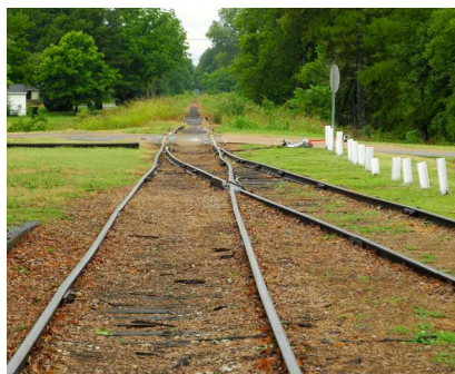
Räls där stationen i Tutwiler låg

As he played, he pressed a knife on the strings of the guitar ... The effect was unforgettable. His song, too, struck me instantly: "Goin' where the Southern cross' the Dog" ... the weirdest music I had ever heard.