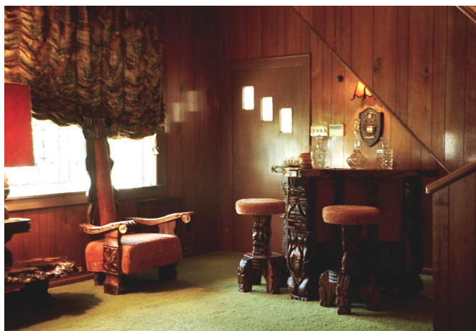
The Jungle room, där Elvis sista studioinspelningar gjordes.

Den 2–7 februari lyckades man, trots att Elvis var mestadels oengagerad och ofokuserad, bland annat spela in en stark, känslöfylld version av Roy Hamiltons r&b-hit "Hurt". I slutet av oktober byggde man åter om Gracelands Jungle room till studio. Nu var Elvis ännu mer frånvarande och oberäknelig, men fyra nummer blev i alla fall resultatet, däribland en version av Johnny Aces r&b-etta från 1955, "Pledging my love".