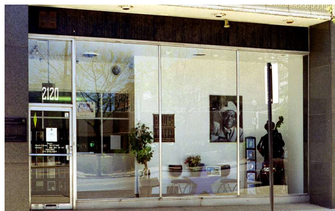
Blues Heaven Foundation, 2120 South Michigan Avenue*.