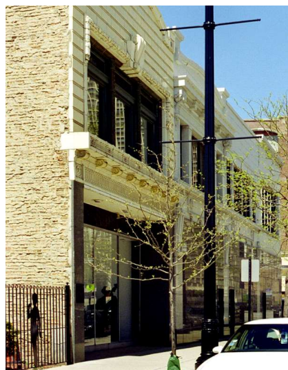
2120 South Michigan Avenue*.

Bolagets inspelningar gjordes i olika studios, men den mest kända blev den på 2120 South Michigan Avenue vilken användes från ca 1956 till 1965. Under de åren gjordes här banbrytande och senare flitigt