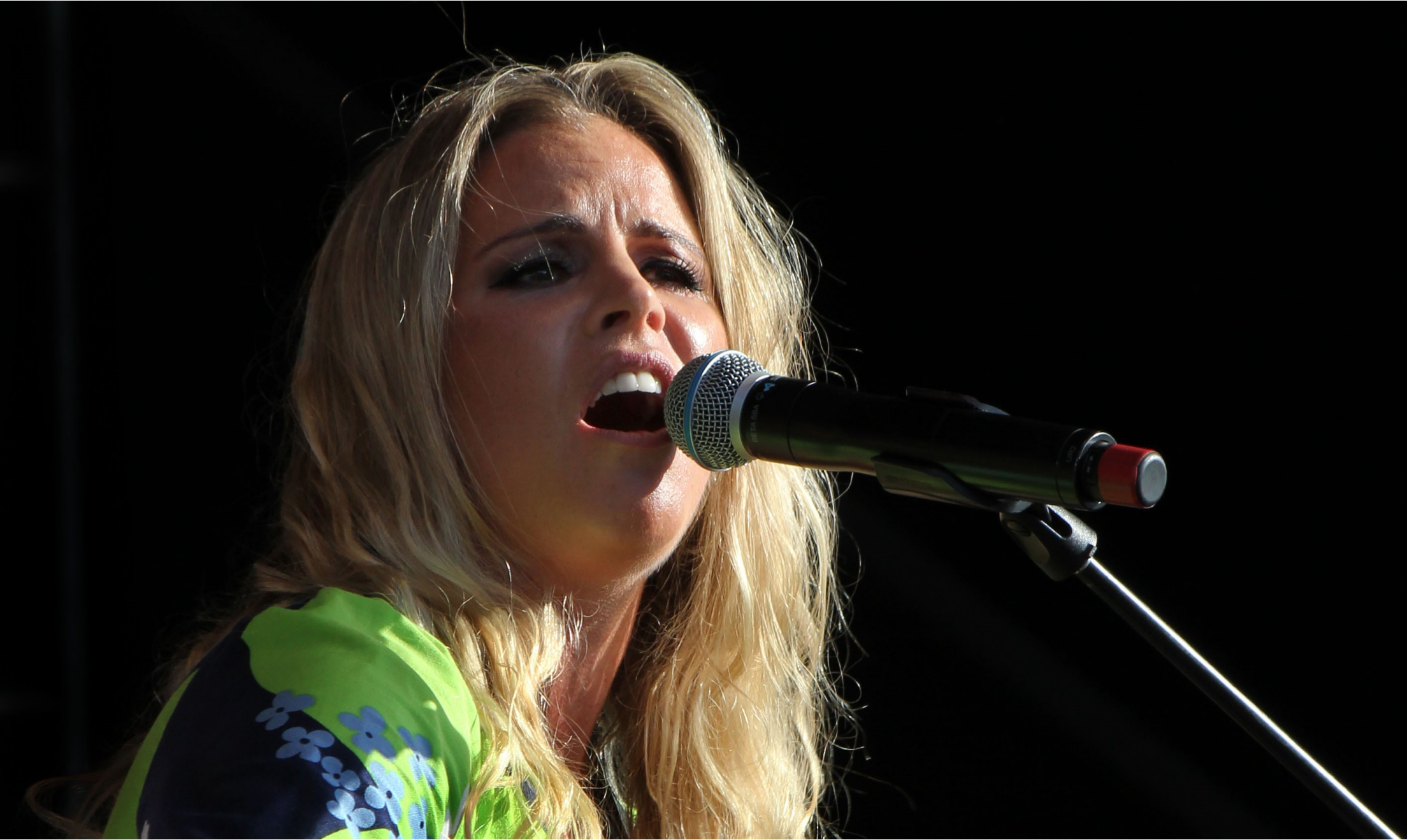
När det var festivaldags spelade Lisa Miskovsky med Helsingborgs symfoniorkester.