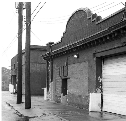
"Situated in an old icehouse at the dead-end street". Foto Charley Nilsson, 1996.