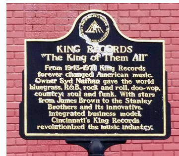
Byggnaden har numera getts visst skydd som "city landmark".