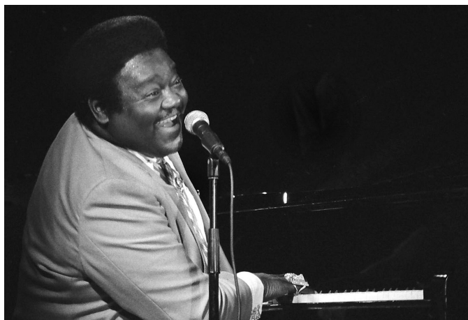
Fats Domino var i ypperlig form i Åhus 1990.