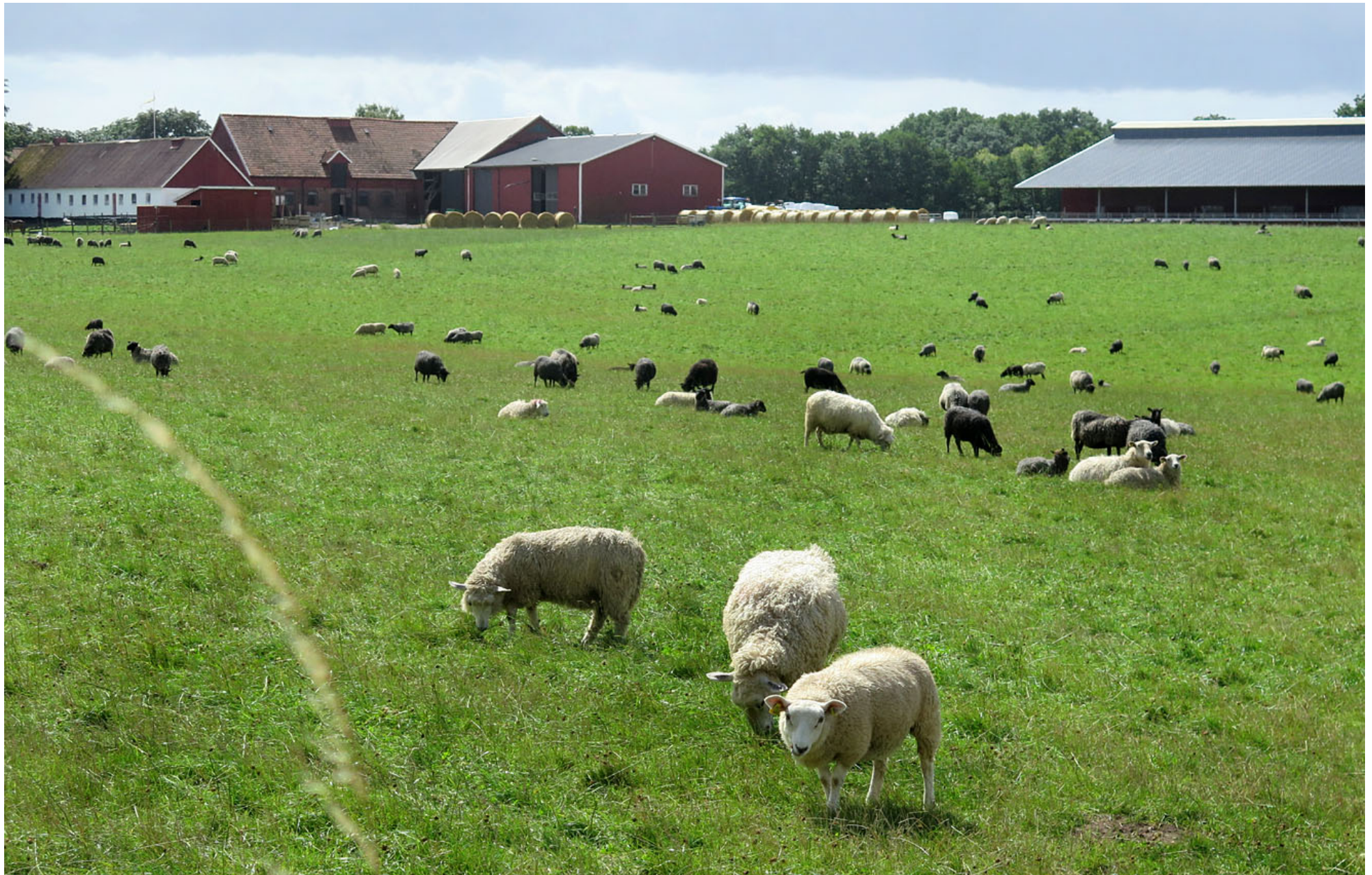
Eksholmens gård har massor av får.