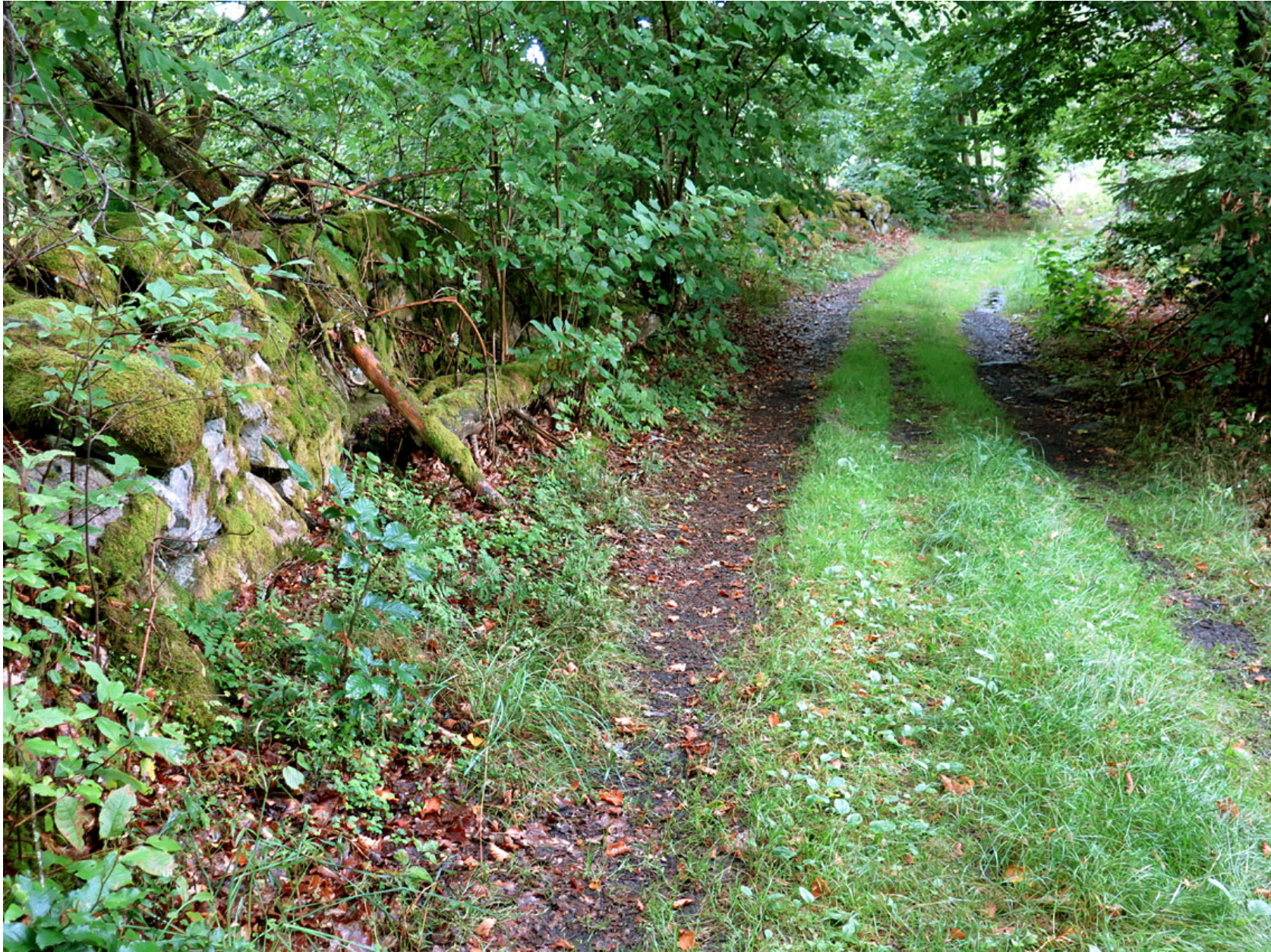
Strax väster om Simontorp går Ryavägen, en av Skånes äldsta vägar. Den var ett avsnitt av riksvägen mellan Danmark och Sverige, och gick från Växjö ner mot Osby.