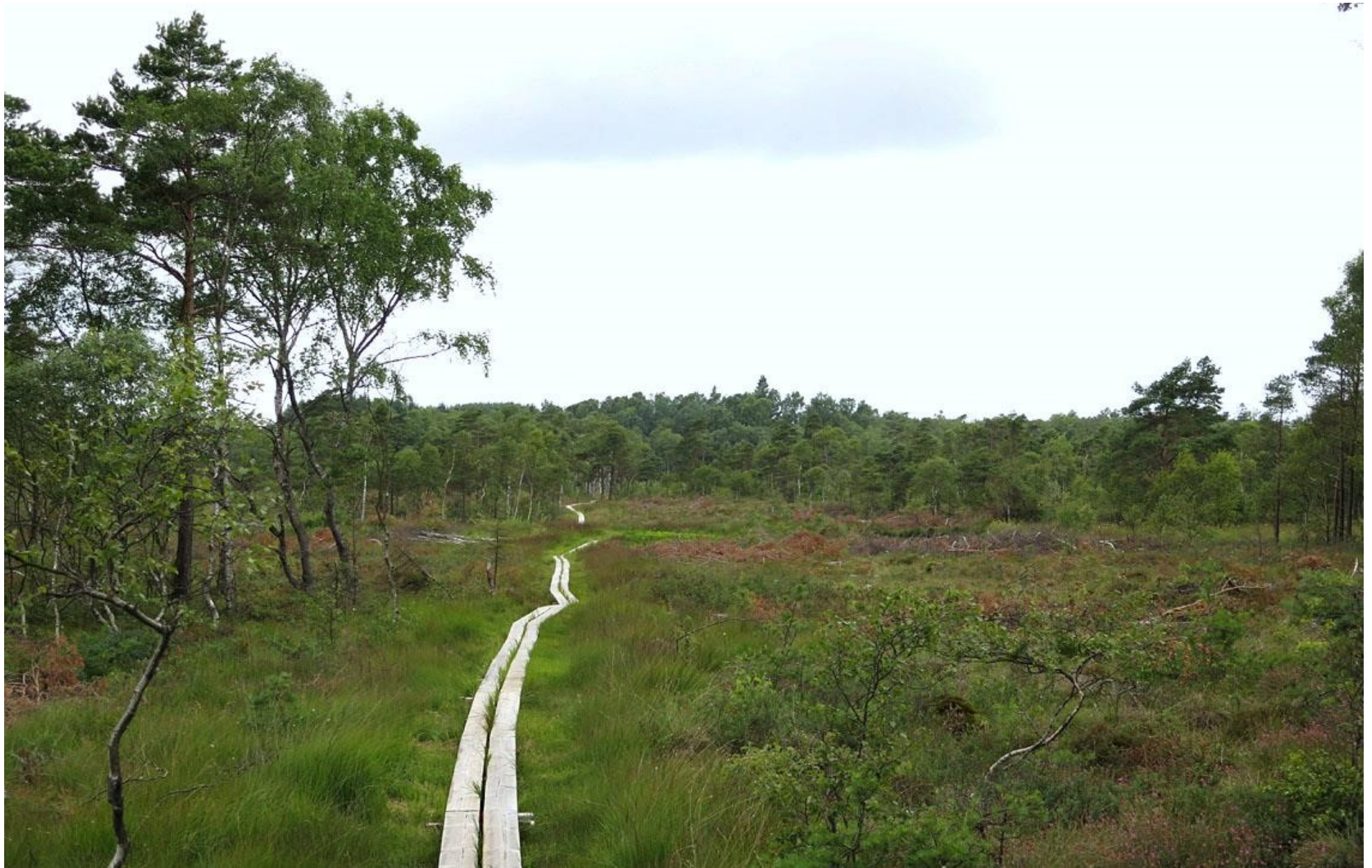
På Älemosse sydost om Båstad.