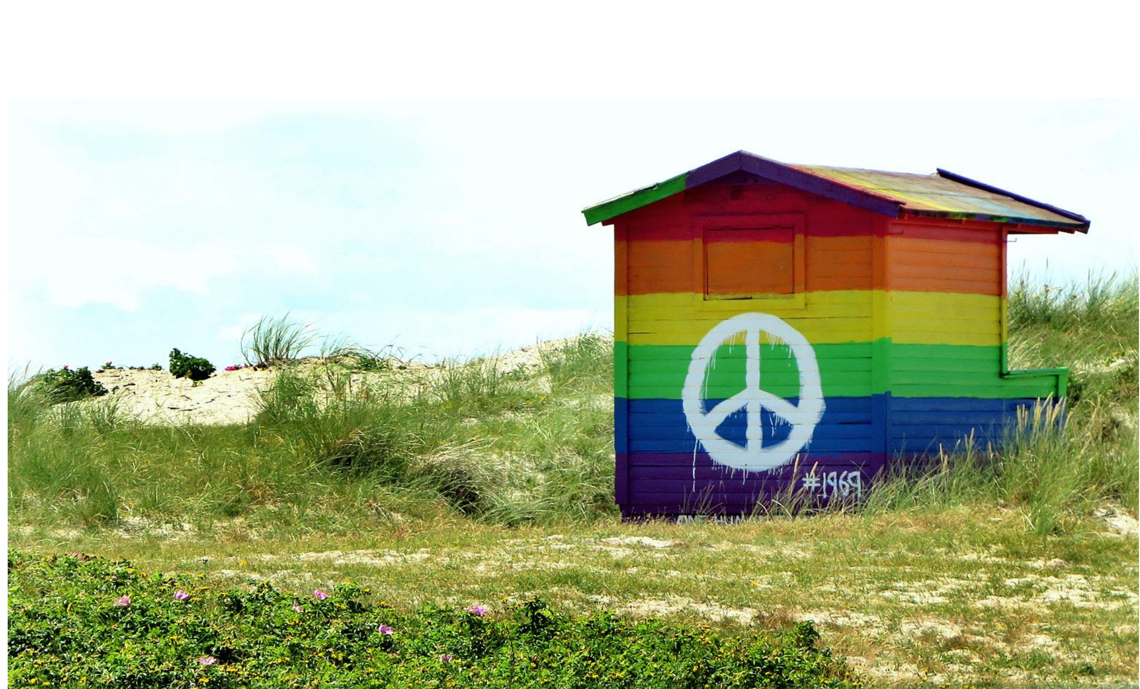
Love, peace and understanding.