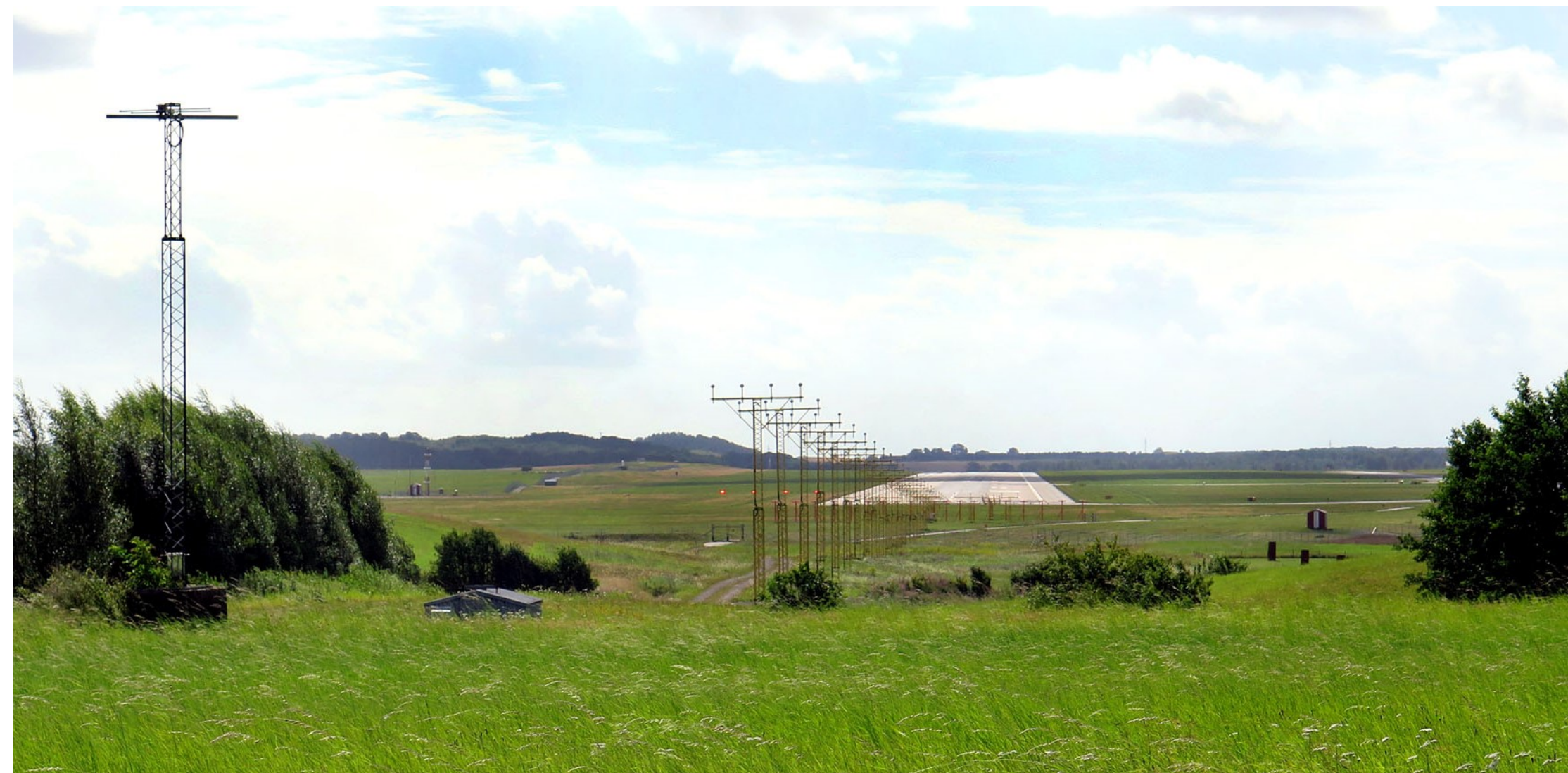
På väg till Holmeja passerar vi Sturups flygplats (Malmö Airport).