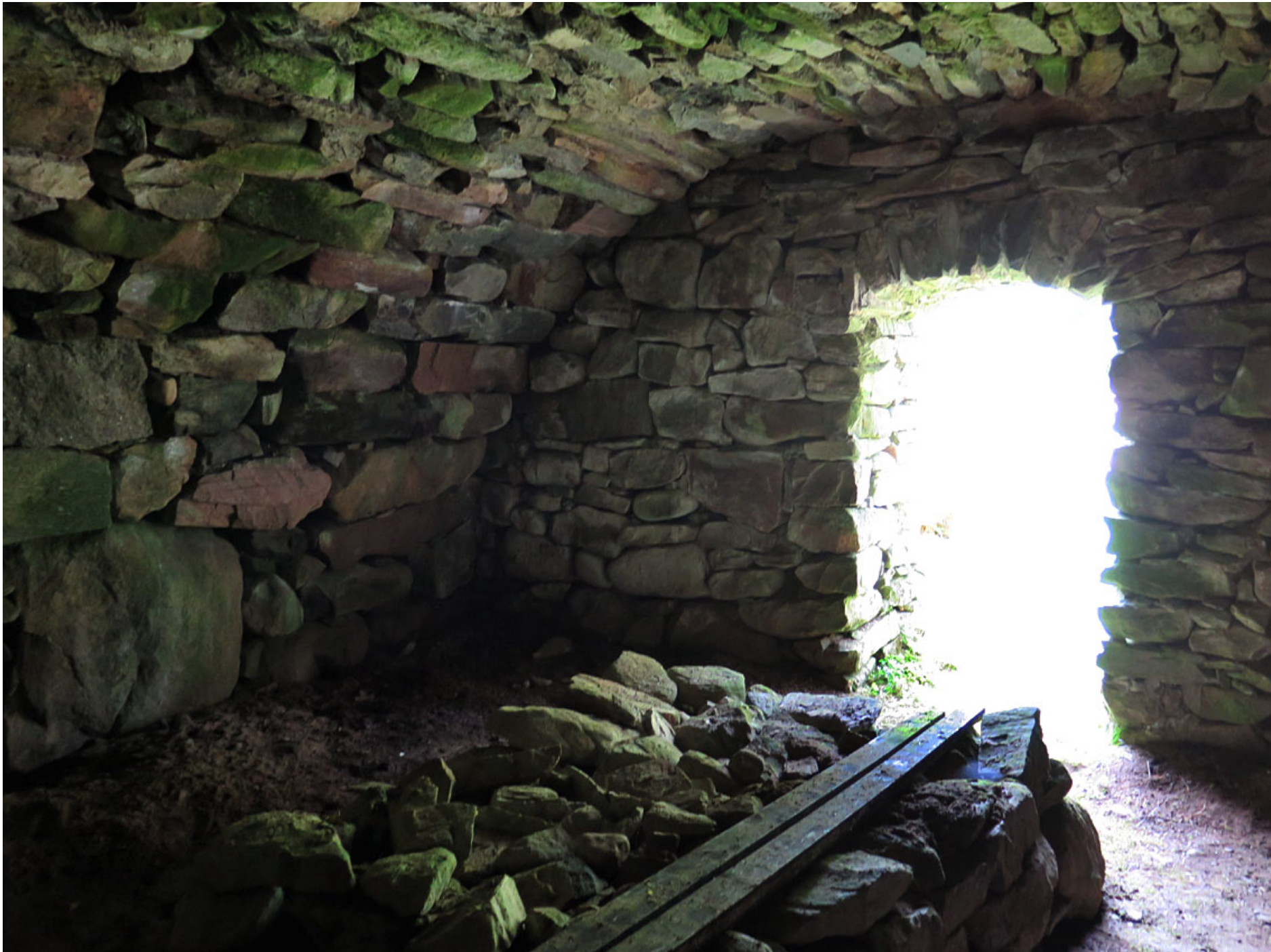
I Hågnarp väster om Bjärnum finns en väl bevarad linbasta, som även kan ha använts att torka malt i.