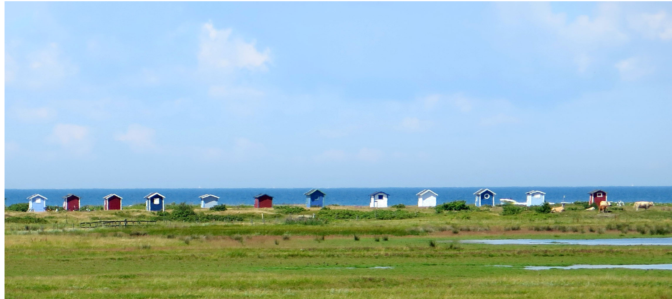
Badhytter vid norra delen av Flommen.