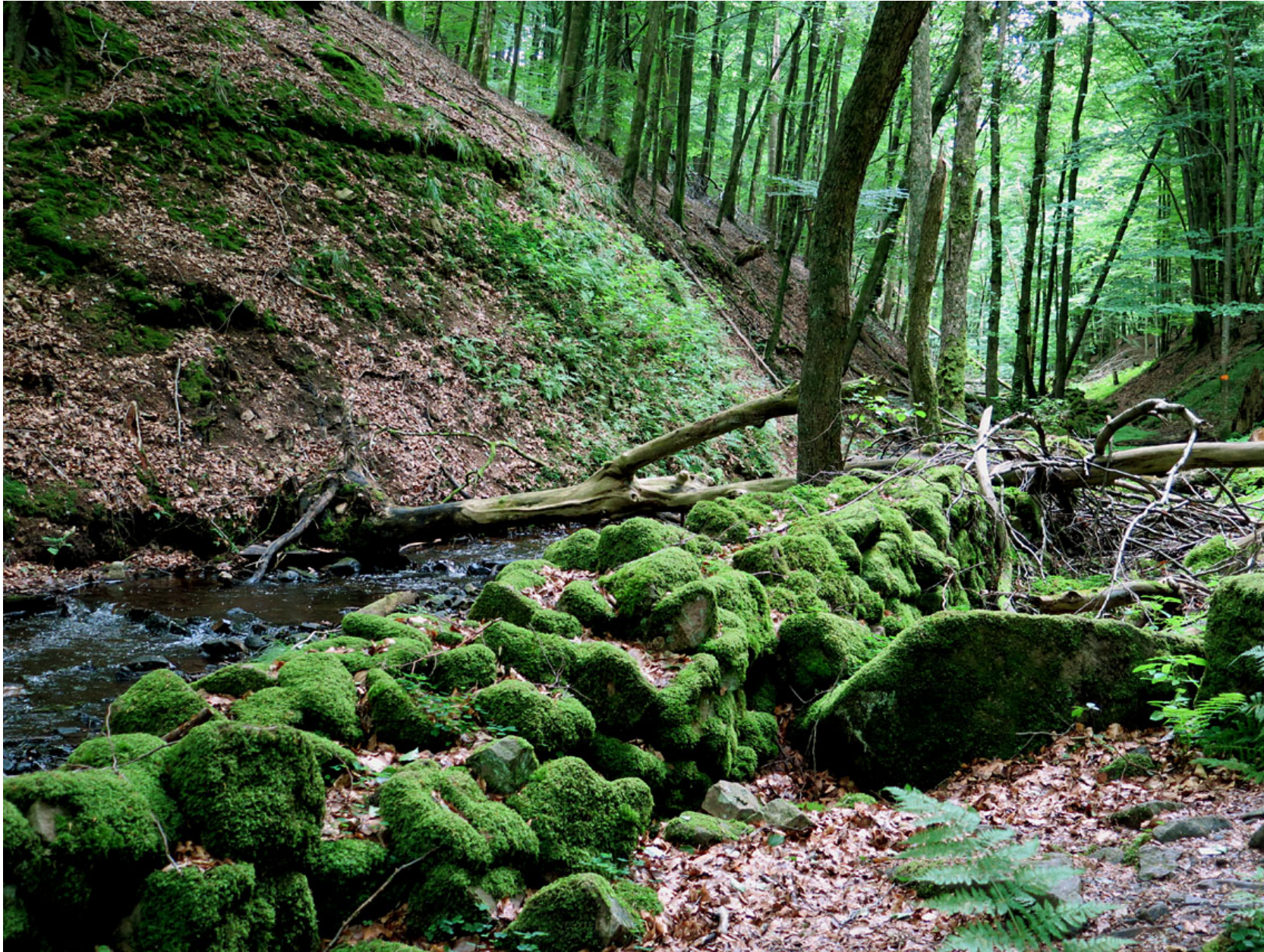
Mossan trivs vid Skäraån i Skäralids dalgång.