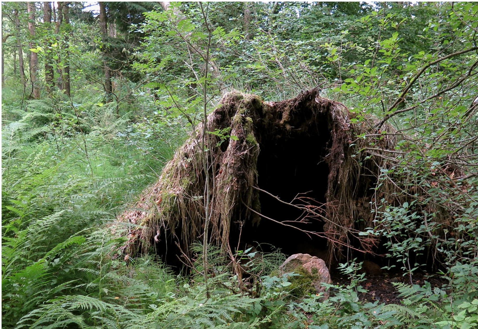
En rotväla lämplig till trollbostad.