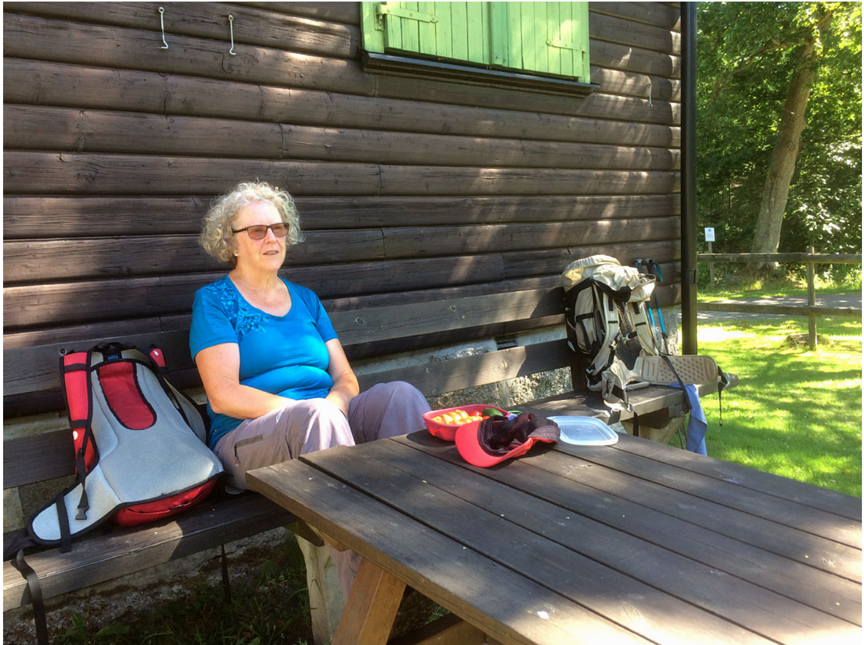
Svettigt och backigt. Pausen vid Ryssbergsstugan är välkommen...