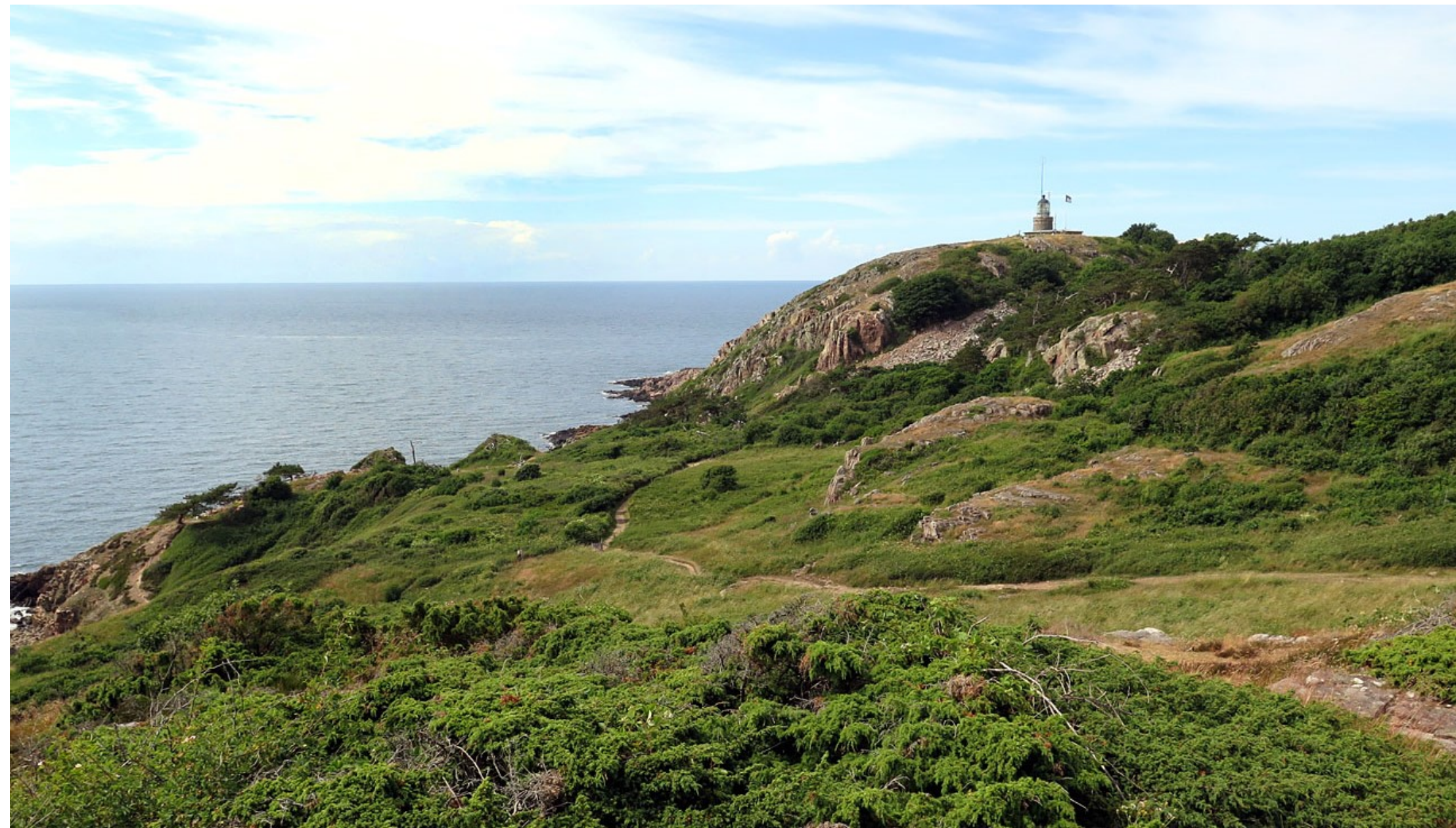
Längst ut på Kullaberg ligger Skandinaviens ljusstarkaste och högst belägna fyr.