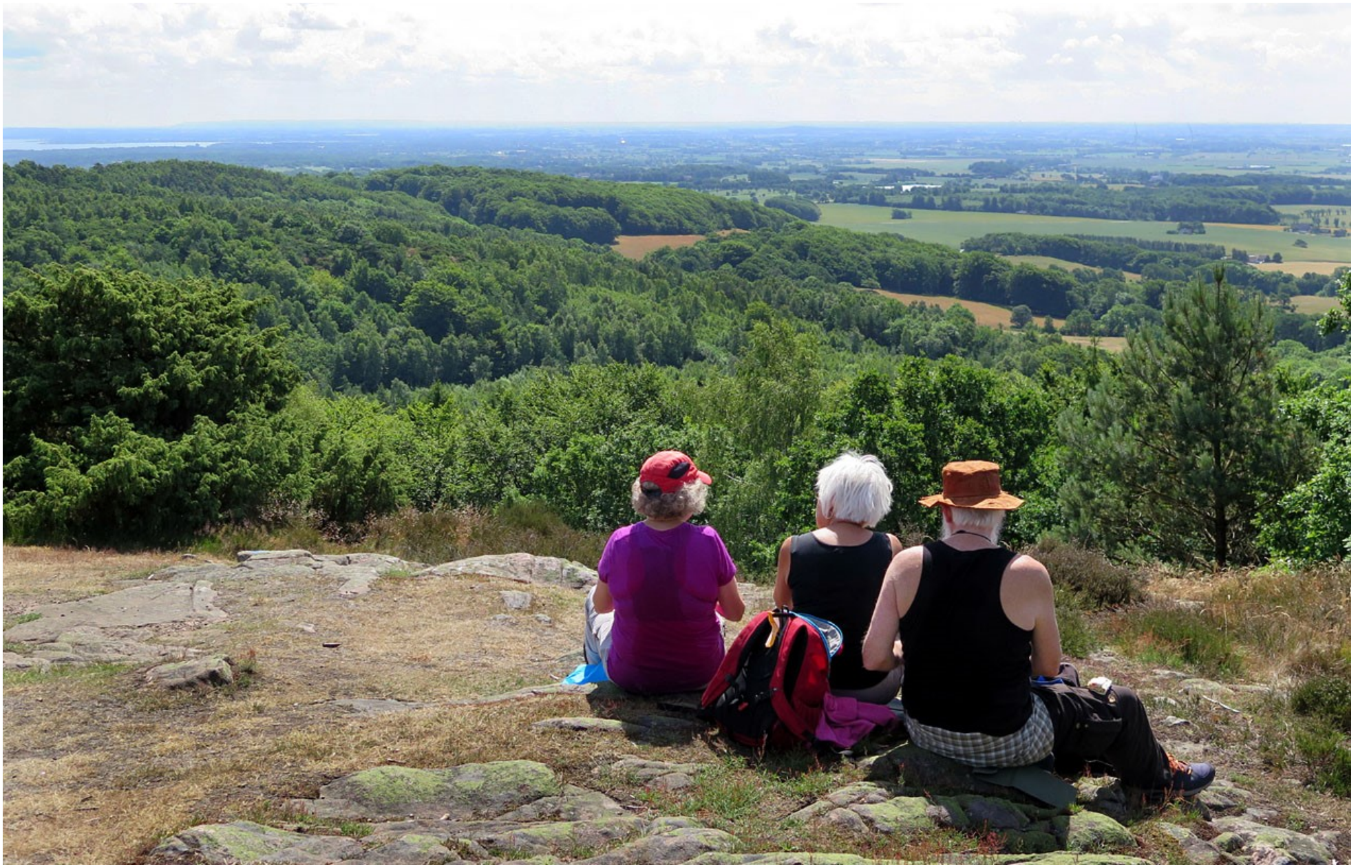
På Kullabergs högsta punkt, Håkull, 188 meter över havet.