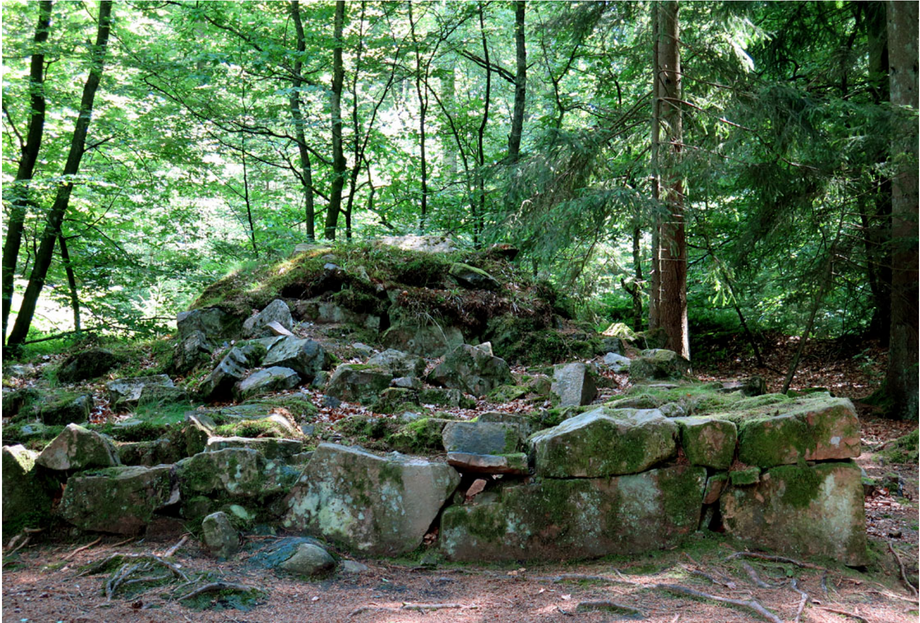
Vid Dejabäcken finns rester av det torp där troligen möllaren vid den näraliggande kvarnen bodde.