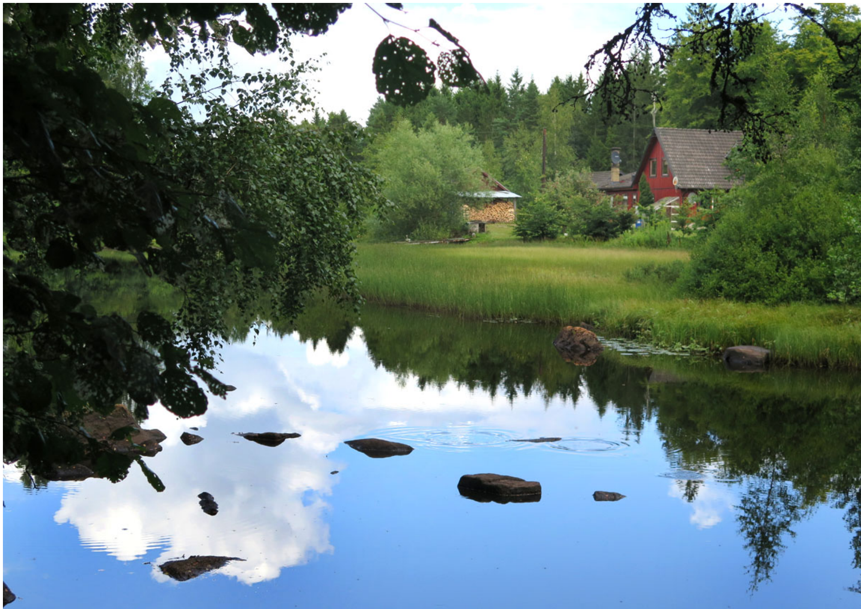
Kvarndammen i Simontorp.