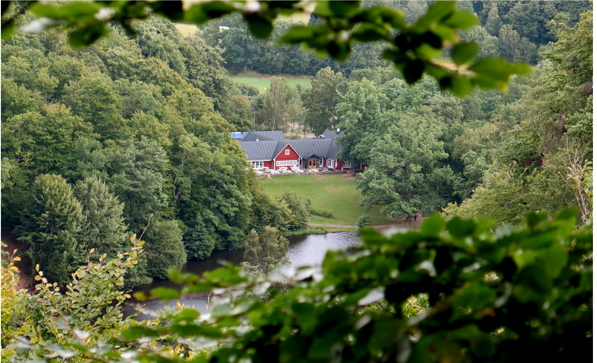
Från södra sidan av ravinen kan man se Skäradammen och Skärals restaurang och naturum.