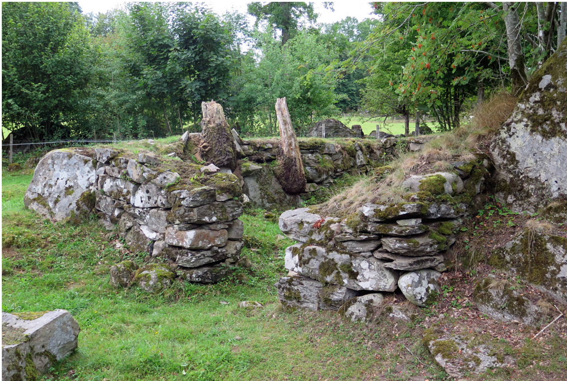
Minne från svunna tider vid Tockarp norr om Glimåkra.