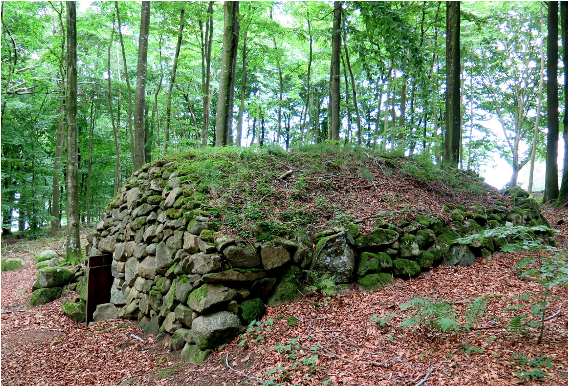
Vid Finnsbo finns denna brydestua (linbasta, torkrum för lin), troligen uppförd vid mitten av 1800-talet.