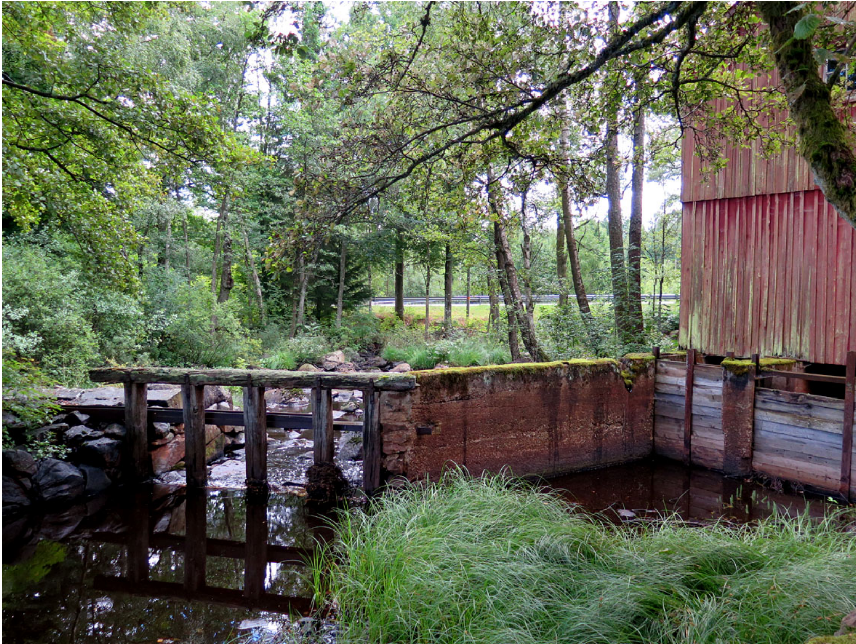
Vid Simontorp finns en gammal kvarn och en såg som idag fungerar som museum.