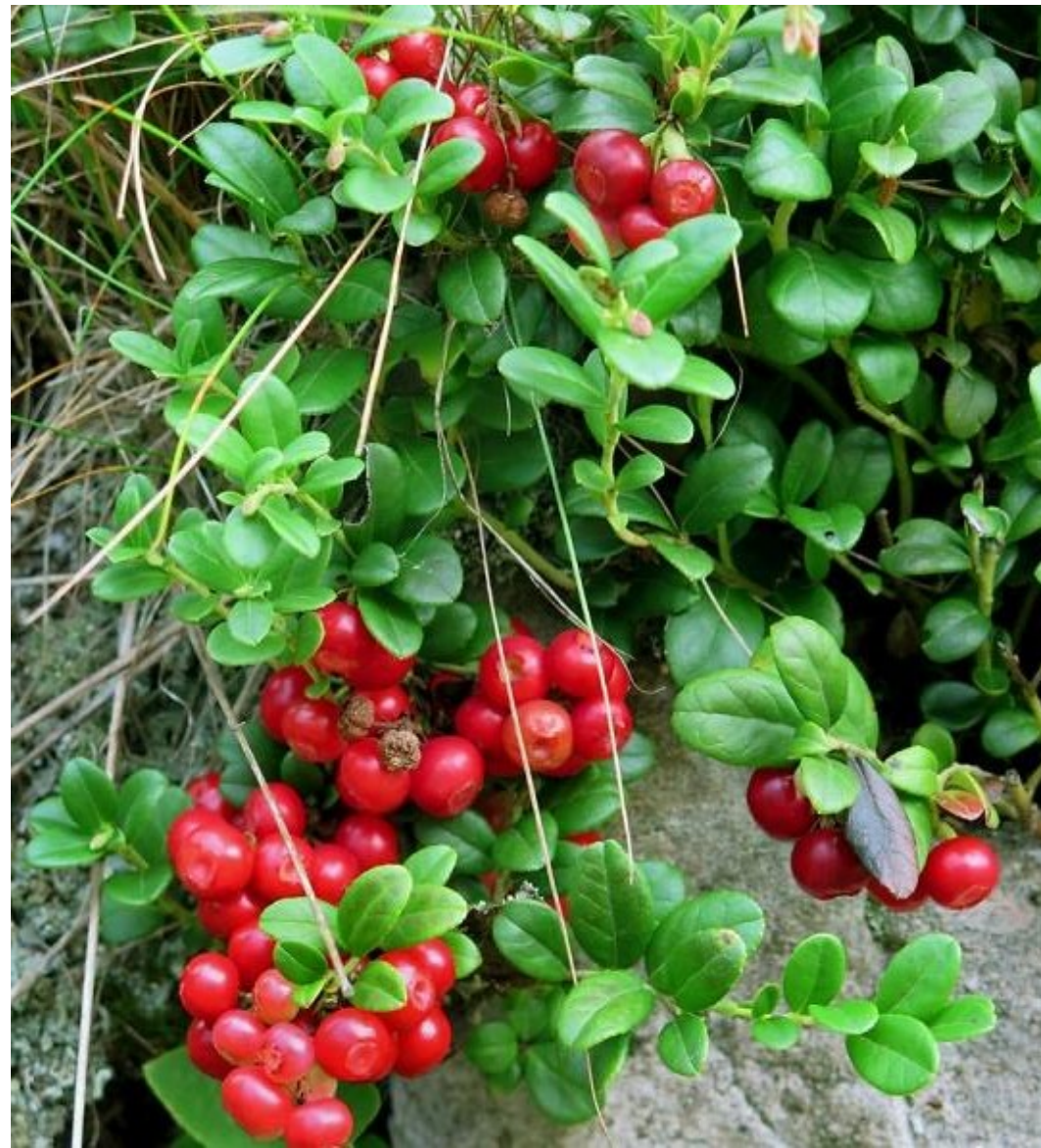
Den rika förekomsten av bär medför täta pauser.