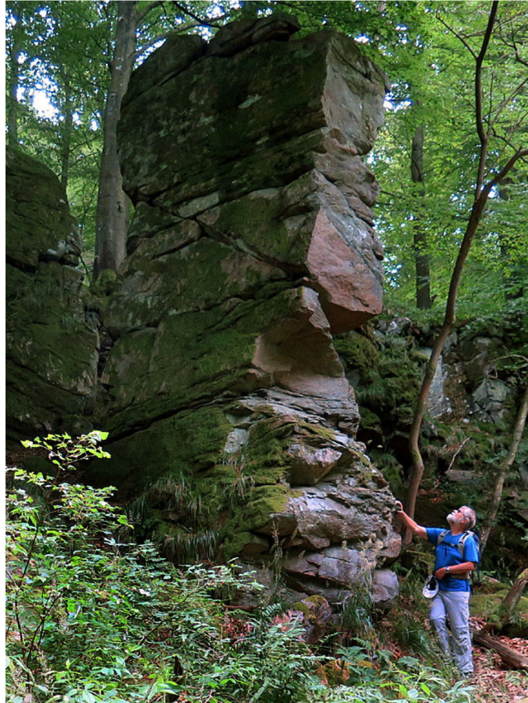
Stenblock i Skorstensdalen, Söderåsens nationalpark.