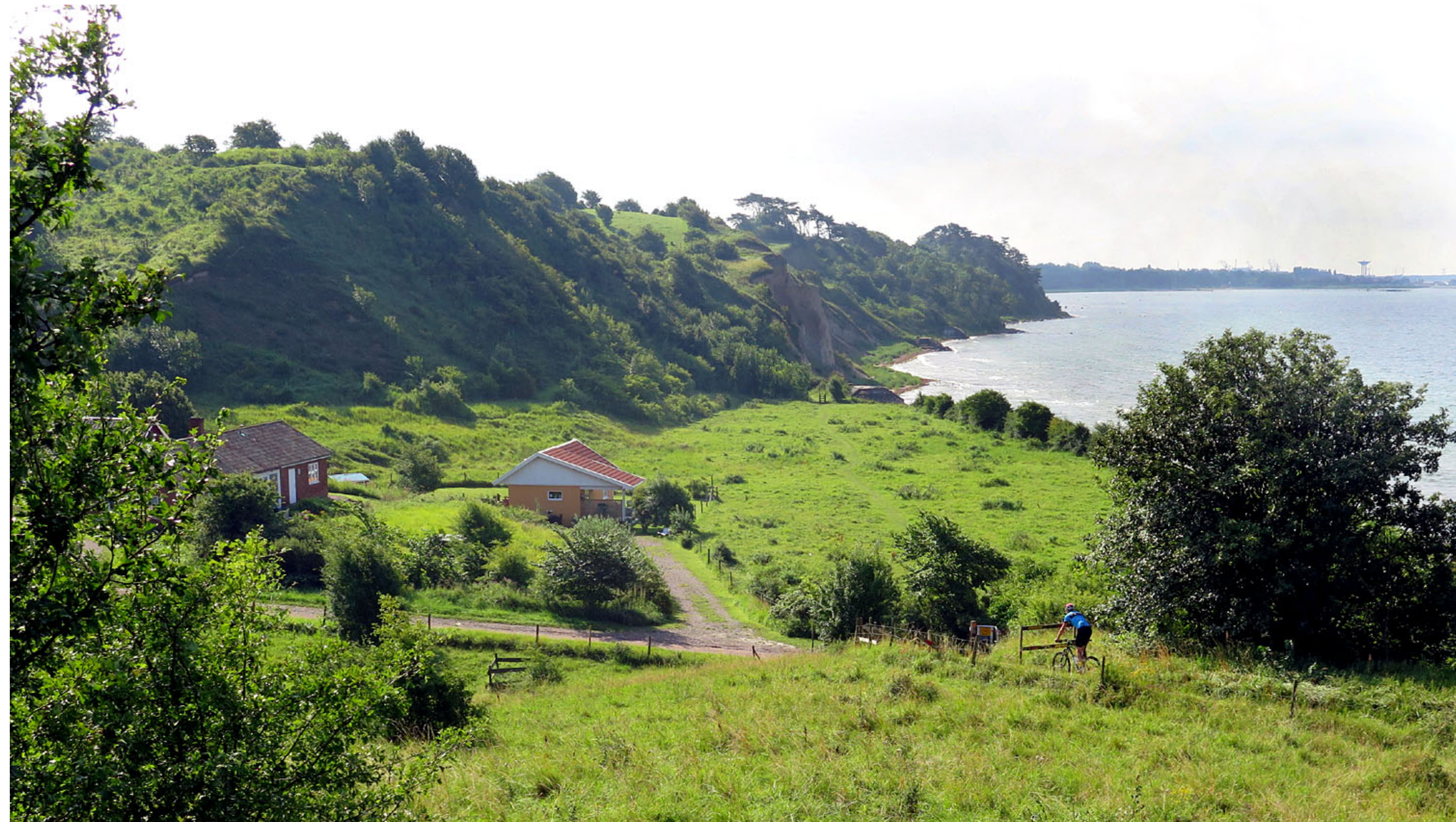
Från Sundvik siktas vattentornet i Landskrona.