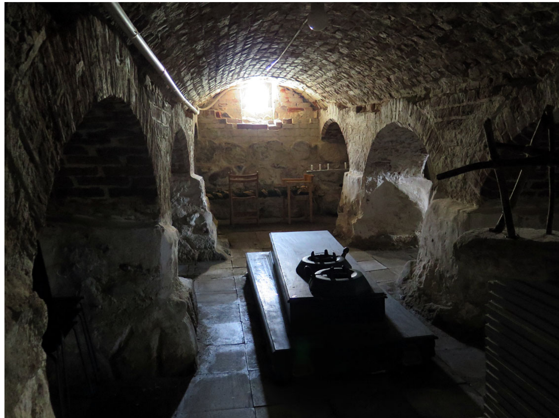
Kryptan i Skanörs kyrka är troligen från 1400-talet.