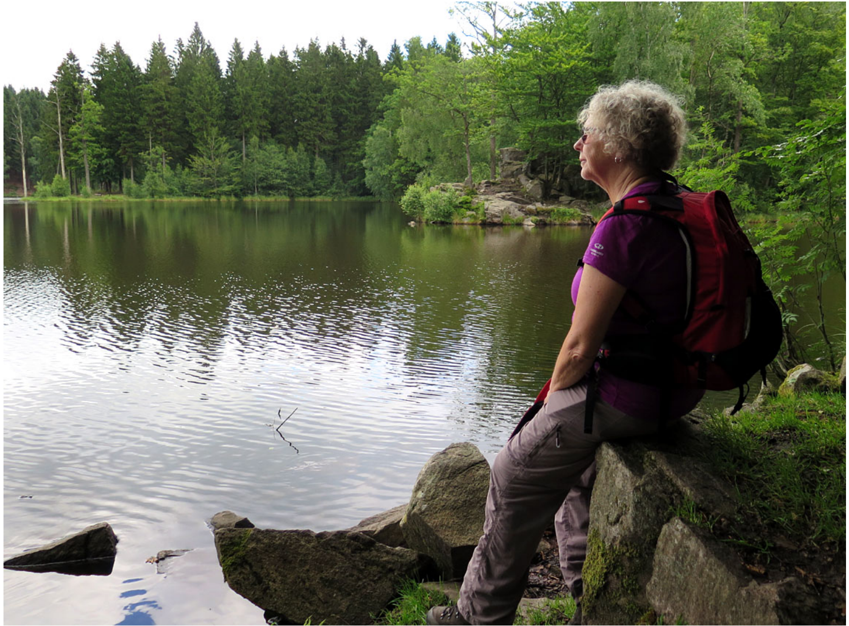
Paus vid Svartesjön, Söderåsen.