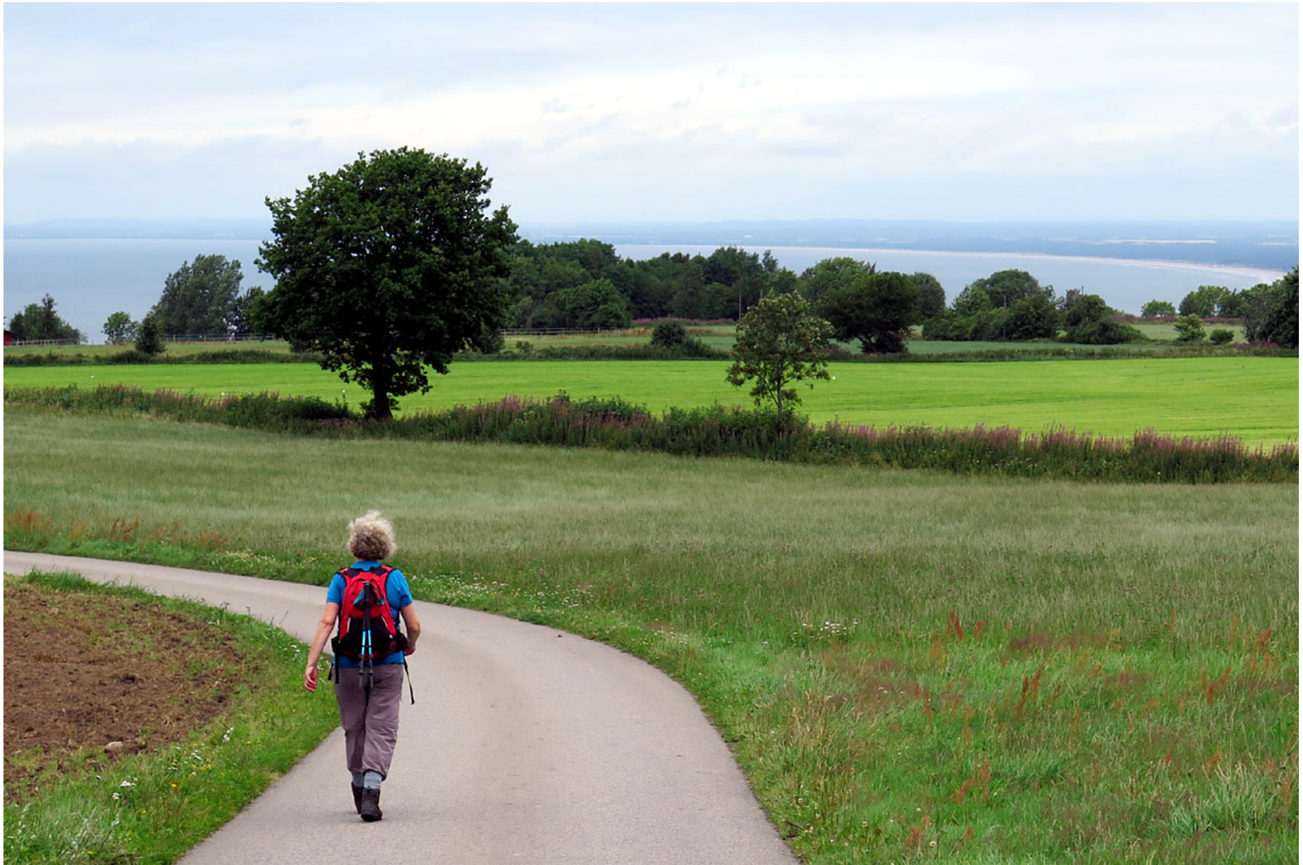
Sedan man passerat Lya sydost om Båstad har man fin utsikt ner mot Laholmsbukten.