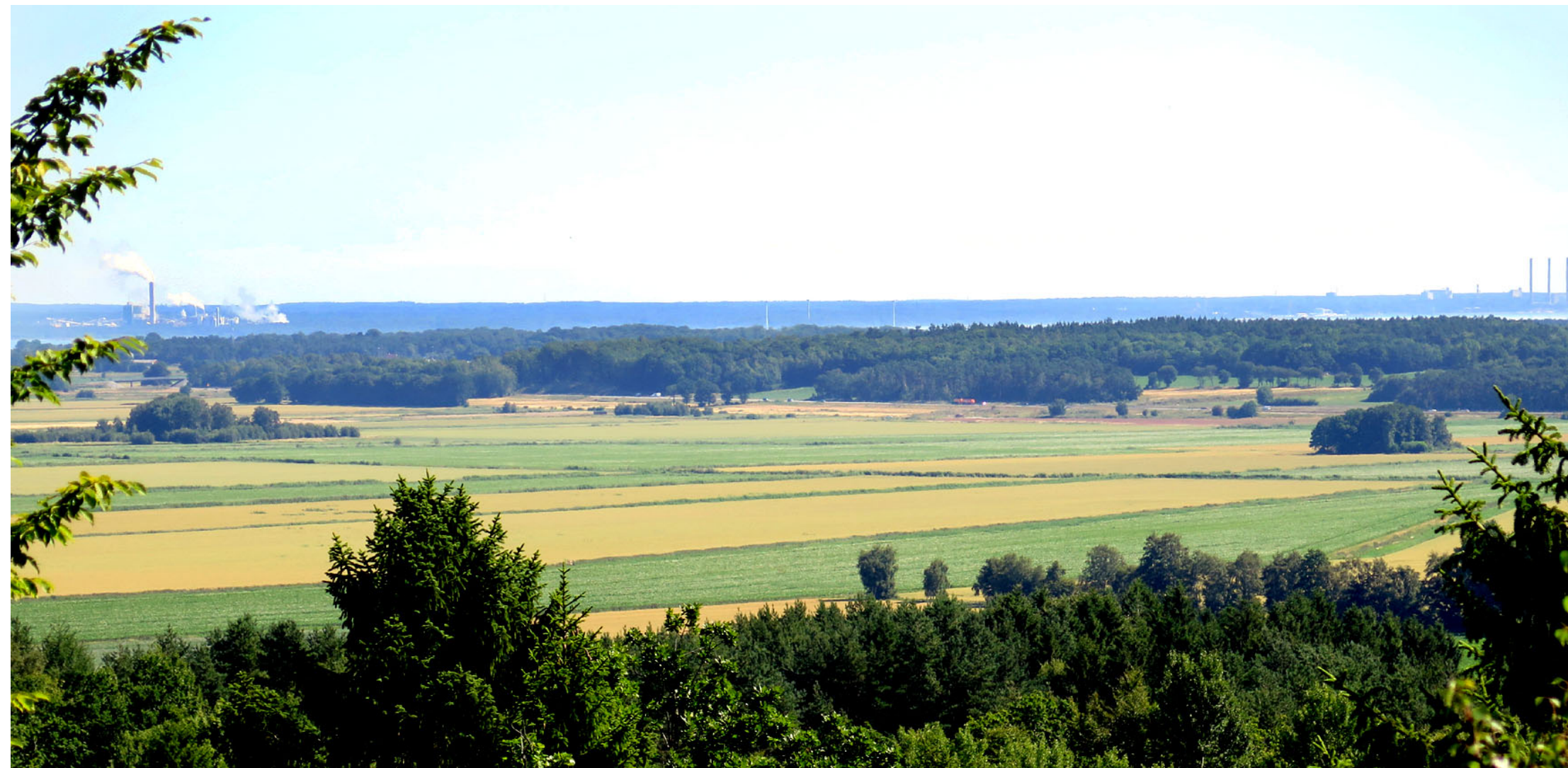
Norr om Sölvesborg ser man Mörrums bruk och Karlshamnsverket på andra sidan Pukaviksbukten.