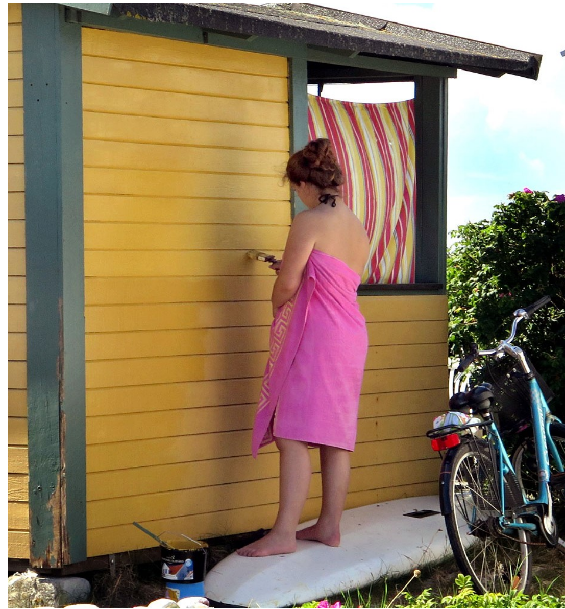
Målning av badhytter utförs i matchande shorts respektive något udda målarklädsel.