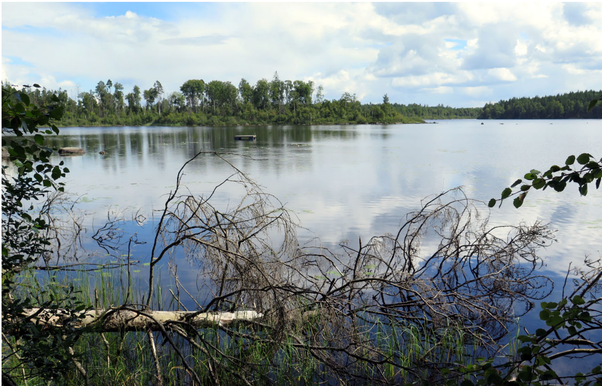
I Vesslarpsjön sydost om Lönsboda ligger Magö.