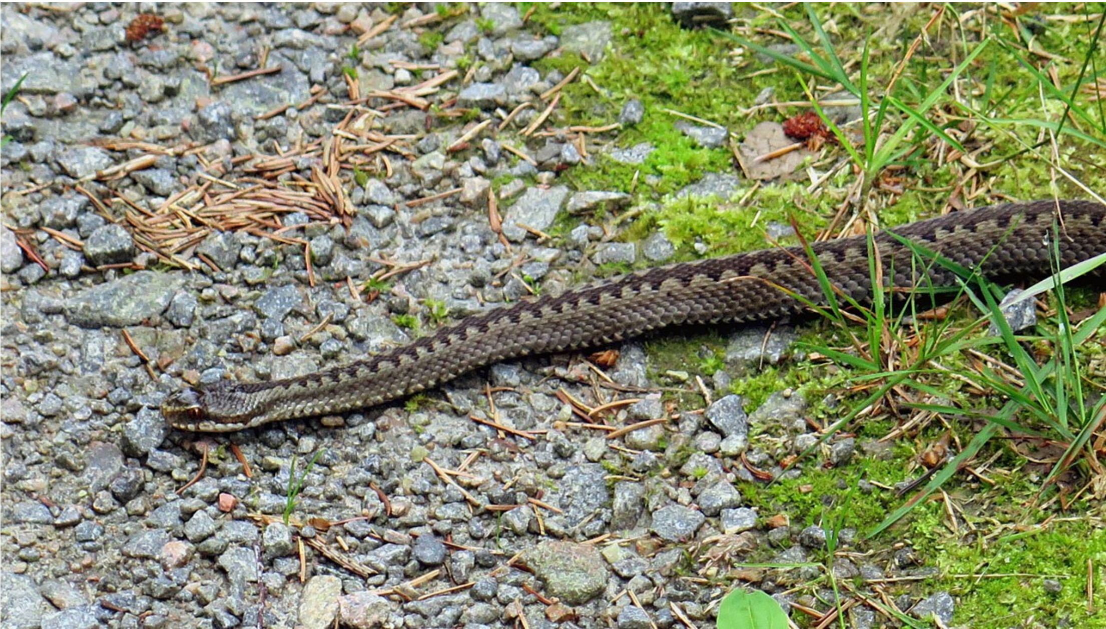
På Hallandsåsen korsar en Vipera berus (huggorm) vår väg.