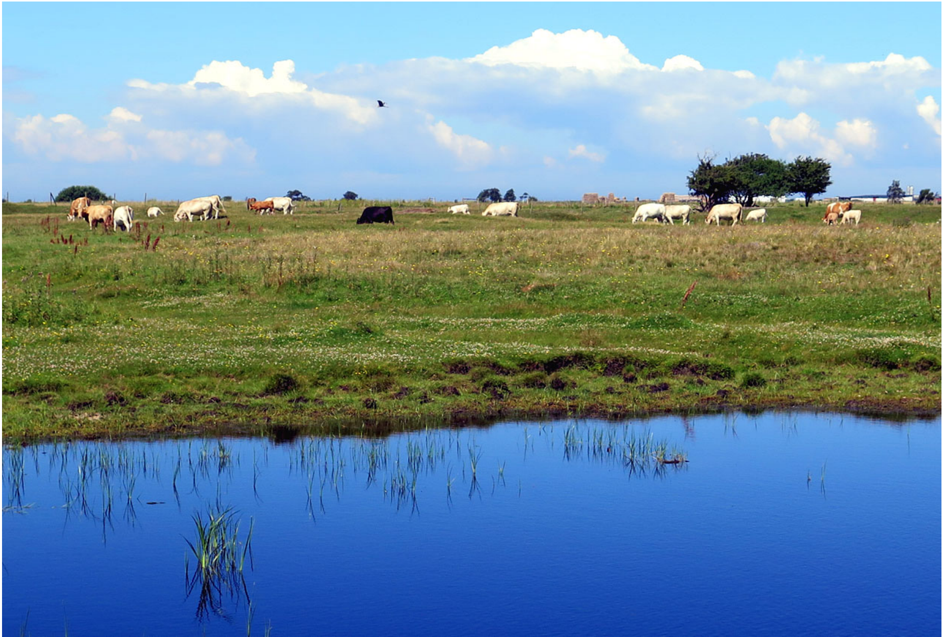
Från Skånes nordvästra hörn förflyttar vi oss till dess sydvästra och Skanörs ljung.