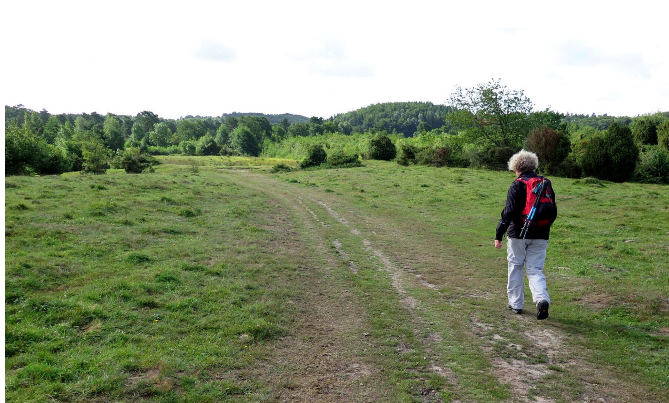
Söder om Genarp ligger Risens naturreservat där hedmarken breder ut sig.