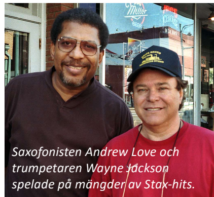
Saxofonisten Andrew Love och trumpetaren Wayne Jackson spelade på mängder av Stax-hits.

Jackson, pianisten Isaac Hayes, organisten Booker T. Jones och blåsarna Wayne Jackson och Andrew Love. Utan dessas medverkan hade världen aldrig fått uppleva det