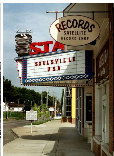
Den övergivna Stax-byggnaden på 926 E. McLemore, Memphis, året innan den revs. År 2003 öppnades The Stax Museum Of American Soul Music där en gång den legendariska skivstudio stod.