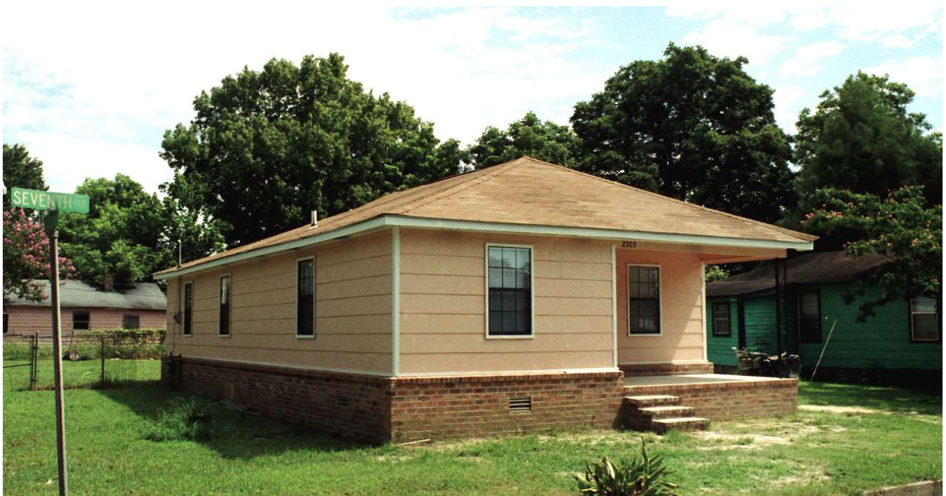
2303 7th Street, Clarksdale, Mississippi. Foto: Charley Nilsson, 2004.