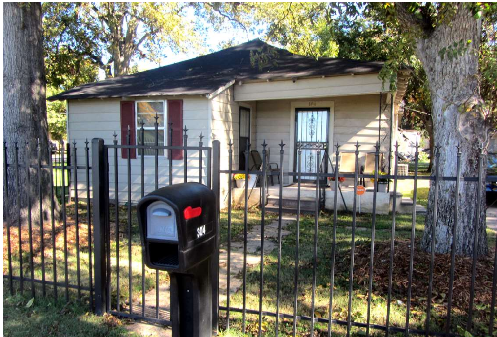
Här föddes Ike Turner.

För den stora allmänheten kom Ike Turner framförallt att förknippas med sångerskan Annie Mae Bullock, mera känd som Tina Turner. Tillsammans utgjorde