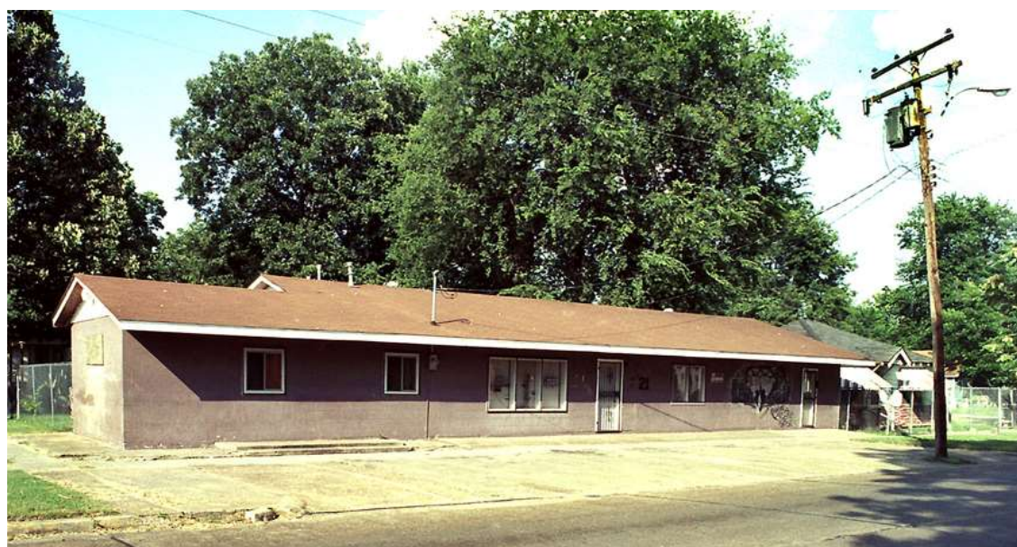
Club Casablanca, 1102 Nelson Street i Greenville, där det spelades in förträffliga exempel på opolerad downhome blues.