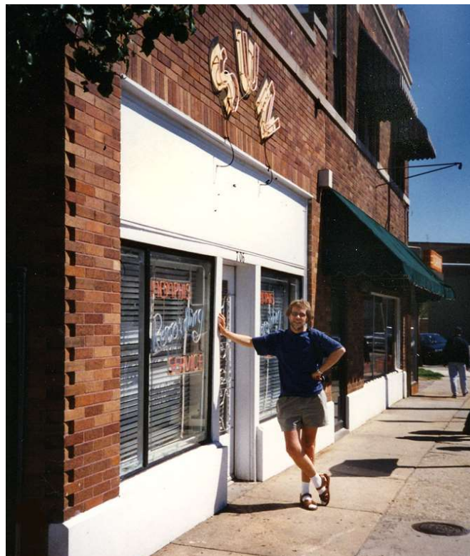
Utanför studion i september 1996.

Sam Phillips spelade även in countryartister, och i november 1955 gick Johnny Cash debutplatta Cry! Cry! in på försäljningslistorna. Även artister som Carl Perkins, Billy Lee Riley, Jerry Lee Lewis, Warren Smith och Roy Orbison kom att söka sig till Sun-studion, där inspelningarna försågs med det bandeko Phillips var en mästare i att hantera.