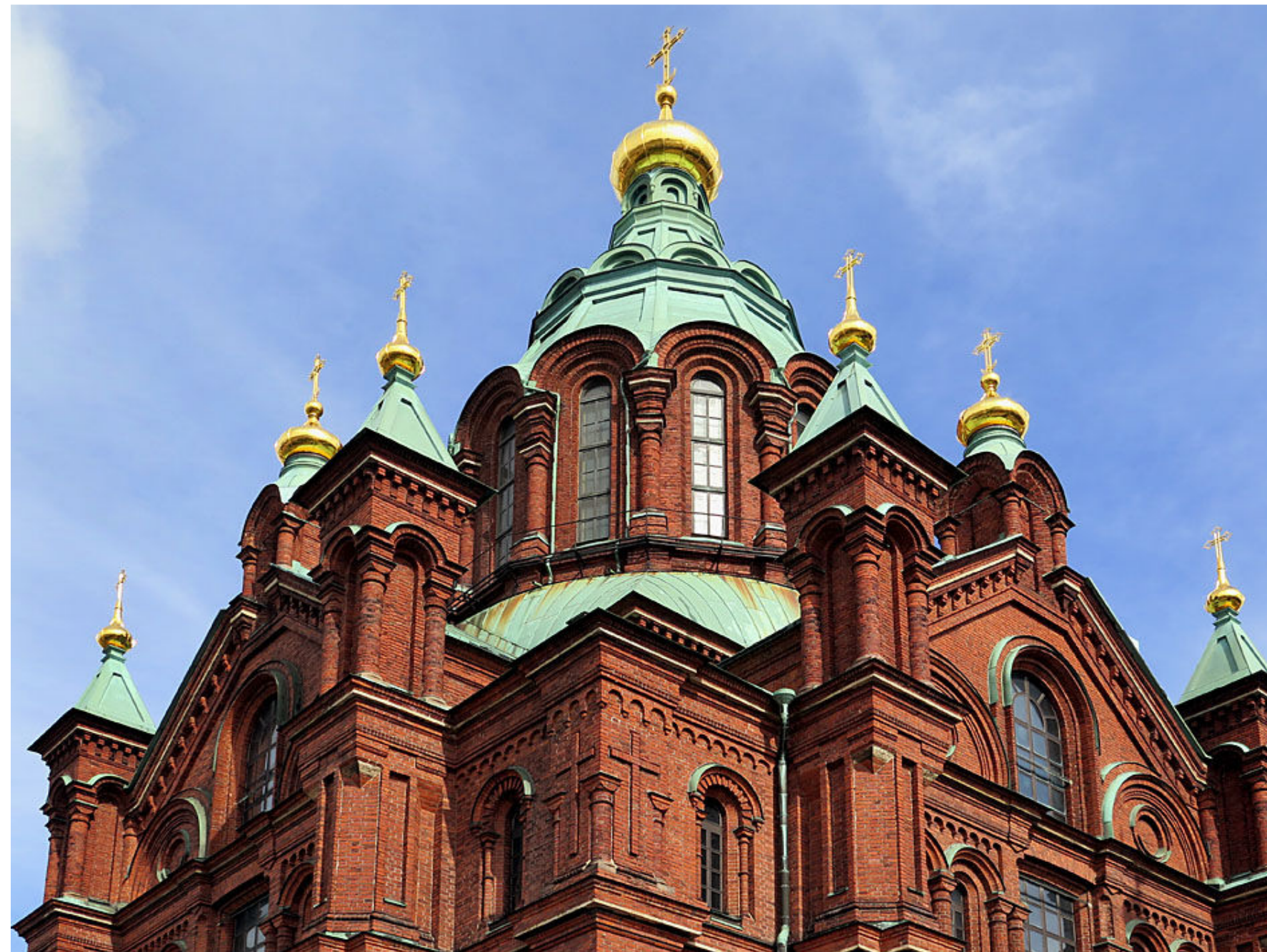
Uspenskijkatedralen är västeuropas största ortodoxa kyrka och togs i bruk 1868.