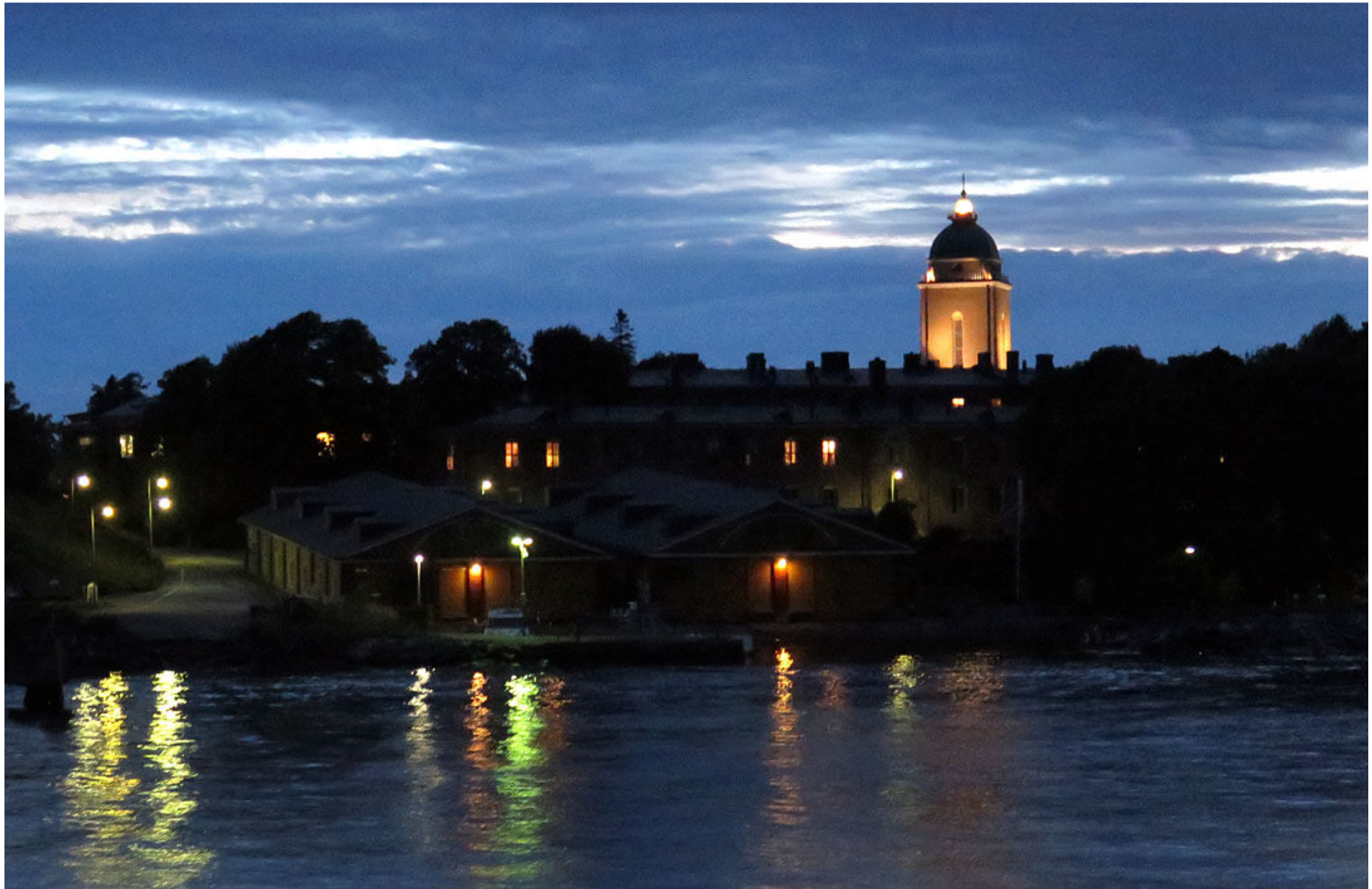
Tornet på Sveaborgs kyrka fungerar även som fyrorn.