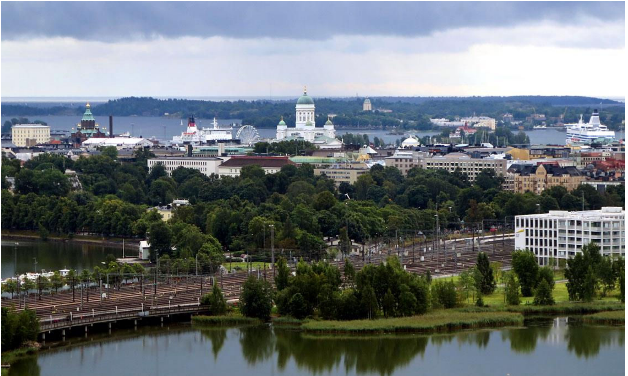
Från Stadions torn ser man i sydväst bland annat Uspenskijskatedralen och domkyrkan, liksom Sveaborg och hamnen med stockholmsfärjorna.