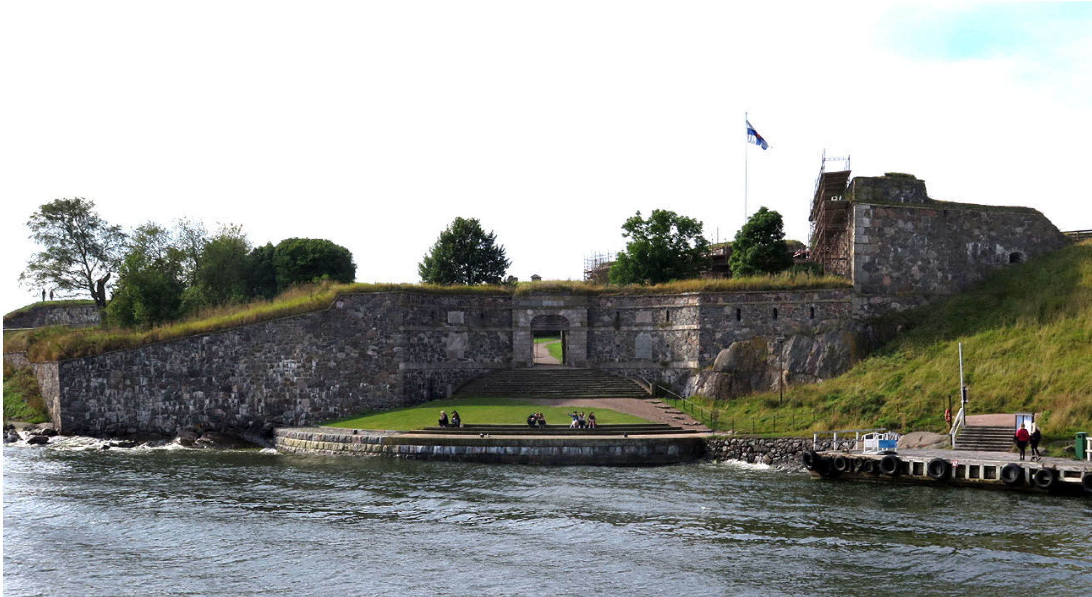
Kungspporten byggdes 1753–1754 och är den gamla huvudingången till Sveaborg.