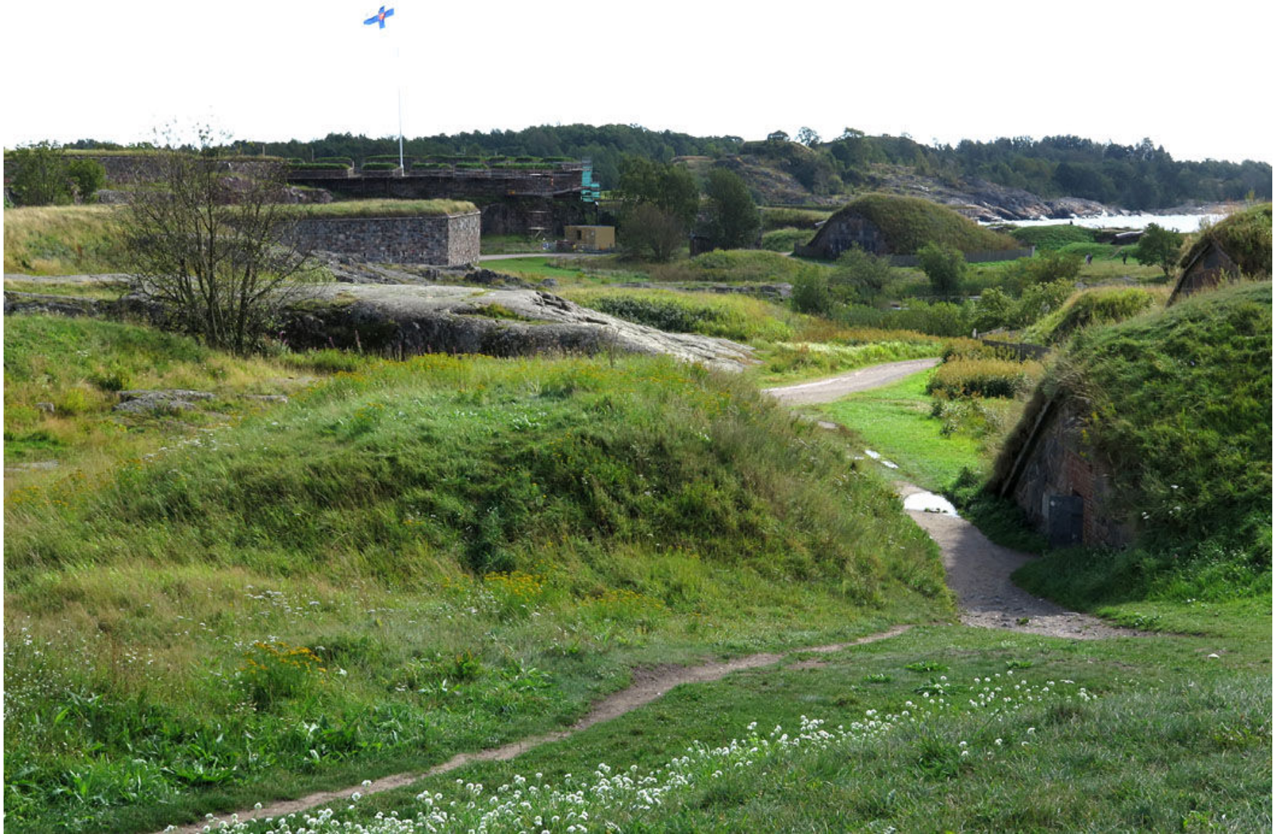
Befästningsverk på Gustavsvärd, som utgör södra delen av Sveaborg.