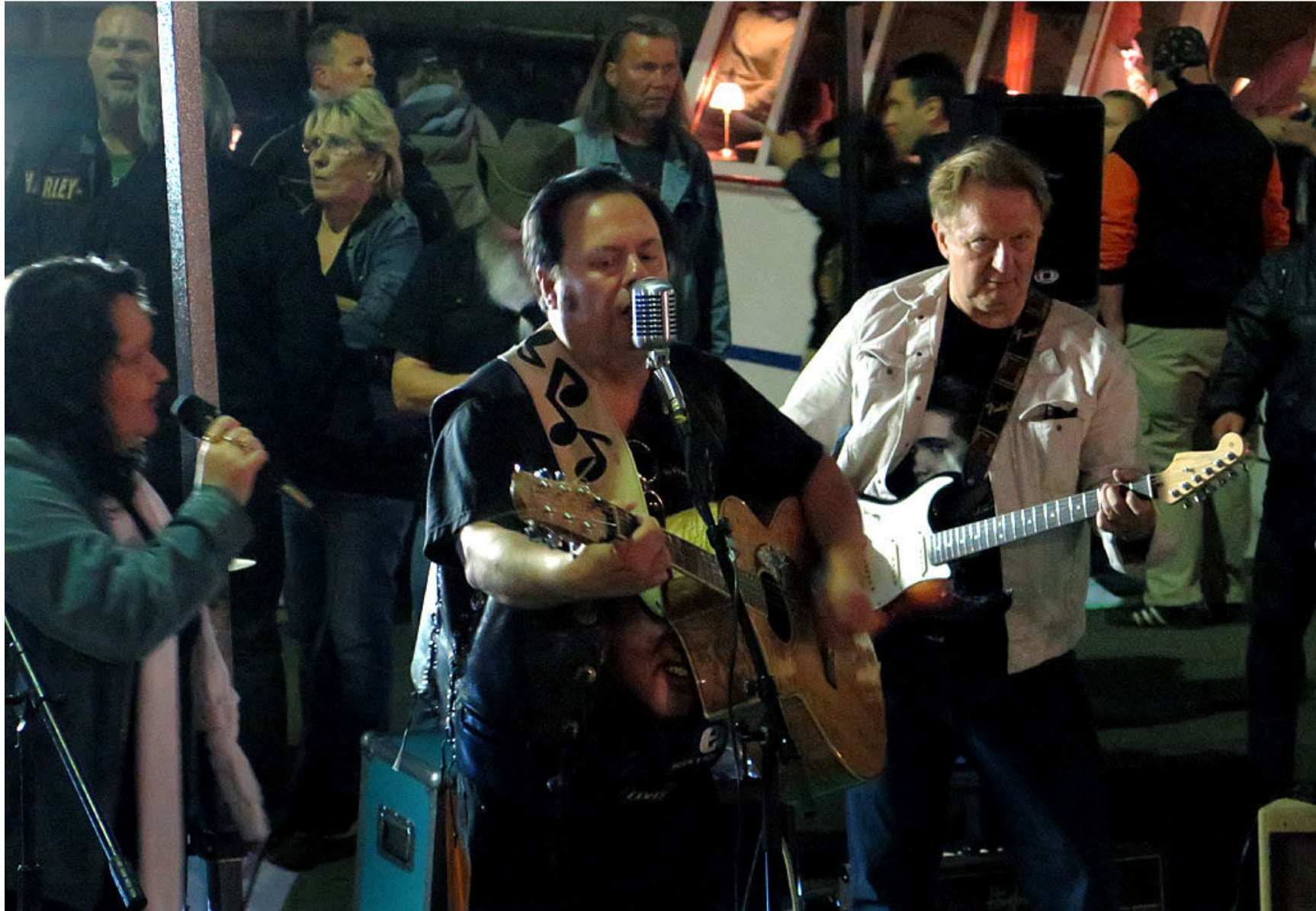
Denna lördagskväll har åtskilliga vänner av så kallade raggarbilar sin månatliga samling på Salutorget.