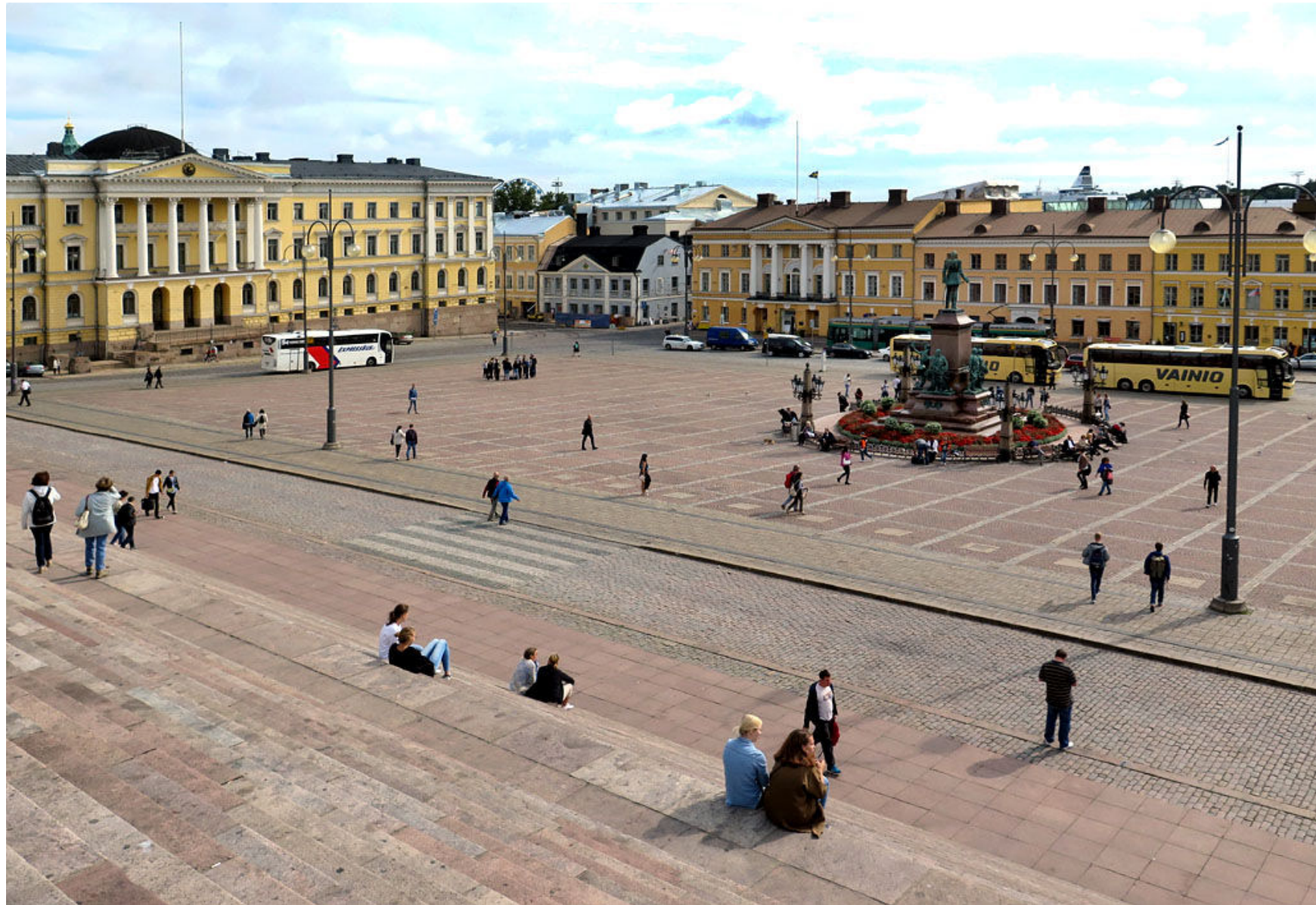
Från Domkyrkans trappa ser man ut över Senatstorget, som bland annat omges av Statsrådsborgen (t.v.) och det ljusblå Sederholmska huset, det äldsta bevarade stenhuset i staden.