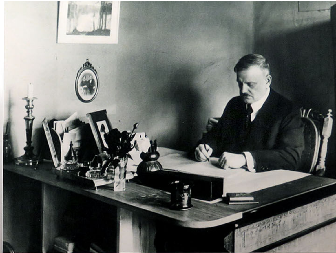
I Stadshuset firar man Jean Sibelius 150-årsdag med en utställning där man även kan lyssna på några av hans kompositioner.