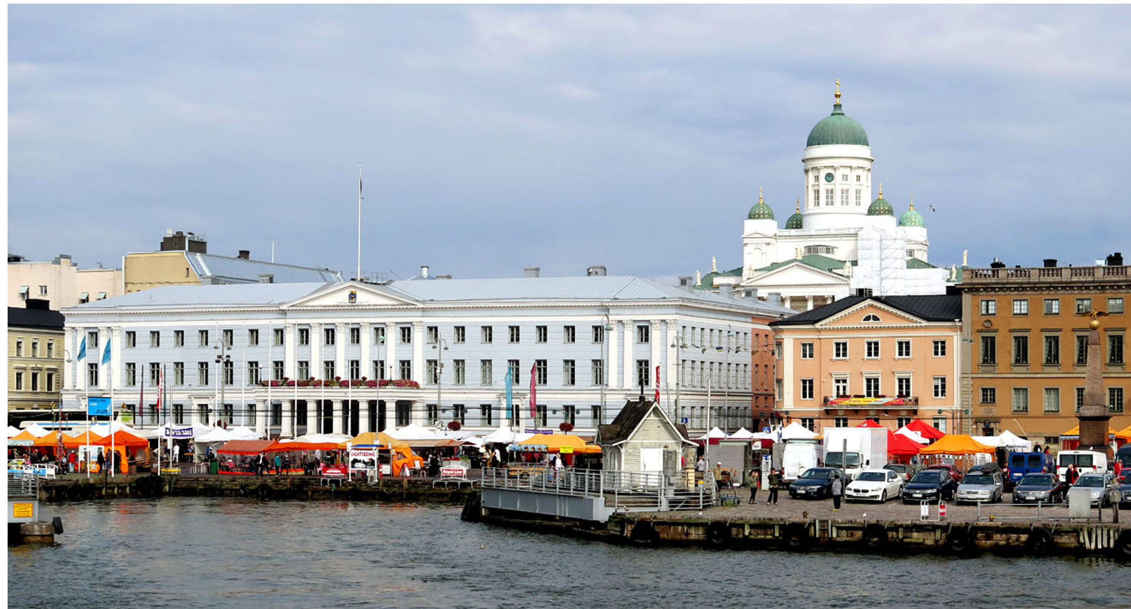
Bakom Salutorgets marknadsstånd står det ljusblå stadshuset, och i det bruna huset till höger finns svenska ambassaden. Ovanför hamnen tronar domkyrkan.