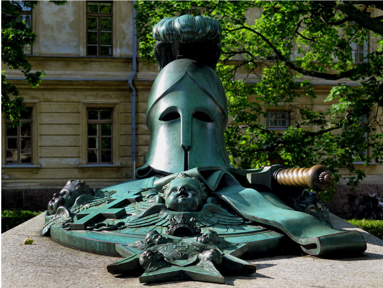
Byggandet påbörjades 1748 och leddes av överstelöjtnant Augustin Ehrensvärd (1710–1772), som också är begravd på området.