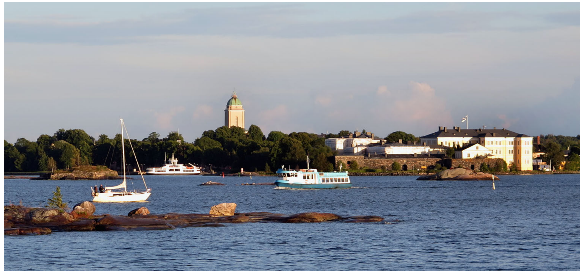
På Svartöarna och Vargön strax utanför Helsingfors ligger sjöfästningen Sveaborg (Suomenlinna). Den grundades av kung Adolf Fredrik, och var en viktig svensk bas i kriget mot ryssarna.