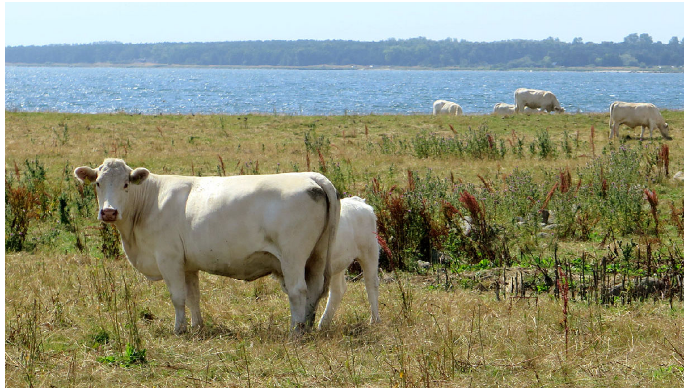
Vid Morfarshamn norr om Skillinge.