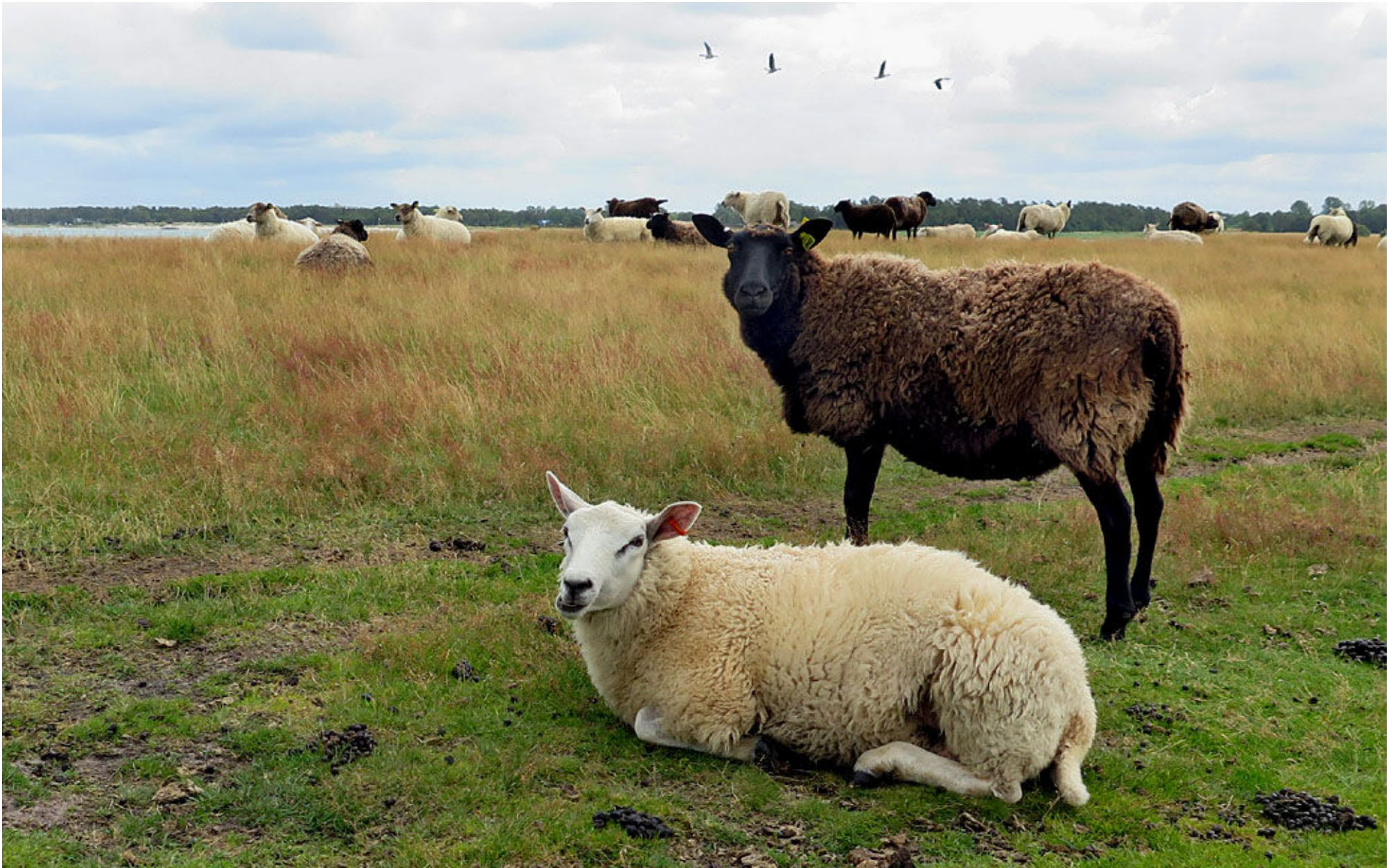
5. Längs södra delen av Skälderviken finns gott om betesmark för såväl får som nyfikna kor.