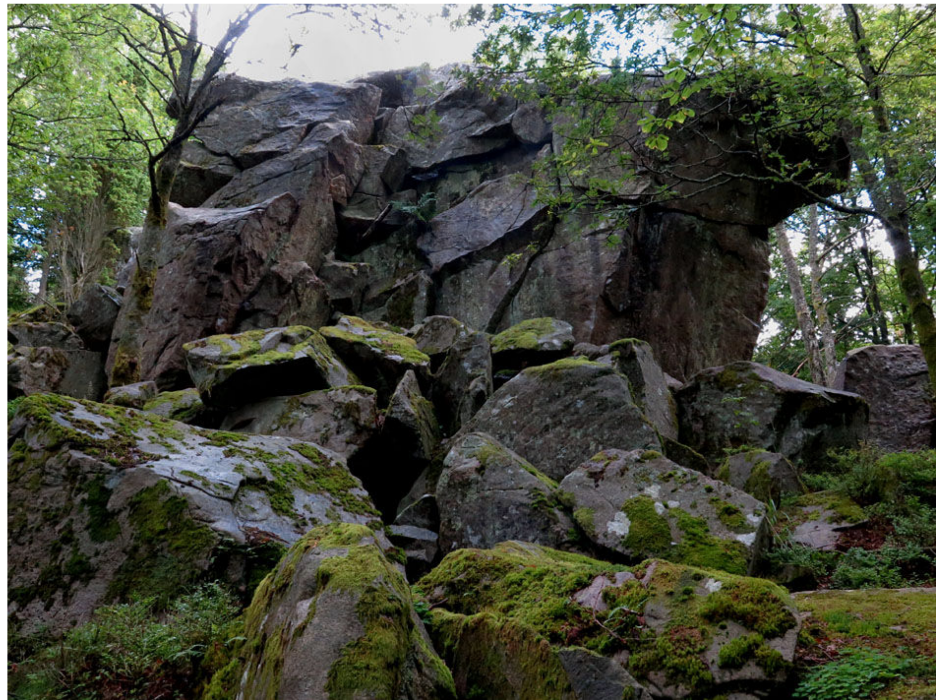
Stenblocken vid Snibe stua hittar man öster om Stavershult.