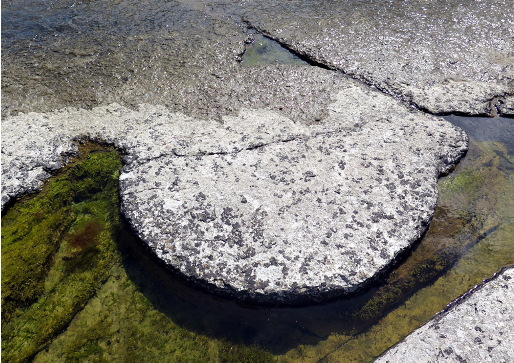
På 1800-talet högg man ut kvarnstenar ur kalkstenshällarna vid Gislövshammar