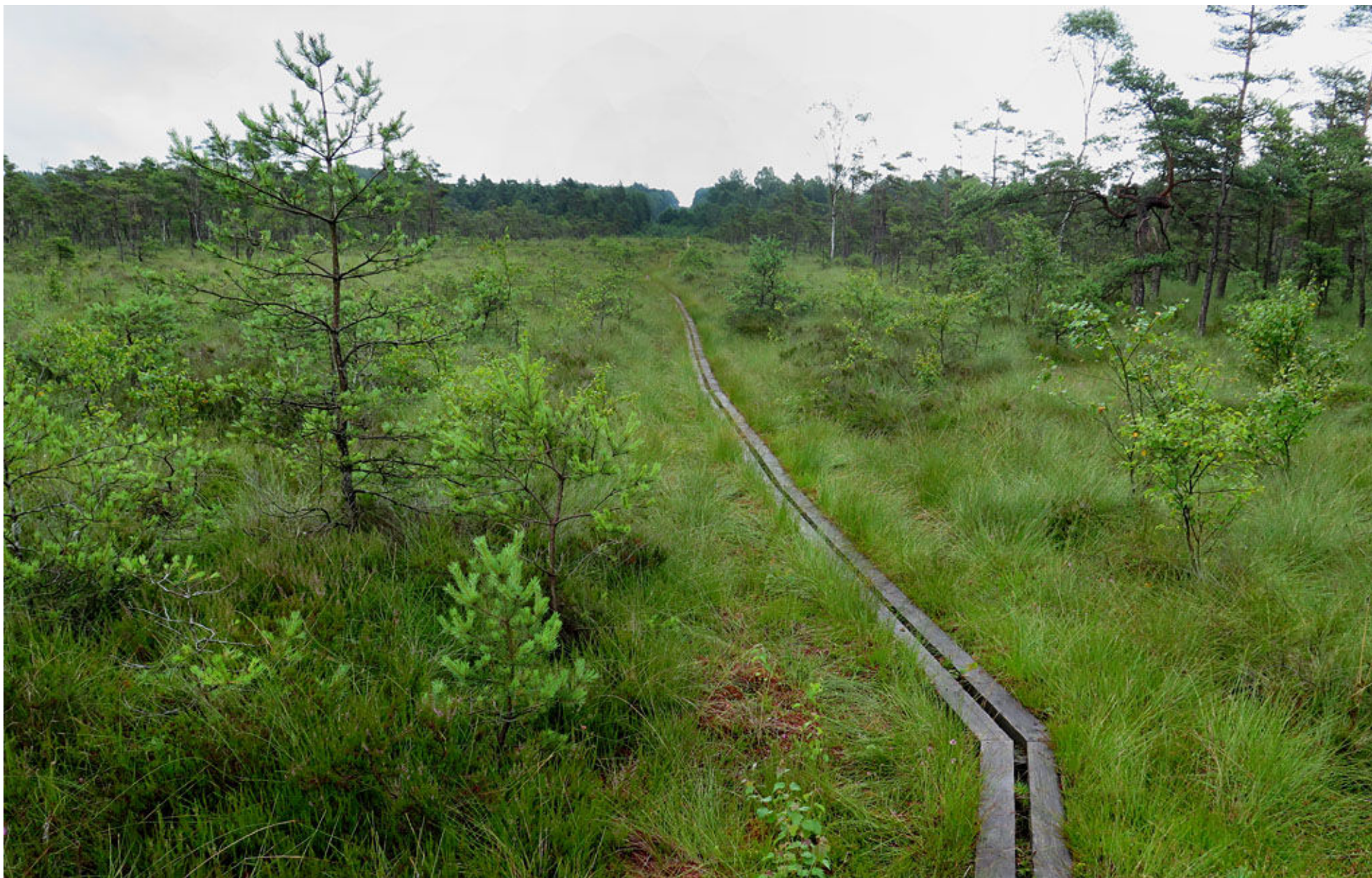
Väster om Åsljunga går leden över stora mossar.