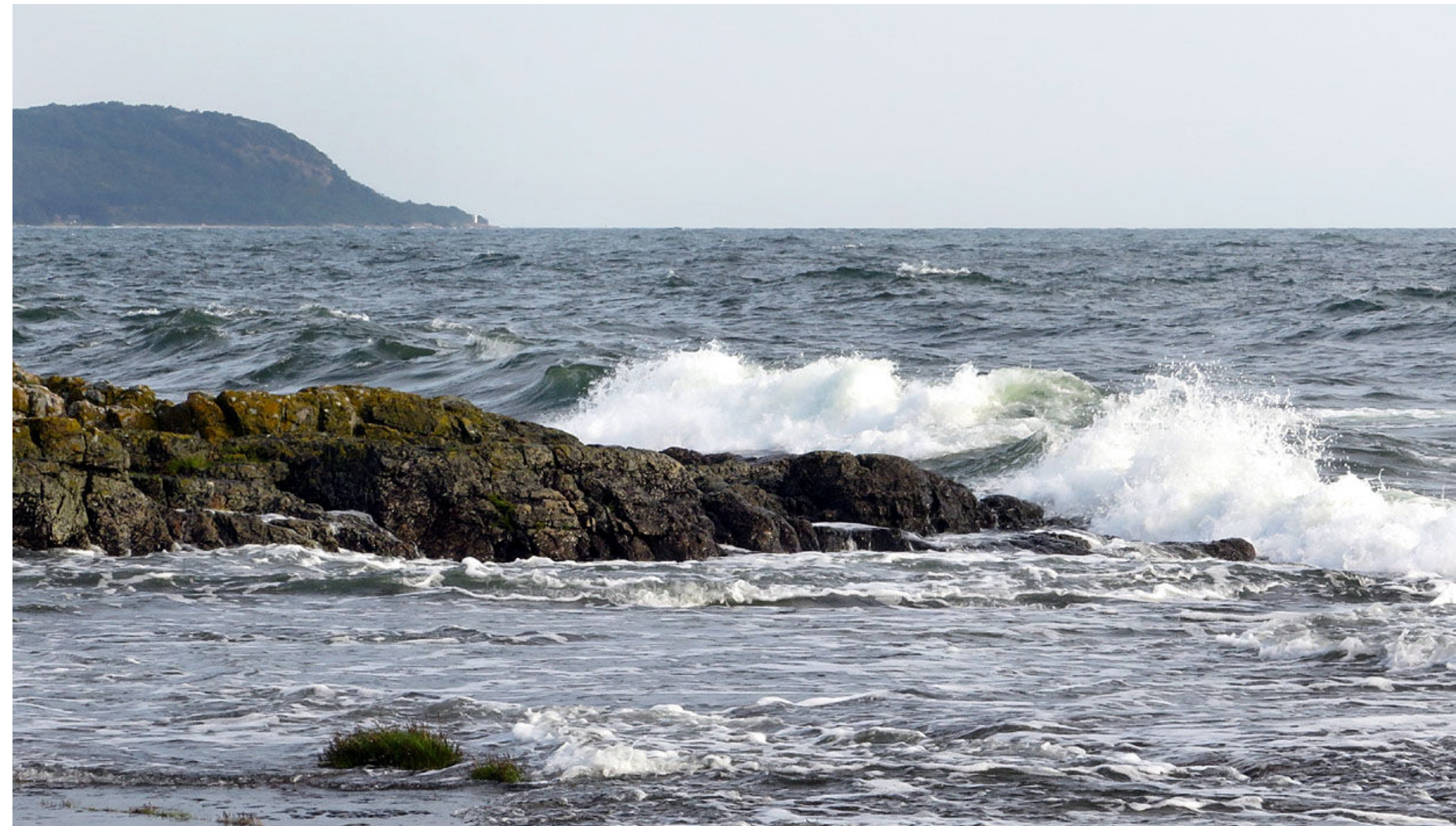
Prästens badkar var denna dag översköljt av vågorna.