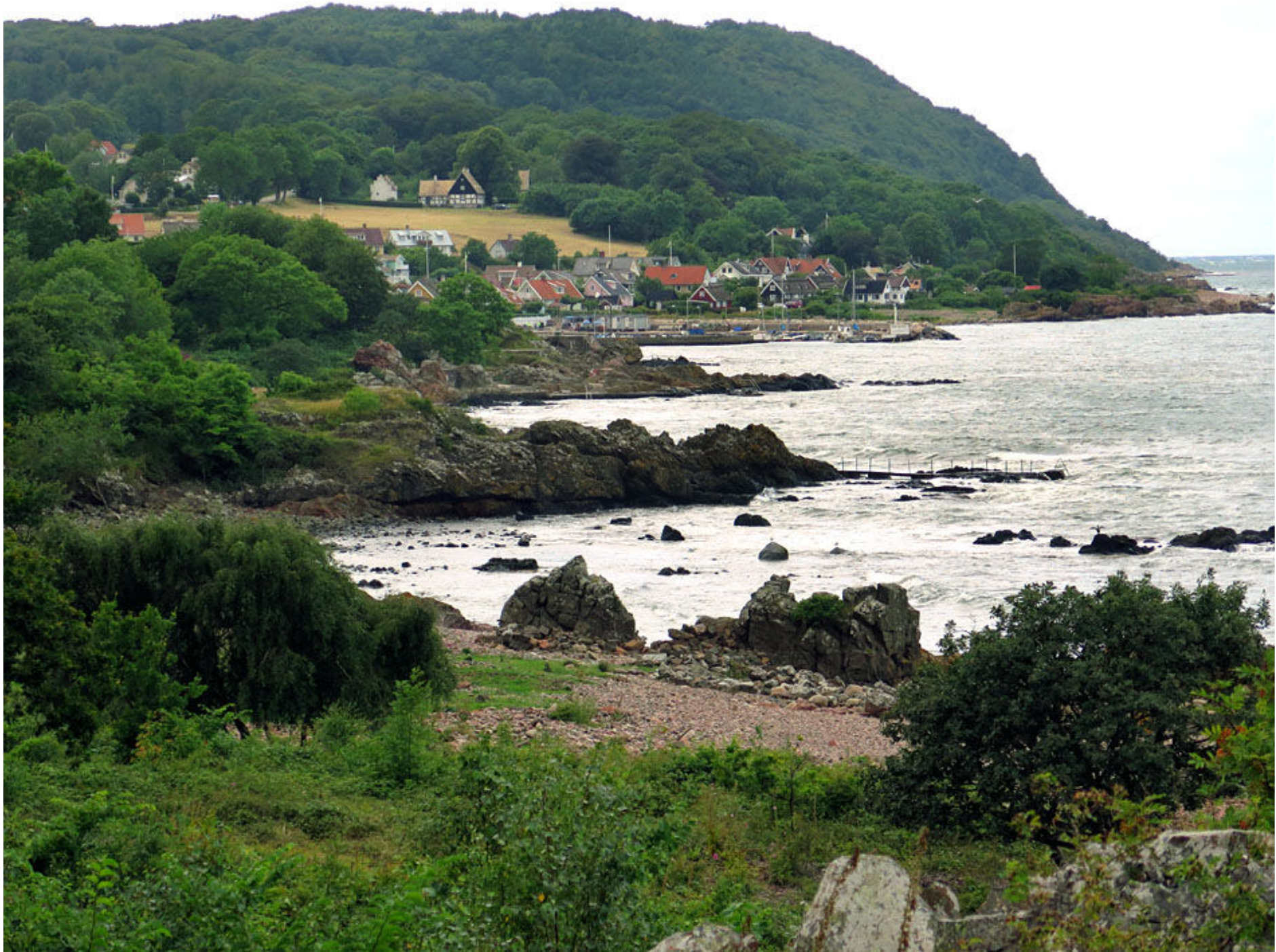
Arild och Kulla- berg.