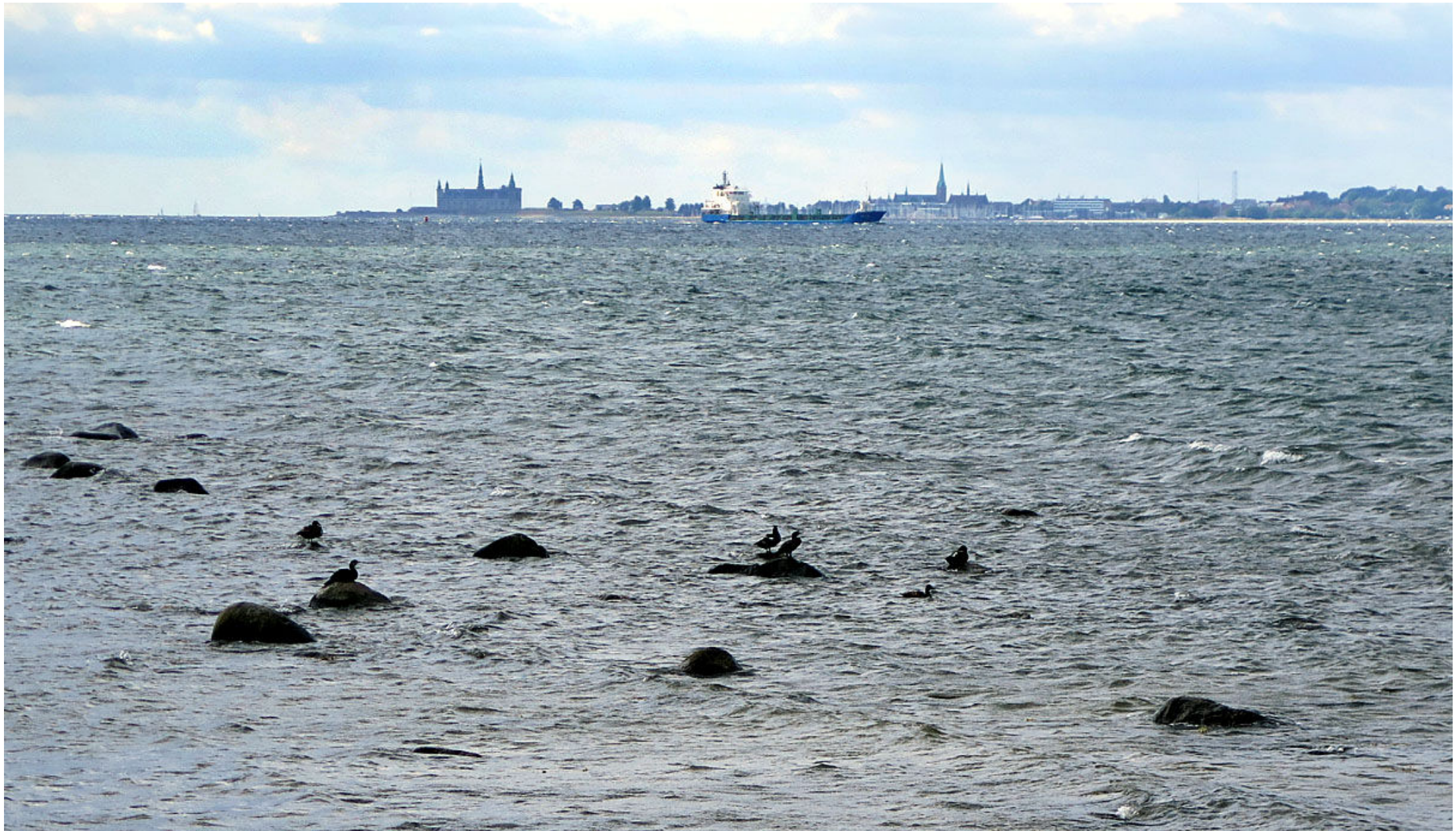
3. I trakten av Domsten har man denna utsikt mot Helsingör.