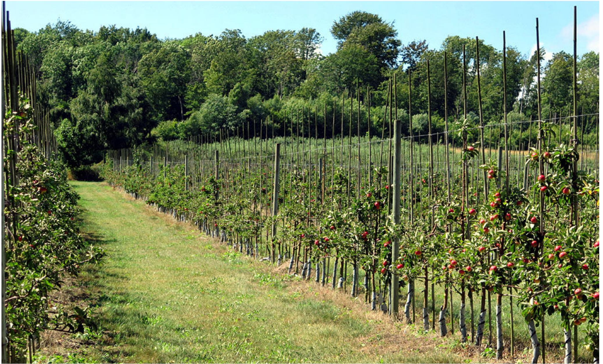
Vad vore Kivik utan sina äppelodlingar.