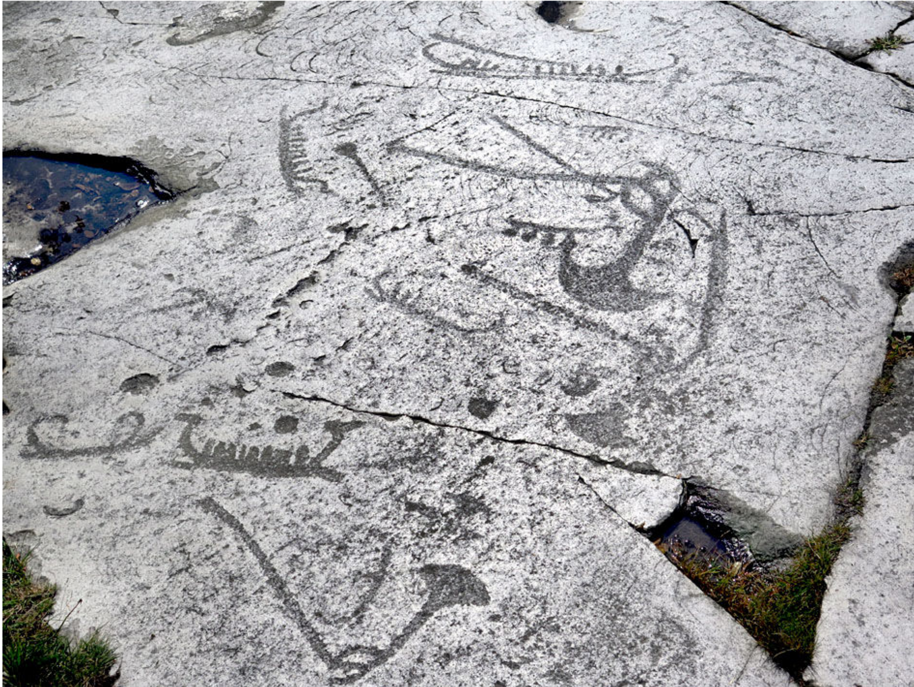
6. Strax söder om Simrishamn finns Horsa-hallens hällristningsområde.