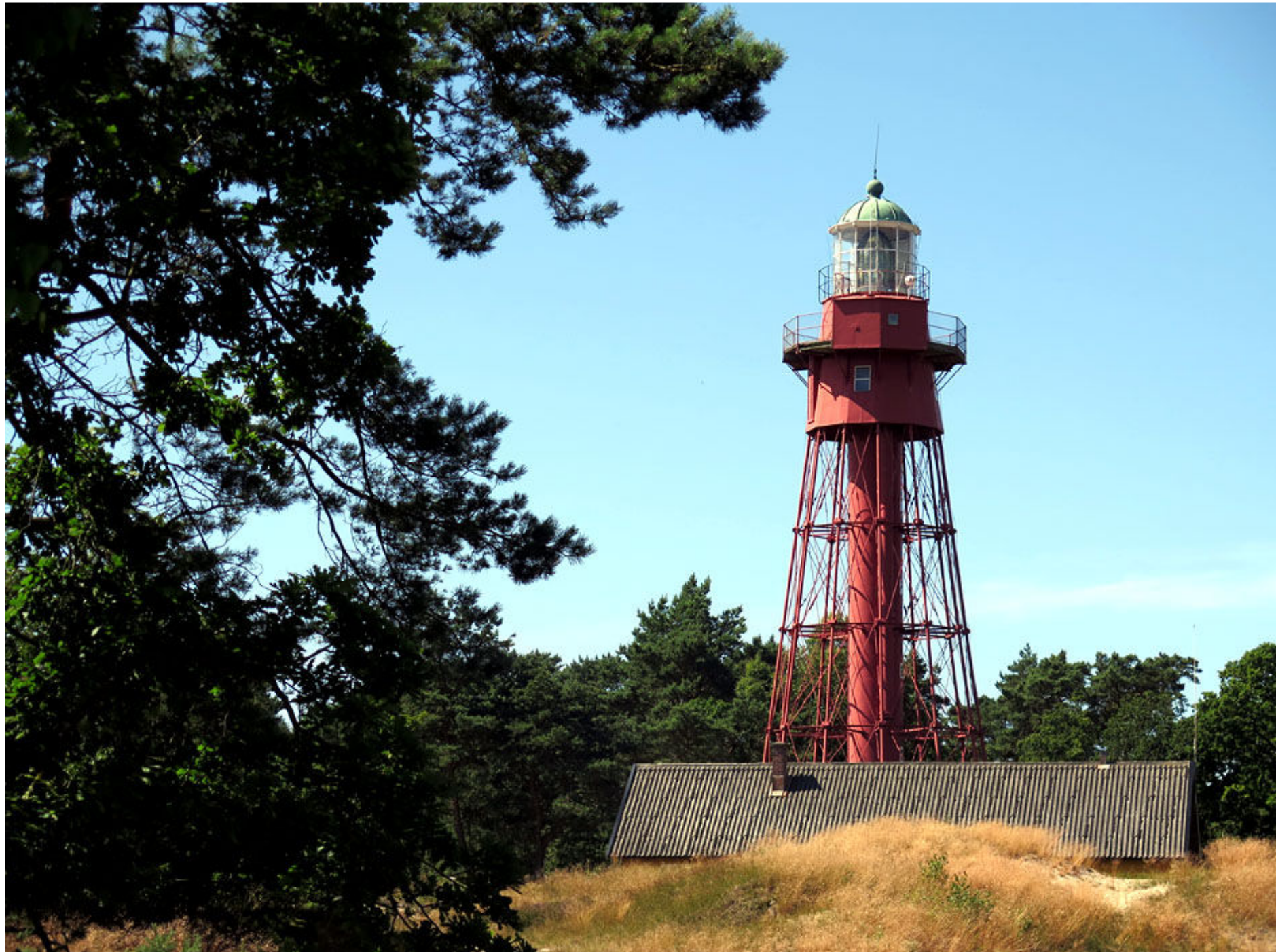
Sandhammarens fyr invigdes 1862 och används fortfarande.