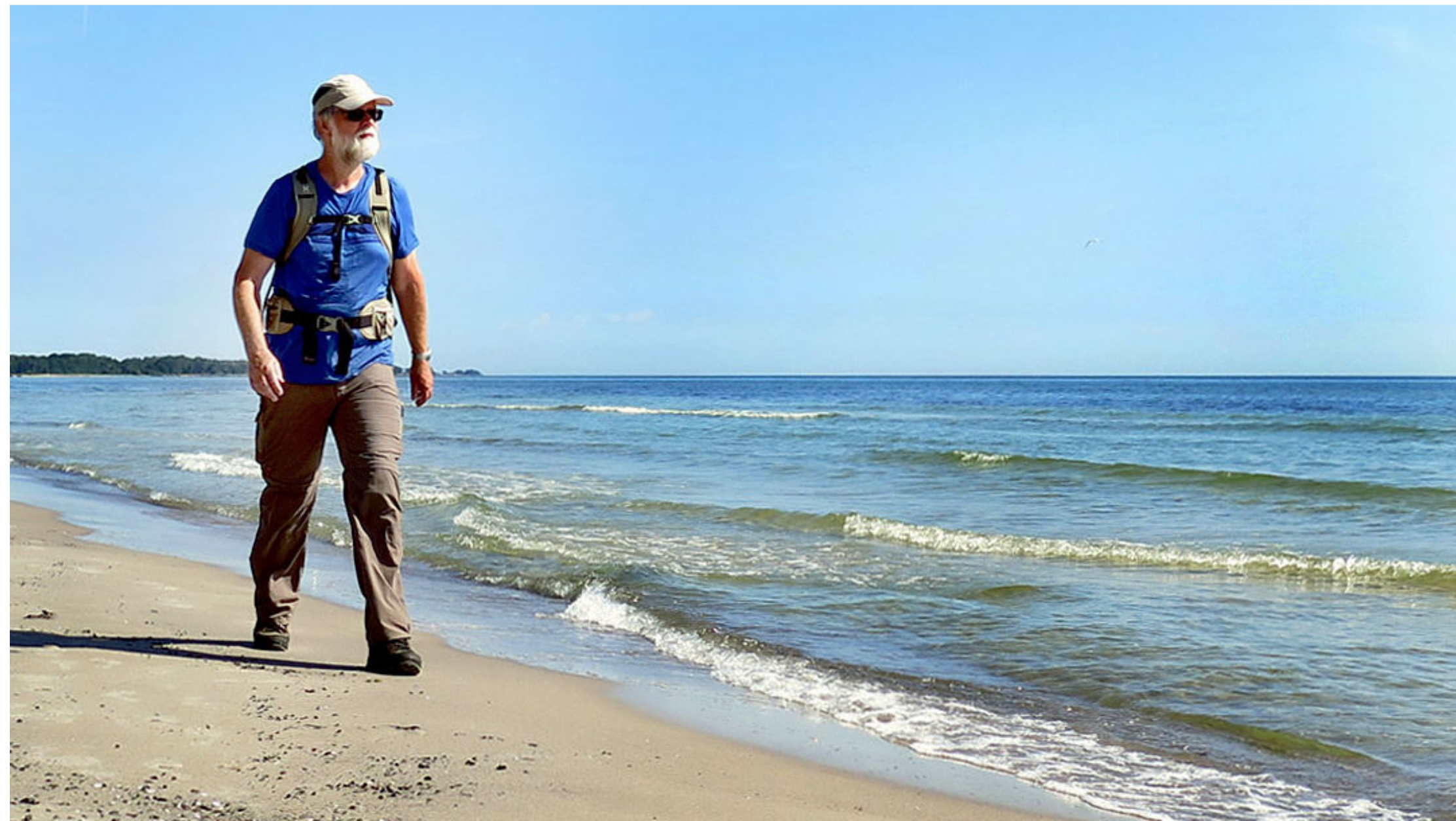
7. Efter övernattnig vid Skillinge följde en svettig vandring längs Sveriges sydöstligaste strand.