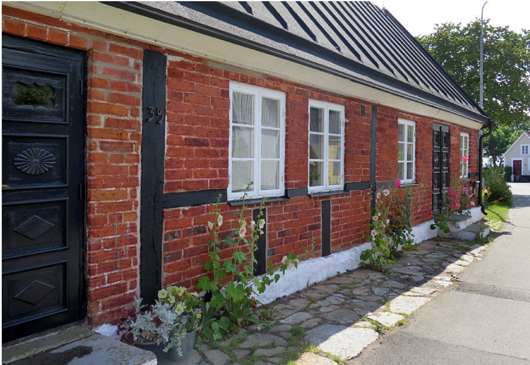
Välbevarat hus på Brantevik.