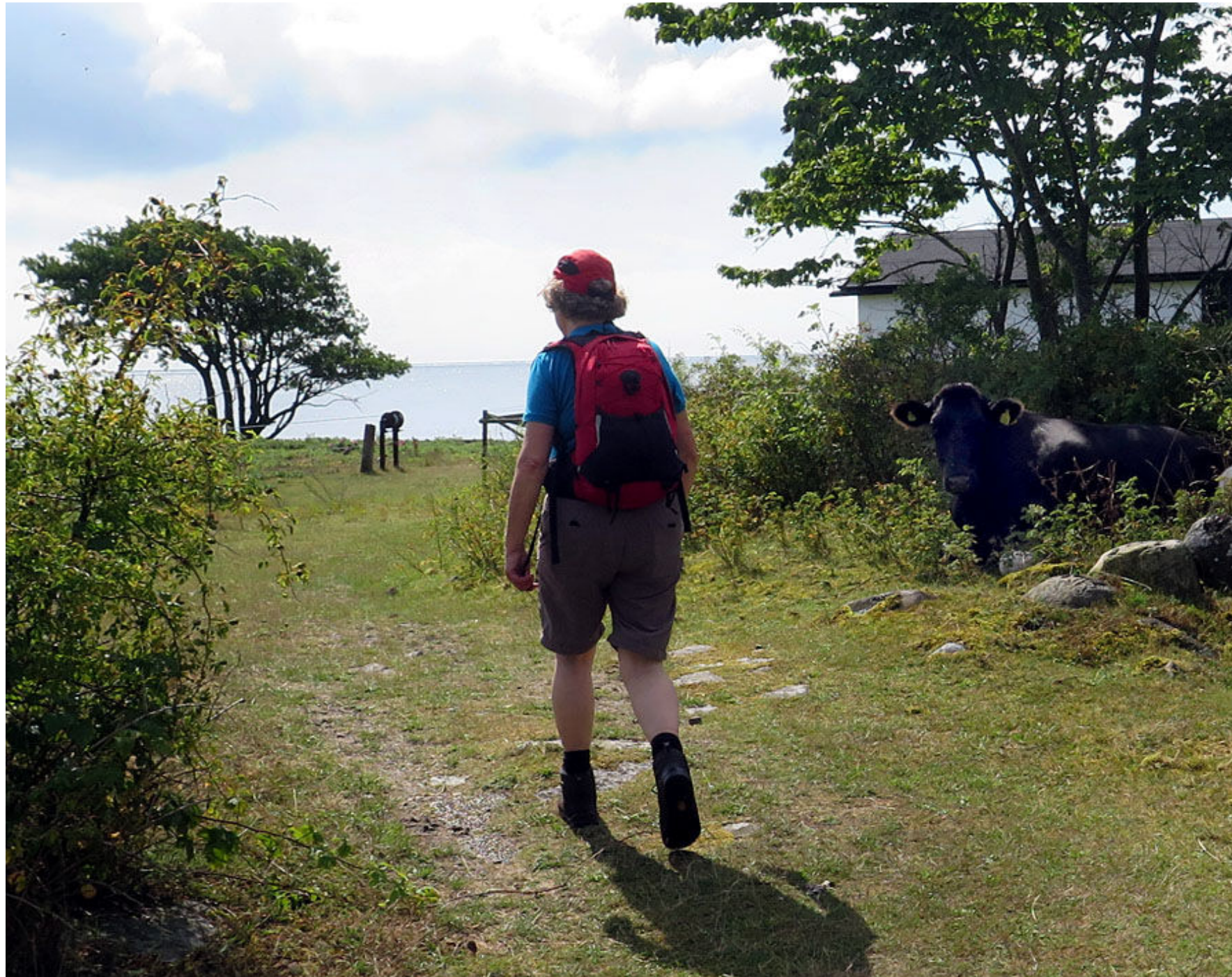
Kopassage norr om Brantevik.