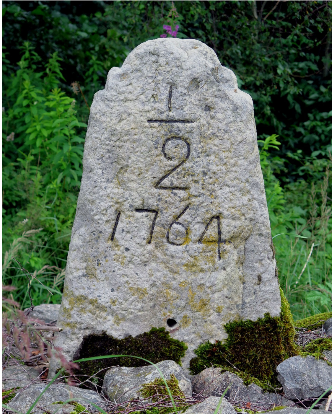
Vid gamla vägen i Lemmeshult står denna milstolpe.