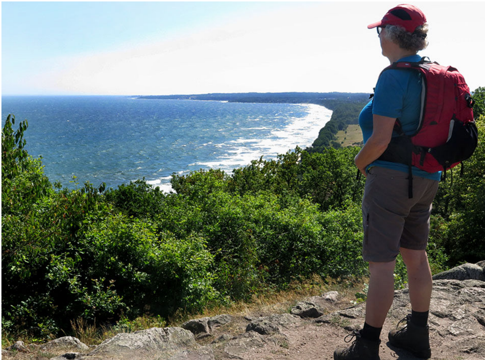
På toppen av Stenshuvud är man 97 meter över havet.