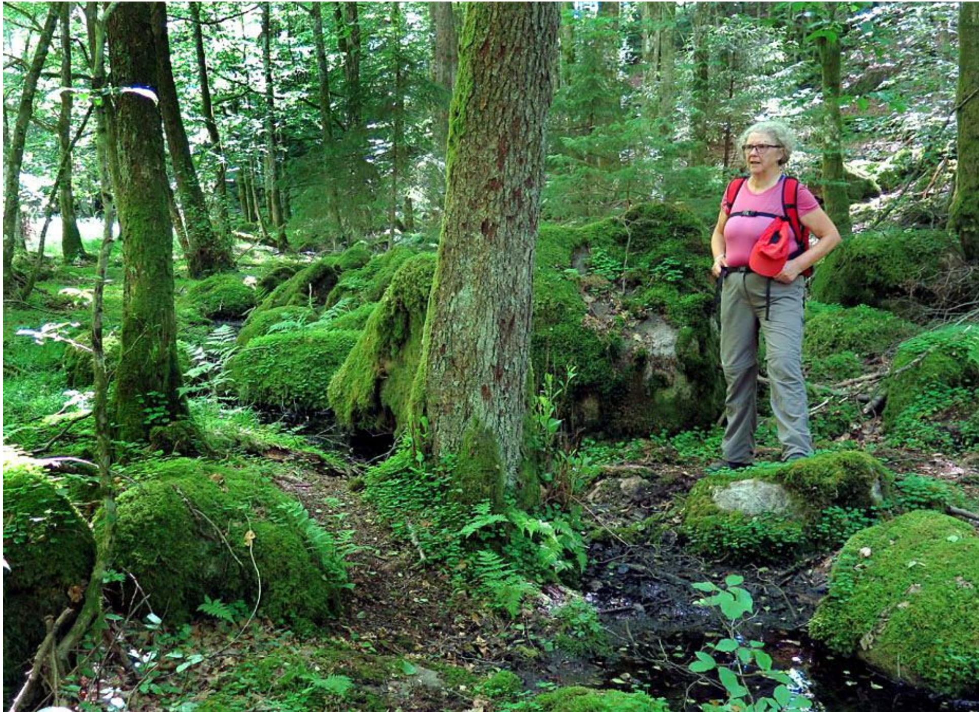
2. Norr om Finja ligger Vedema strövområde med Barsjön