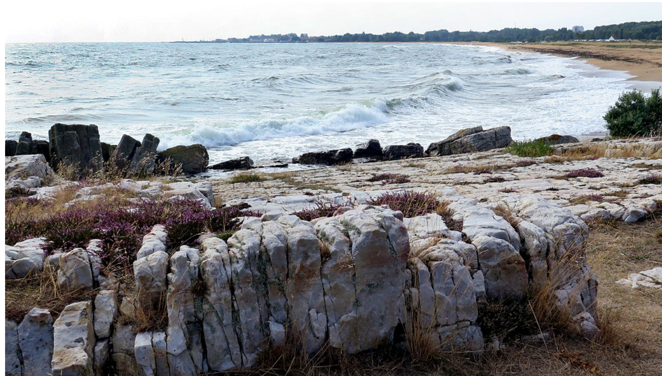
Från Vårhallarnas klippor har man inte så långt kvar till Simrishamn.