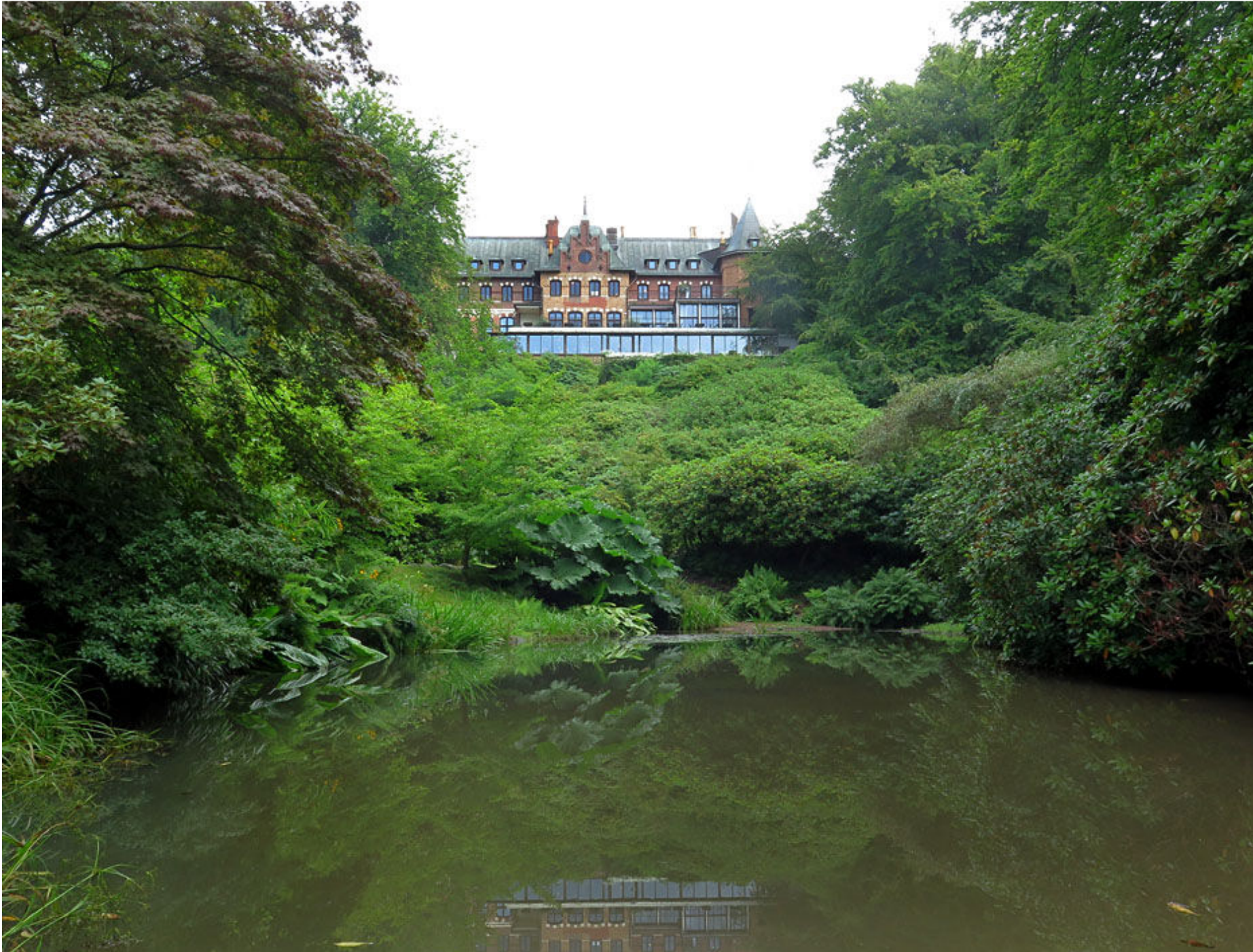
Det tidigare kungliga slottet Sofiero.