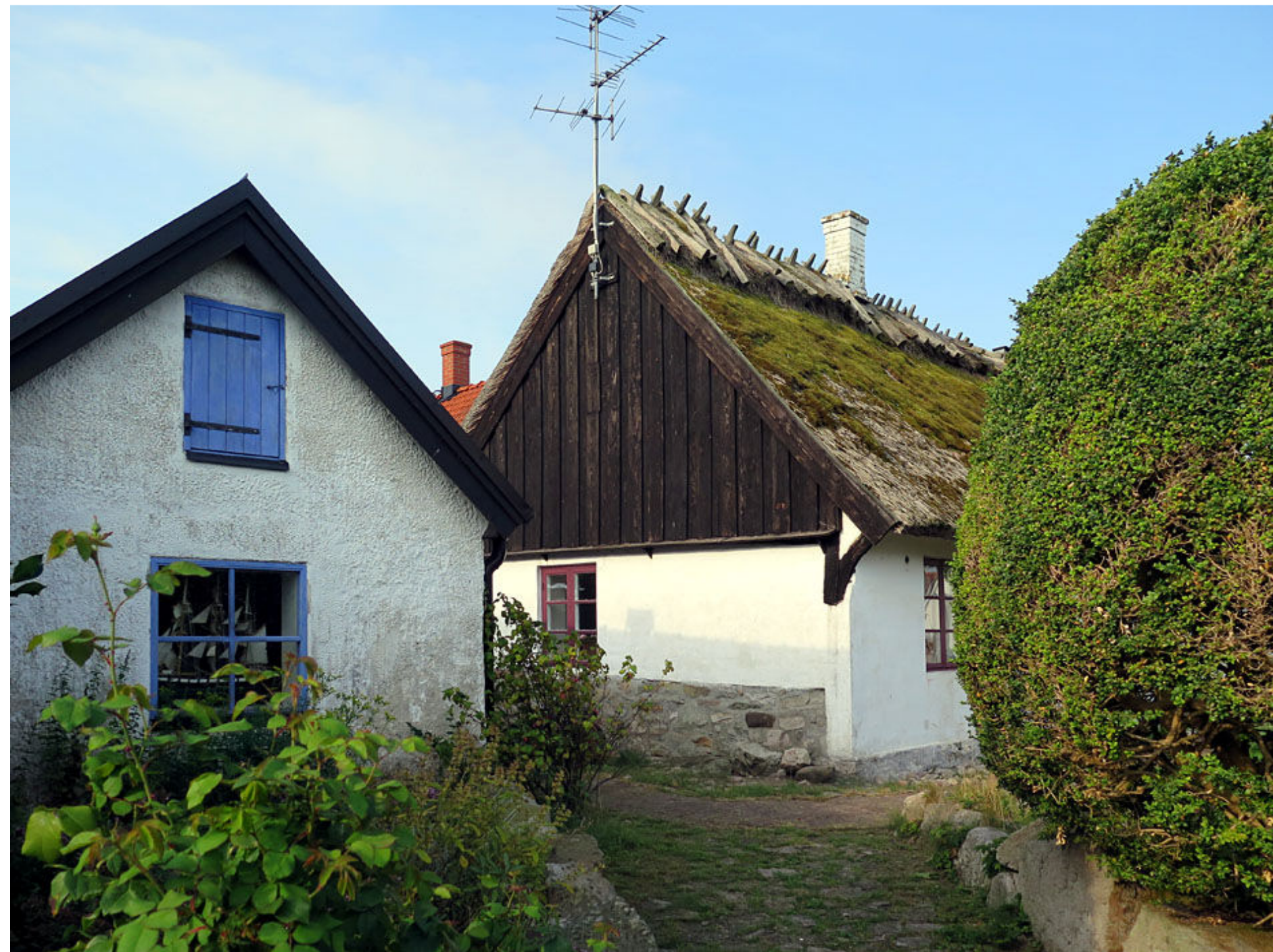
9. Fiskeläget Vik.