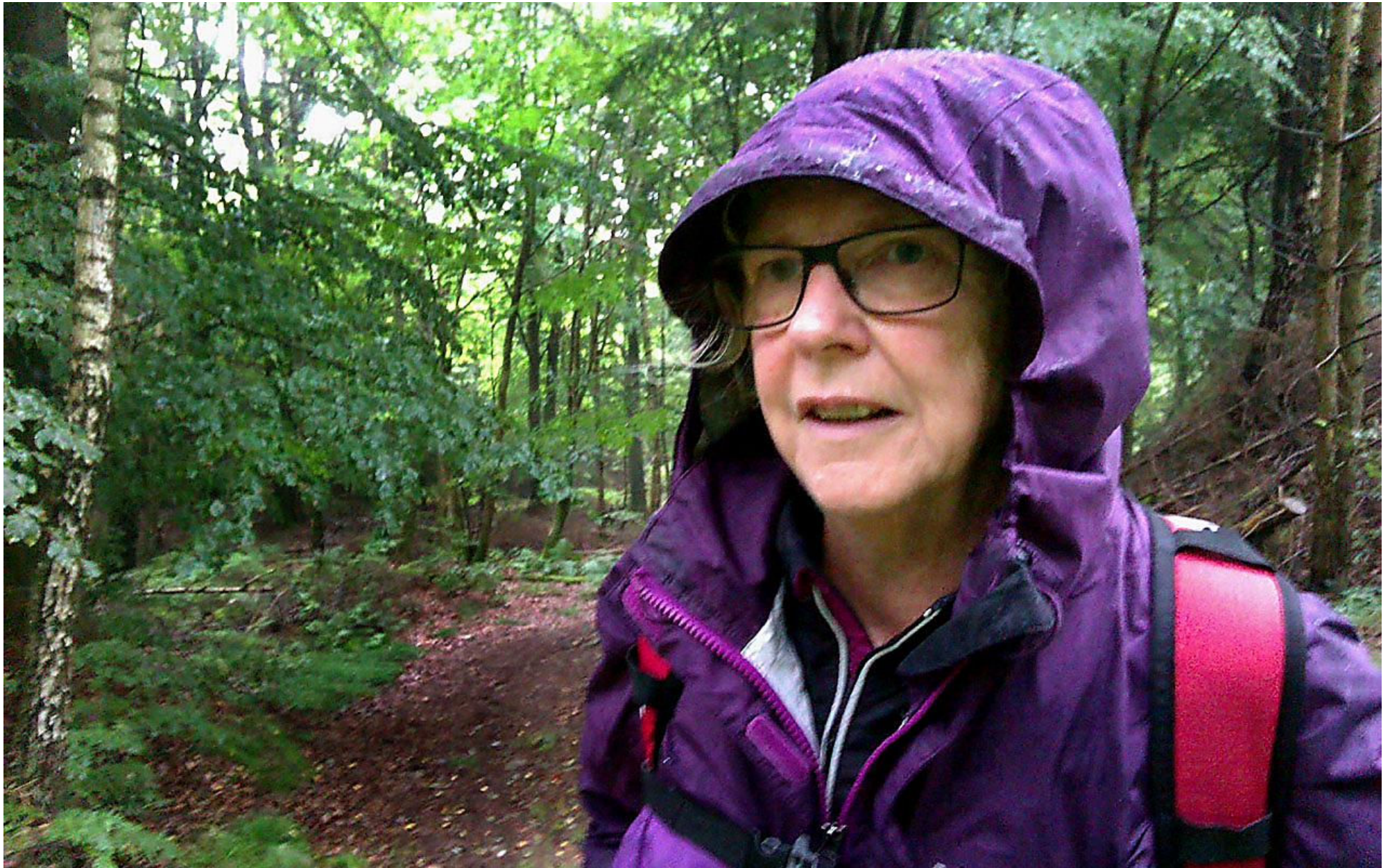
4. I början av vandringen från Åsljunga fick vi användning för medhavda regnkläder.