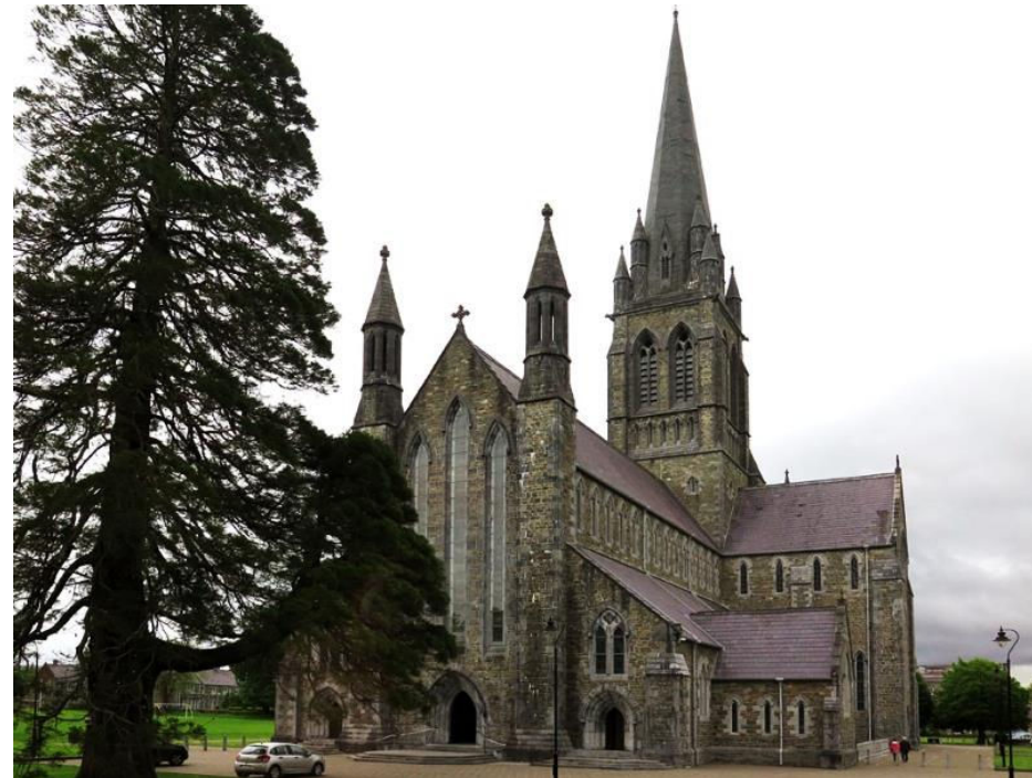
I Killarney var det bröllop på gång. Sannolikt hölls det i Saint Mary's Cathedral.