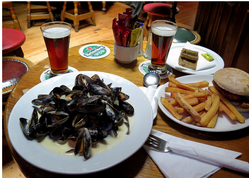
Utöver välkända O'Donoghue's på Merrion Street finns en pub med samma namn på Suffolk Street, där vi intog en utmärkt lunch med musslor respektive cajunkycklingburgare. Och Smithwick's ale.