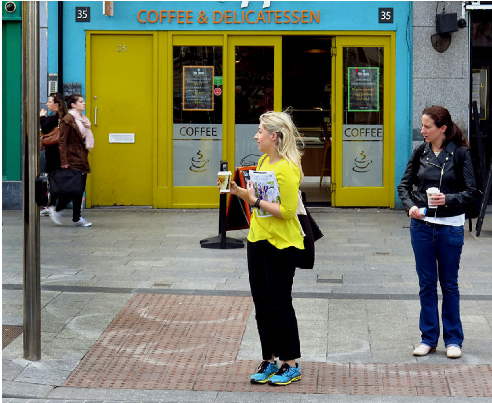
Medan andra är på väg till jobbet ser vi turister oss omkring i Dublin.