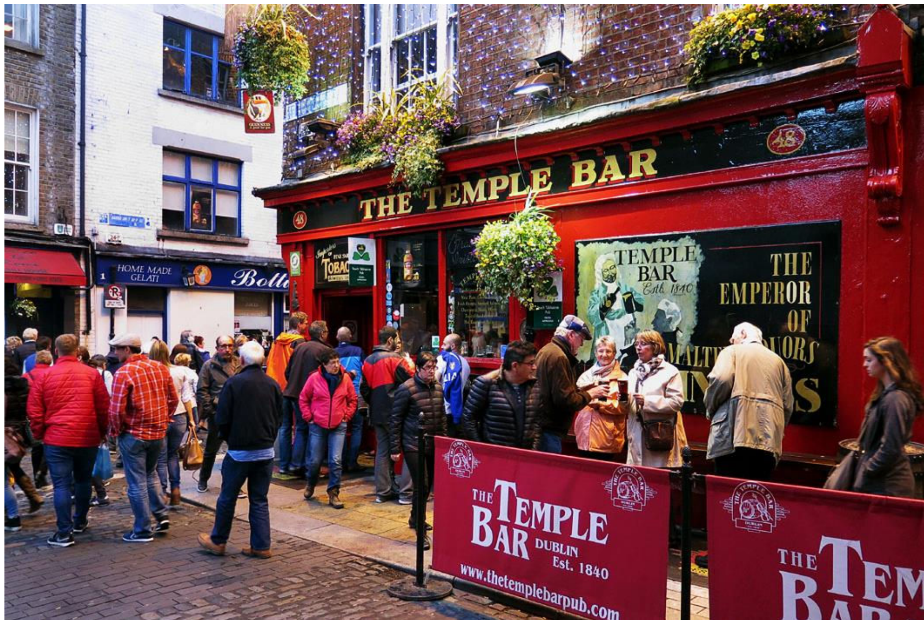
Gatorna i Temple bar-området söder om floden Liffey kantas av ateljéer, antikvariat, restauranger och pubar. En av de senare har för övrigt just namnet The Temple Bar.