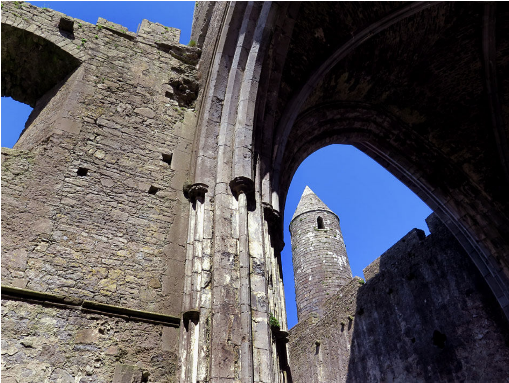
Det runda tornet är platsens äldsta byggnad, uppförd omkring år 1100.