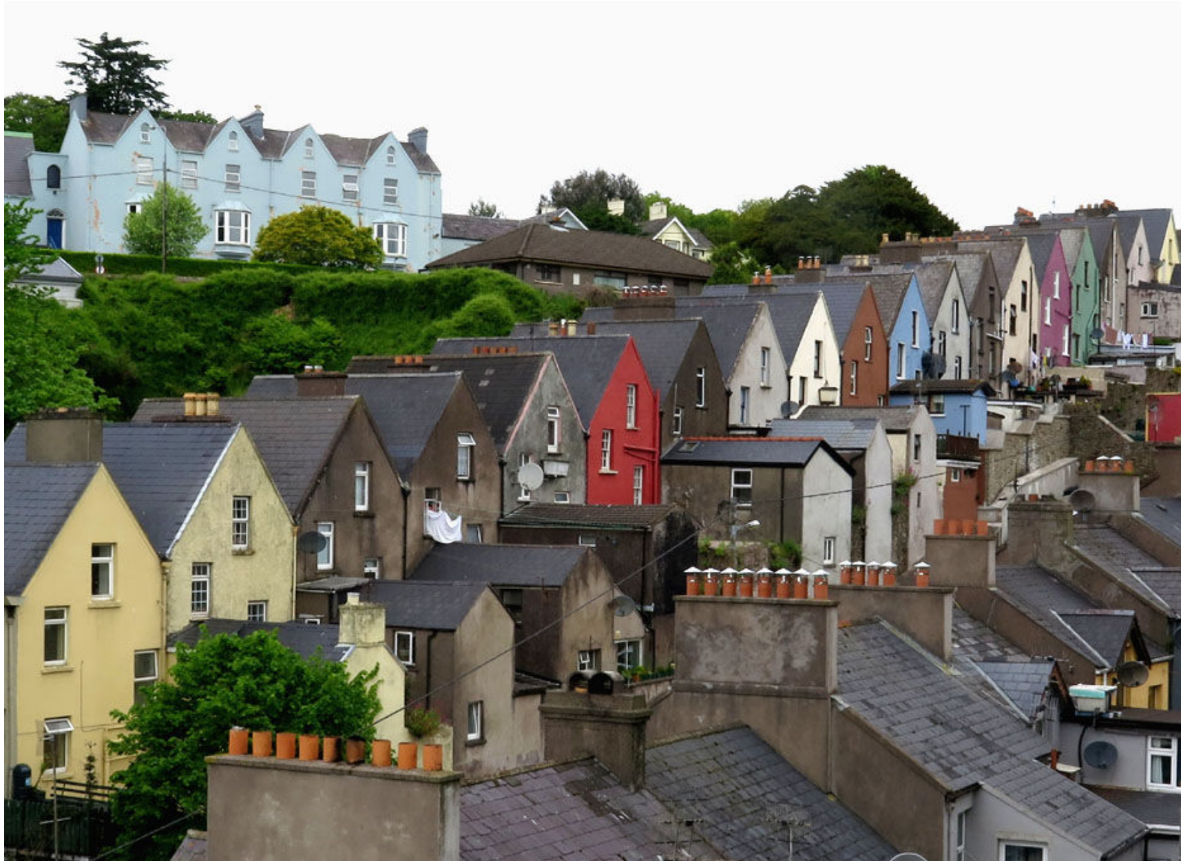
De gamla hamnarbetarbostäderna har fått färgglada fasader.