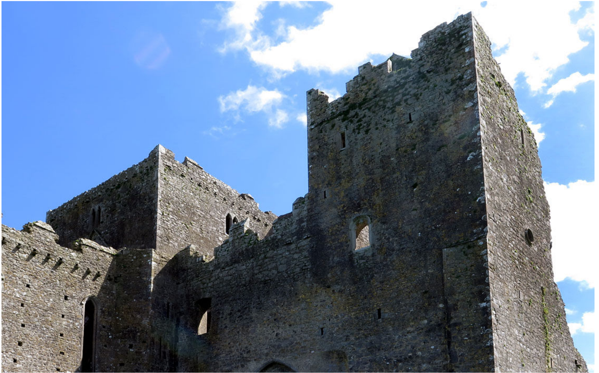
I Cashel finns Saint Patrick's Rock med resterna av en borg med katedral.