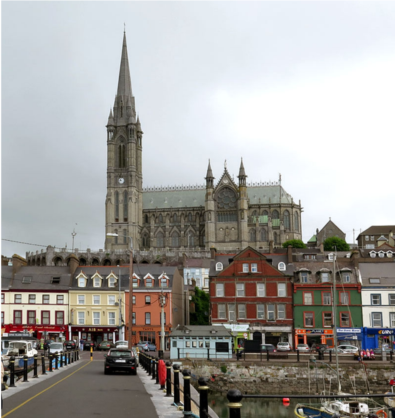
I Cobh (som kallades Queenstown åren 1849-1922) har Cathedral of Saint Colman en upphöjd position.