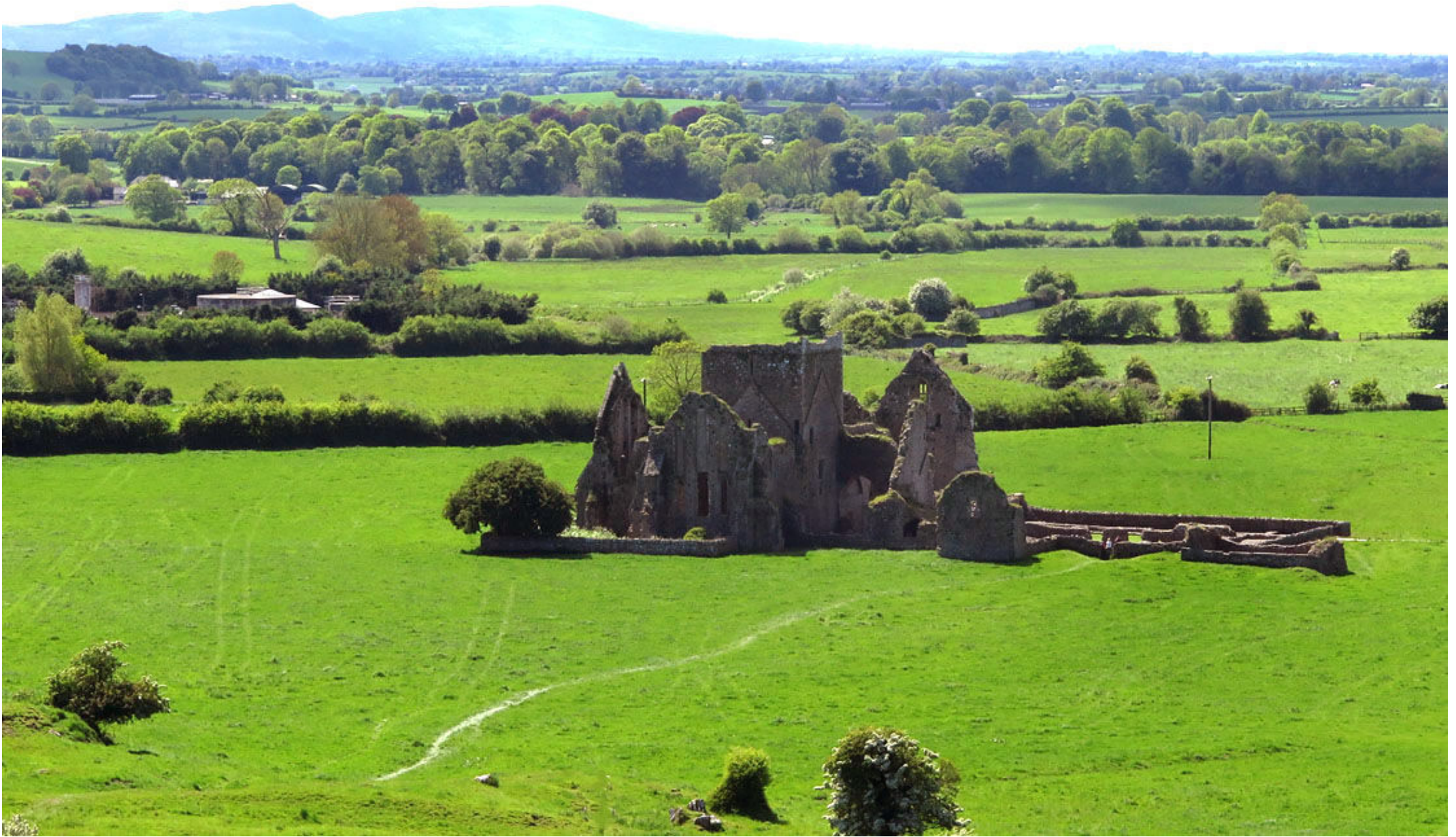
Från Sankt Patriksklippan har man fin utsikt över området inklusive ruinerna av Hore Abbey.