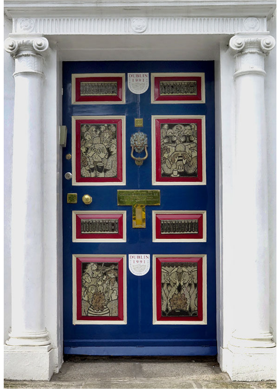
Längs Merrion Square South finns georgianska hus med påkostade portar.