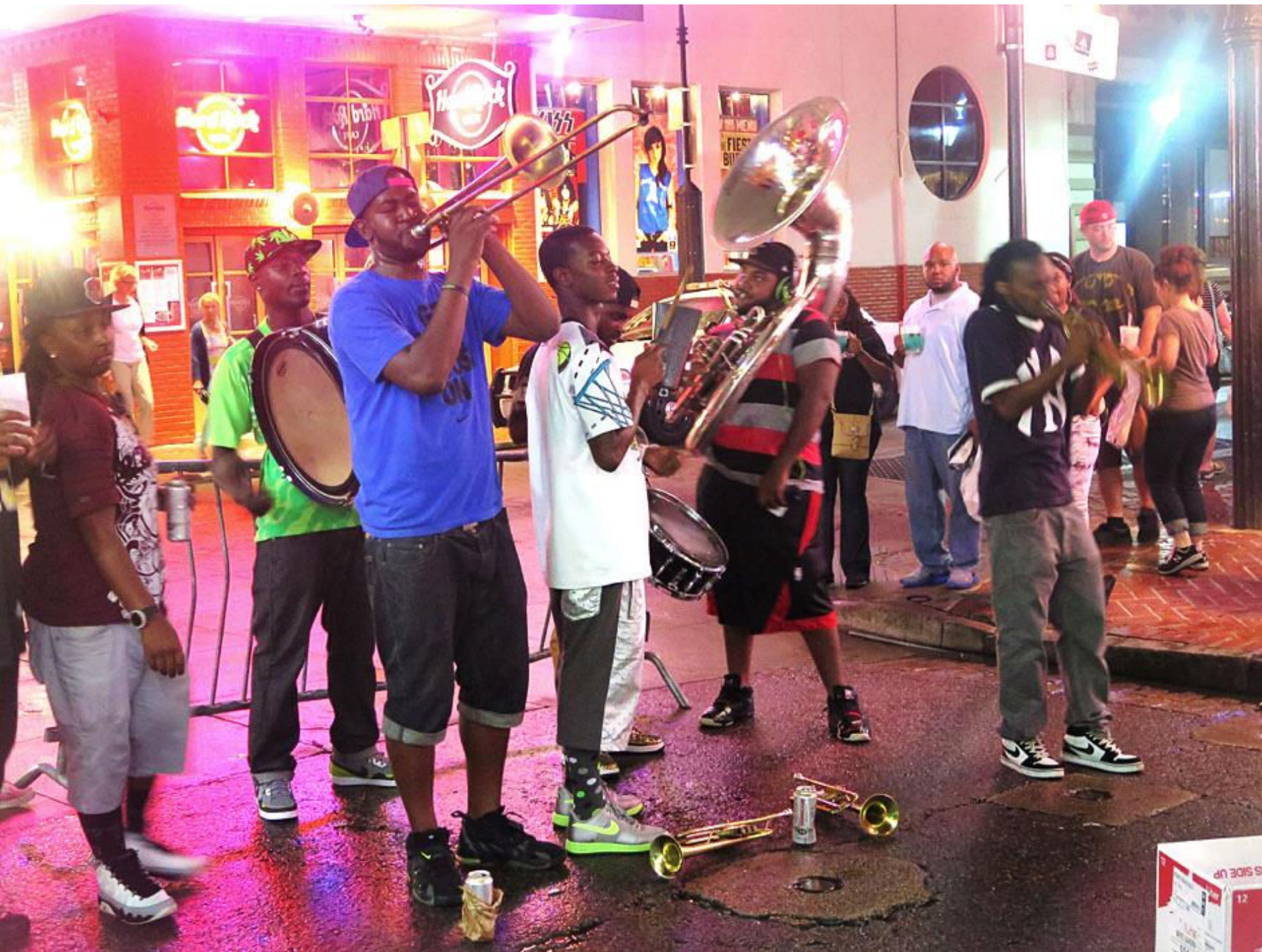
Brassband- traditionen lever vidare i New Orleans.