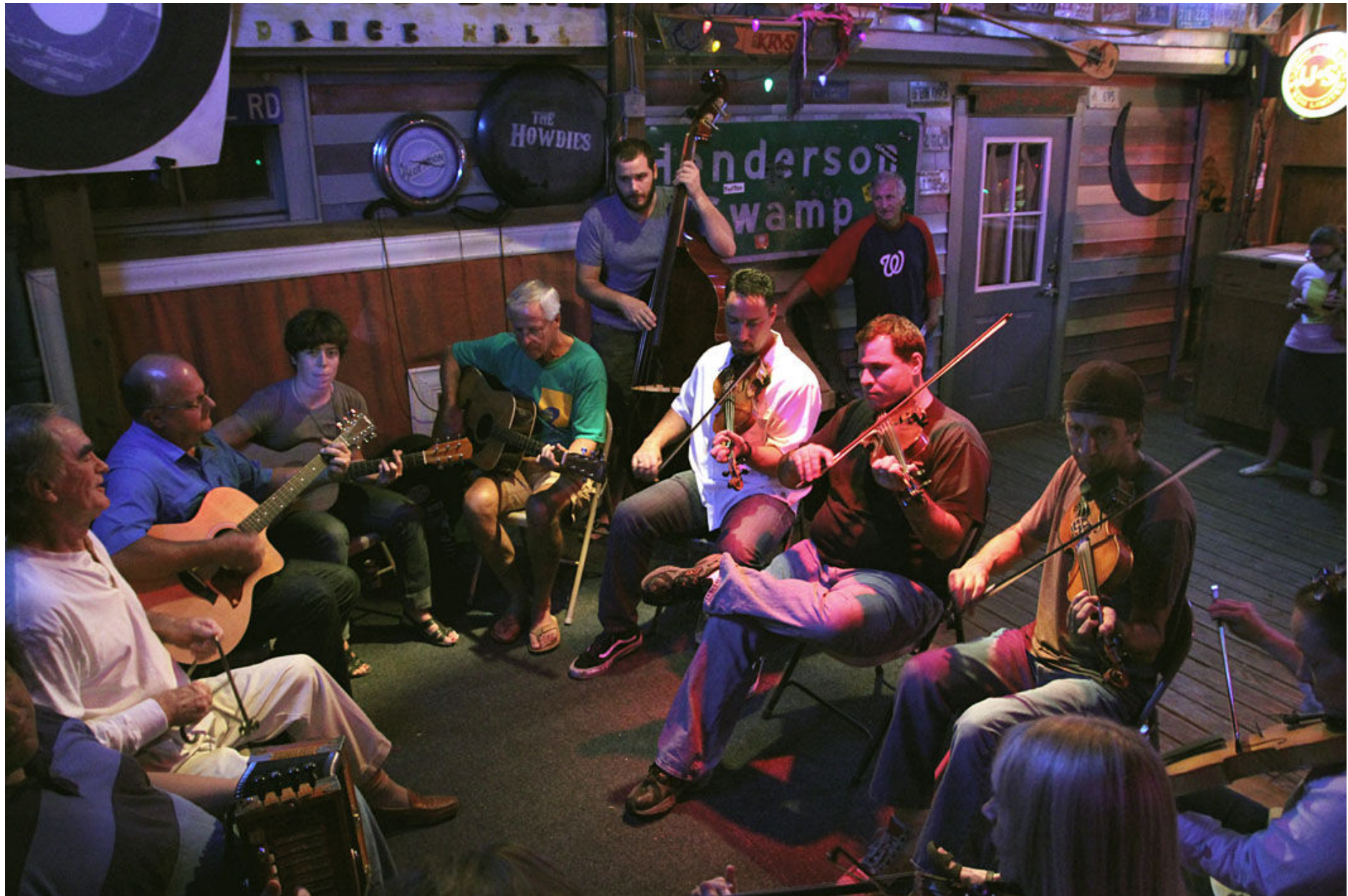
På Blue Moon Saloon i Lafayette samlas varje onsdag åtskilliga av områdets främsta cajunmusiker till jam.