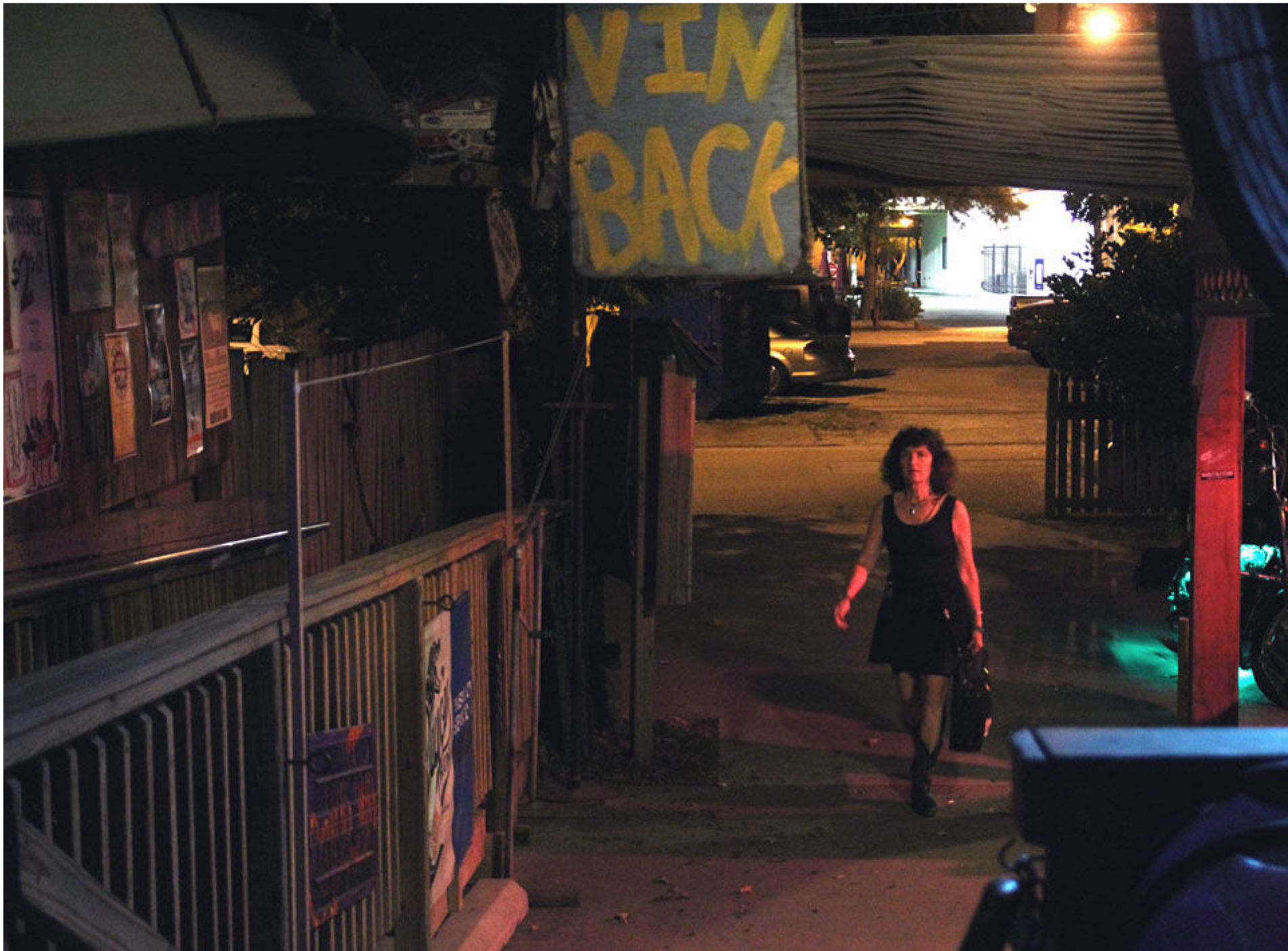
Ytterligare en spelsugen på väg in.