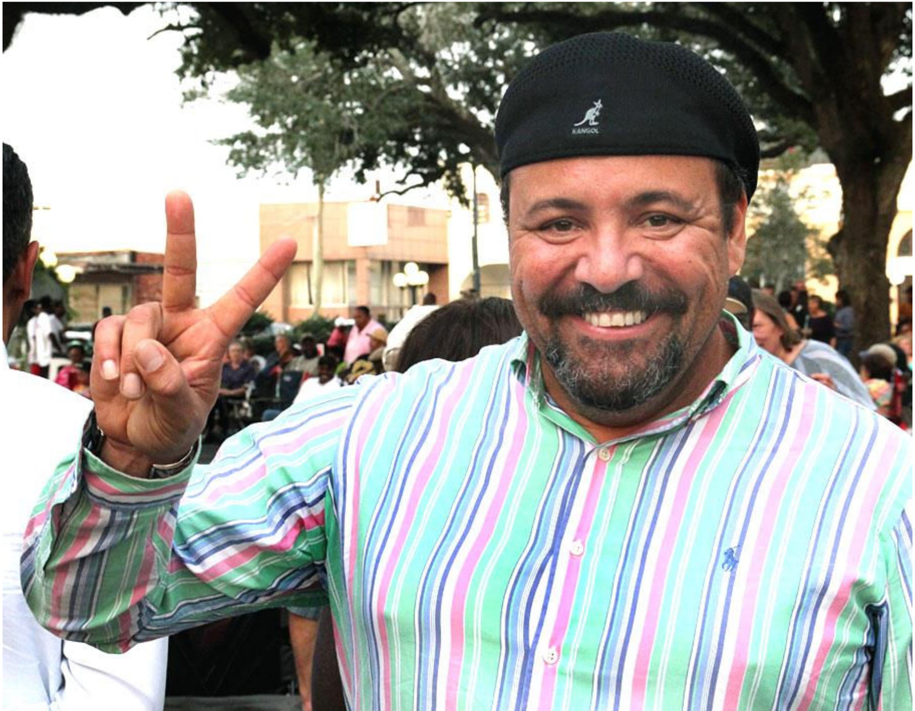
Tvåfaldige Grammy- vinnaren Terrence Simien finns med bland åskådarna.