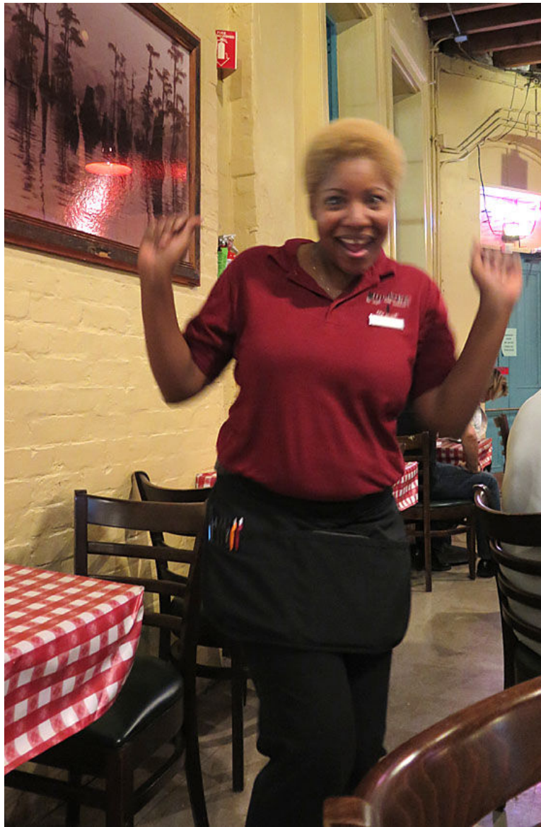
Även servitrisen vill dansa.