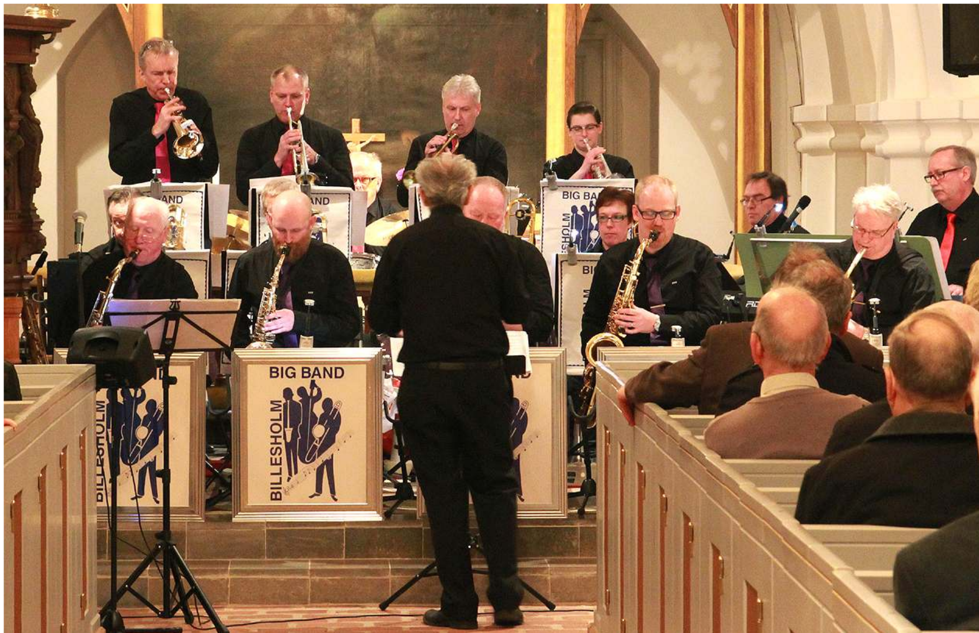
Annan miljö, men svängigt ändå: Billesholm Big Band spelade i Norra Vrams kyrka den 11 mars.