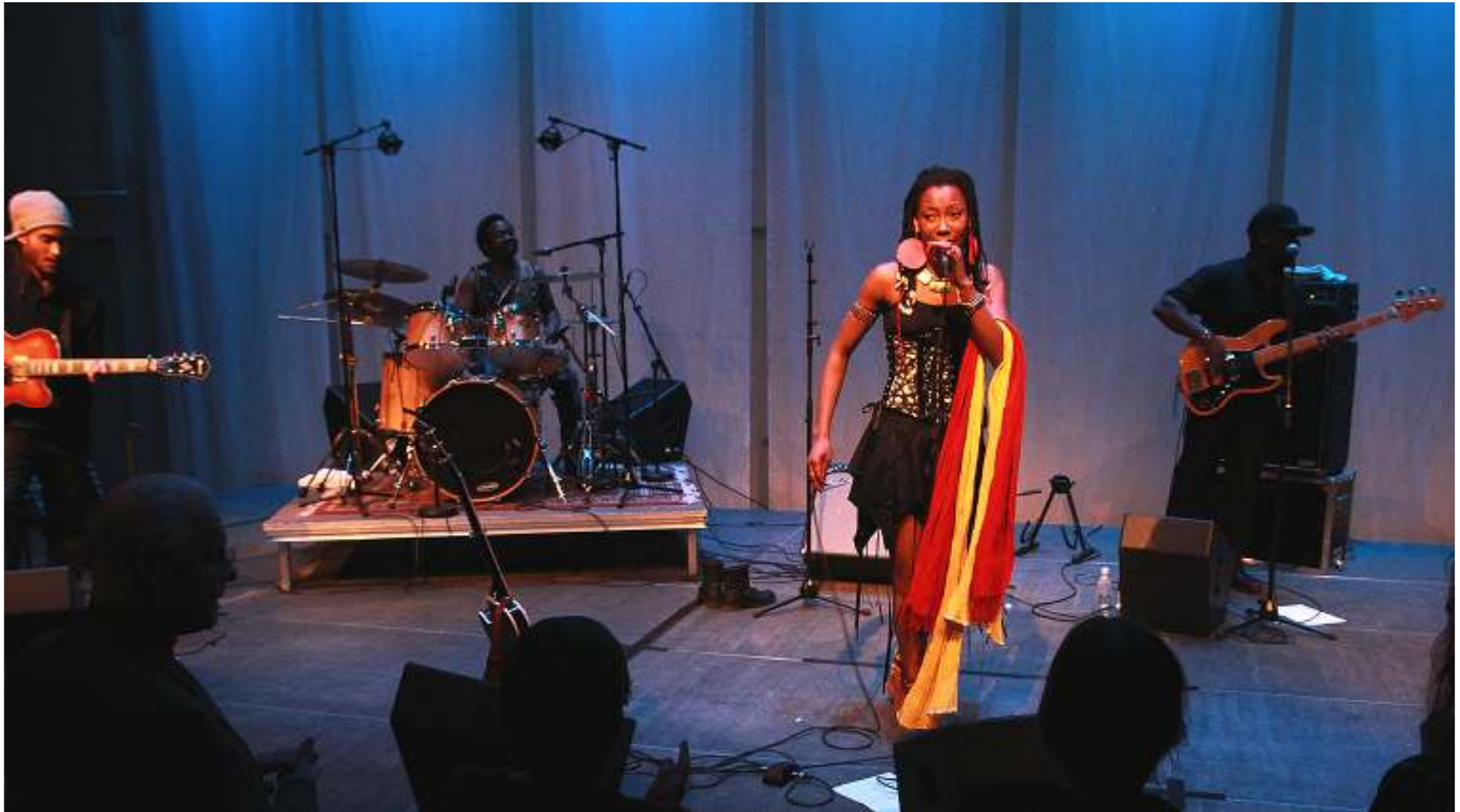
Mali-födda Fatoumata Diawara bjöd på en medryckande och färgstark rytmfest när hon gästade Dunkers i Helsingborg den 9 februari.