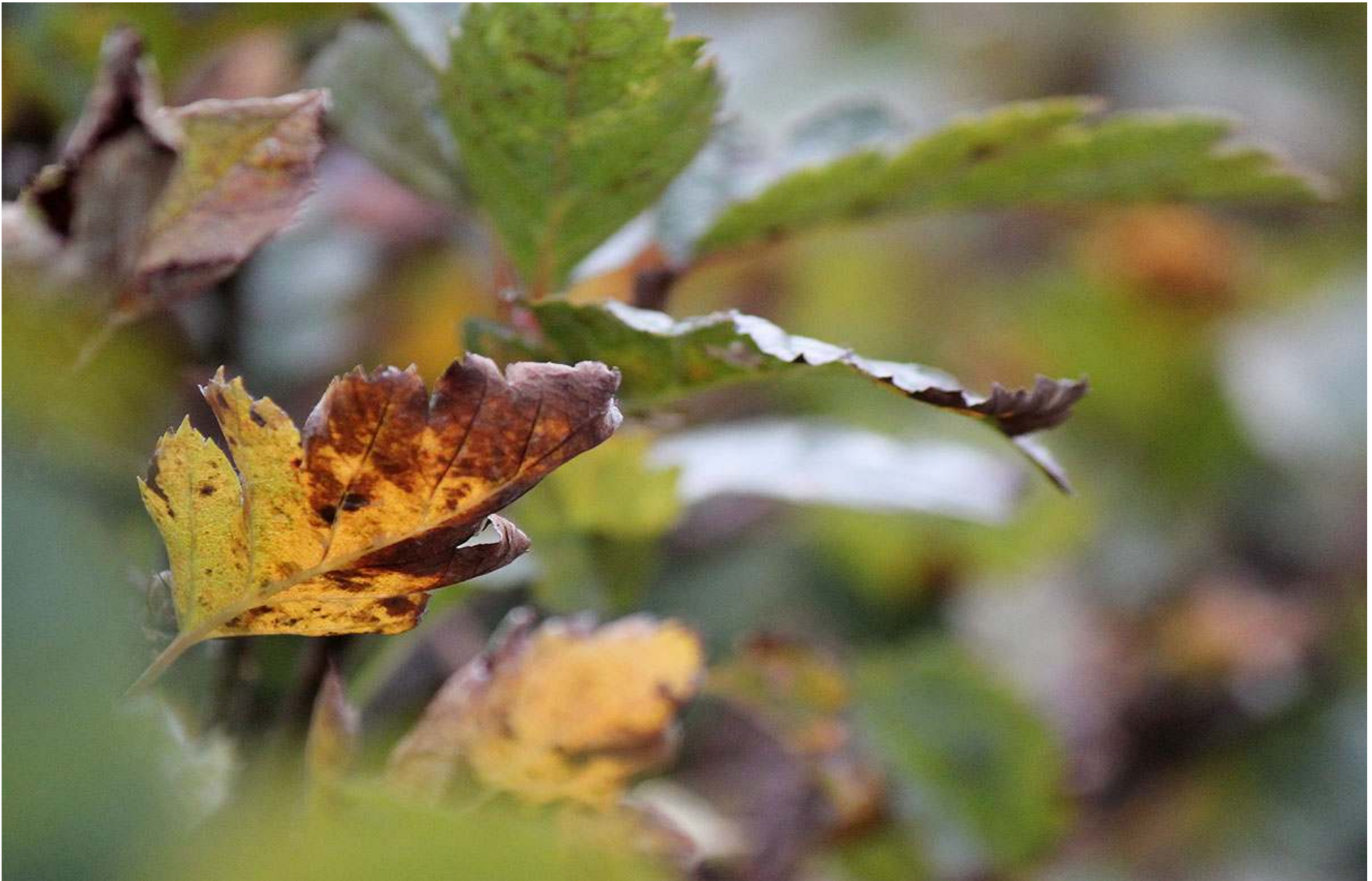
Bladen i oxelhäcken skiftar färg...