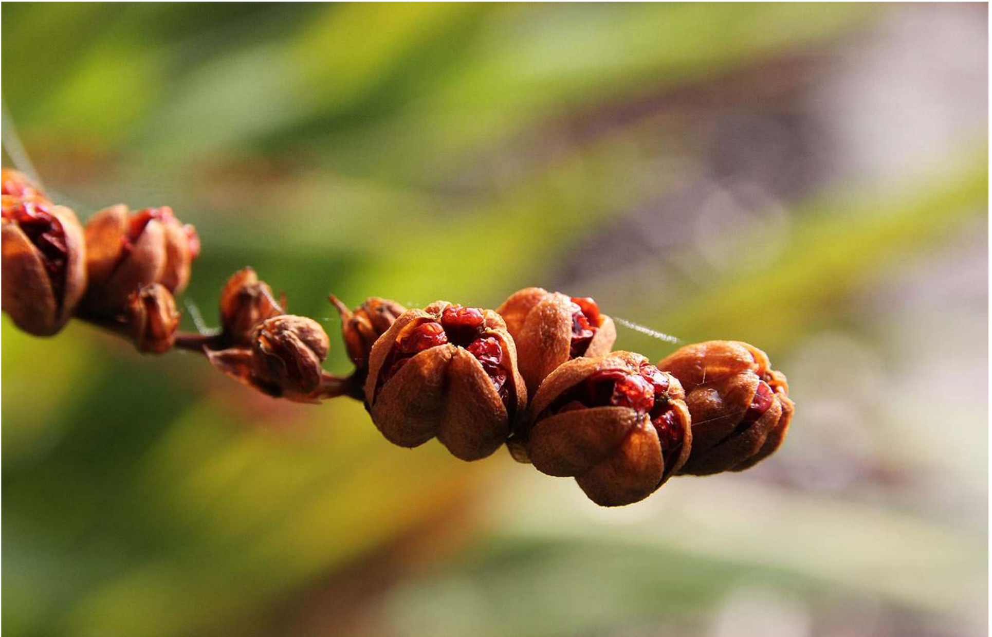
Montbretia ( Crocosmia Lucifer ) sprider snart sina frön.