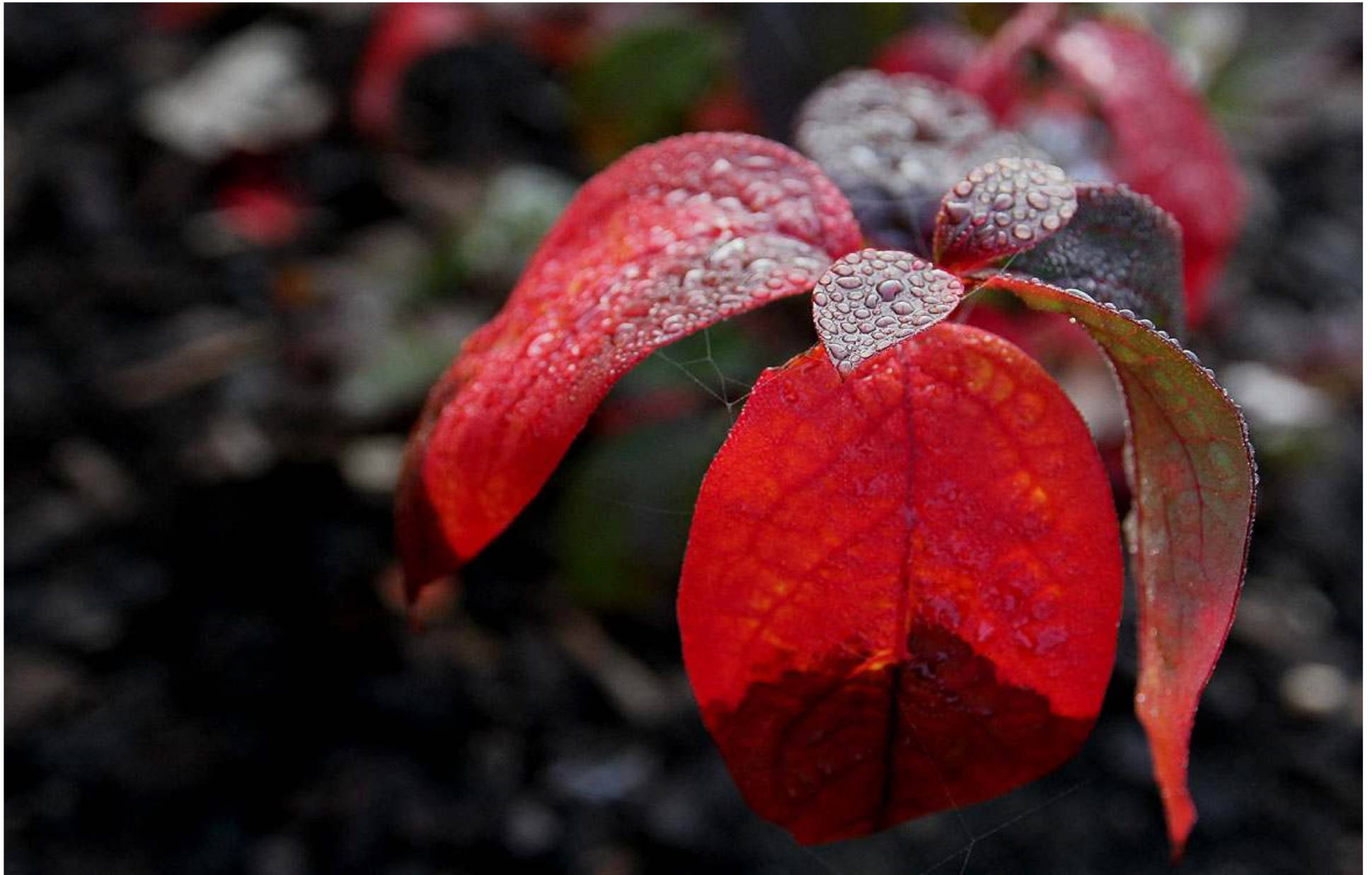
Amerikanska blåbärens blad har fått fin höstfärg.