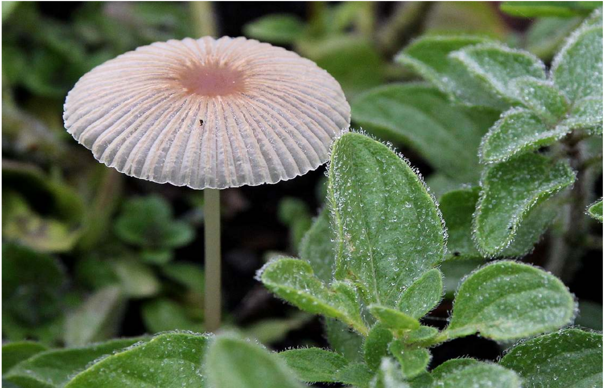
Disigt fuktiga morgnar har satt fart på en självsådd svamp mitt bland den grekiska oreganon.