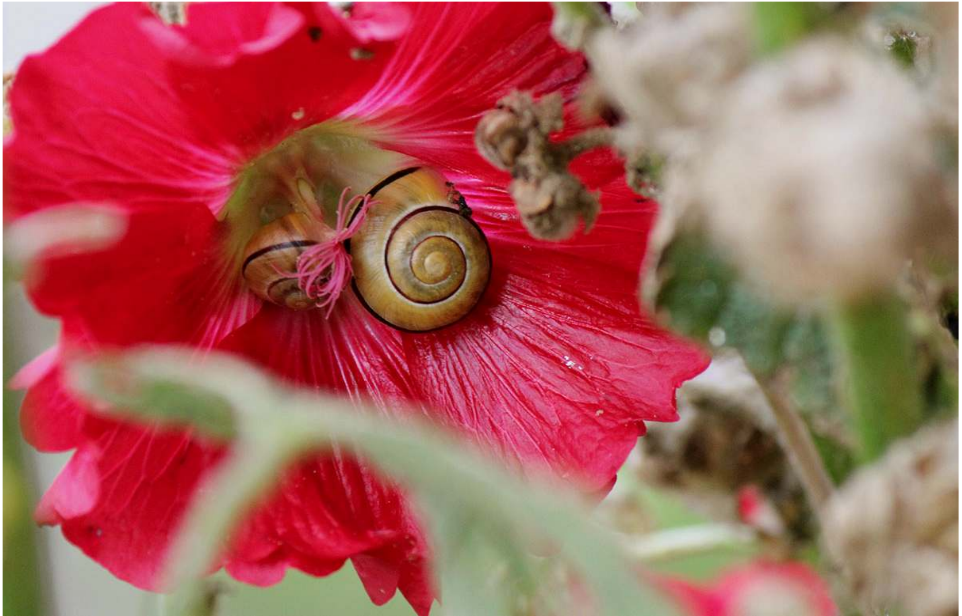
Fortfarande blommar en del stockrosor, något som vissa djur uppskattar.