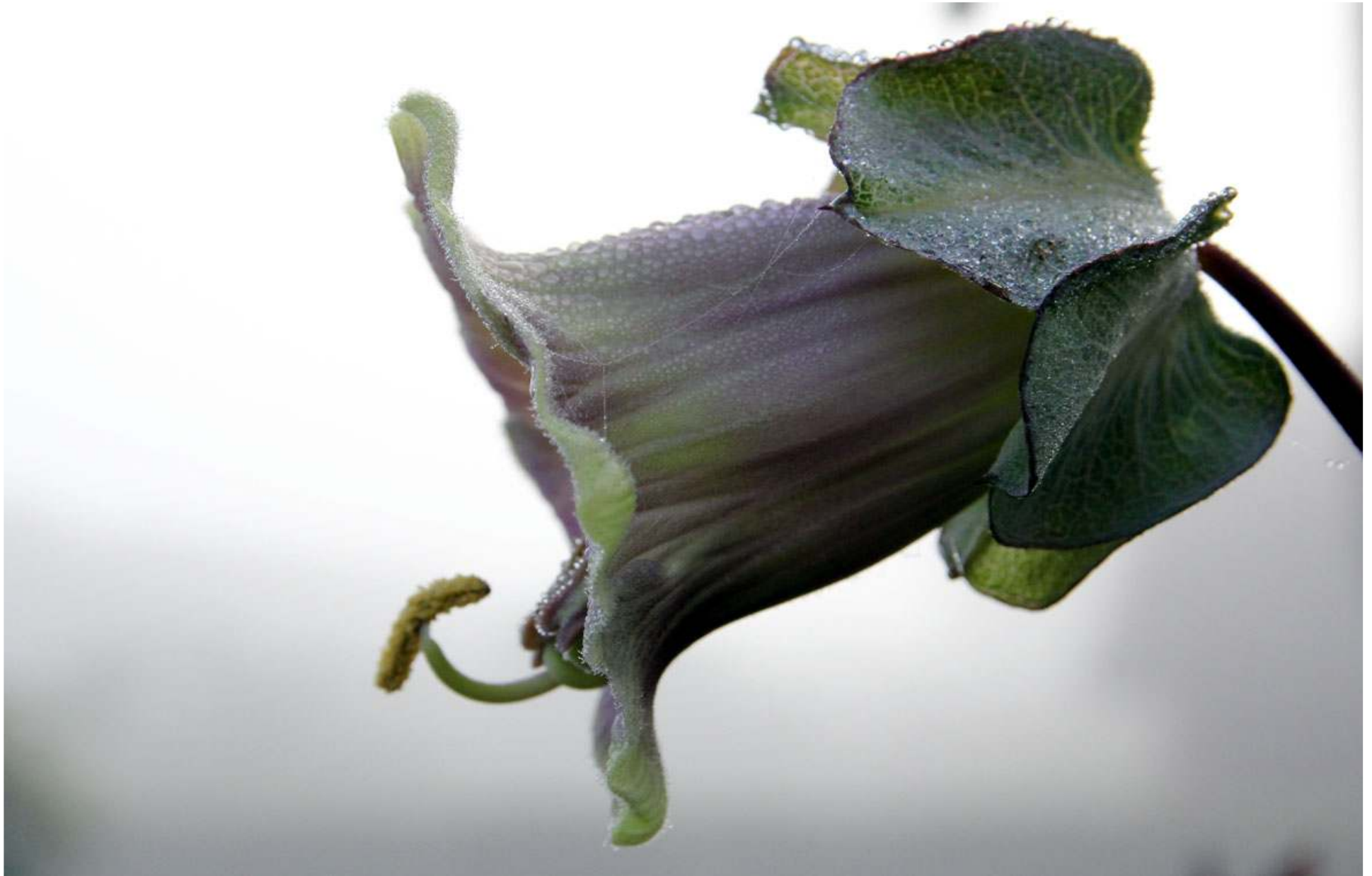
Klockranka i morgondis.