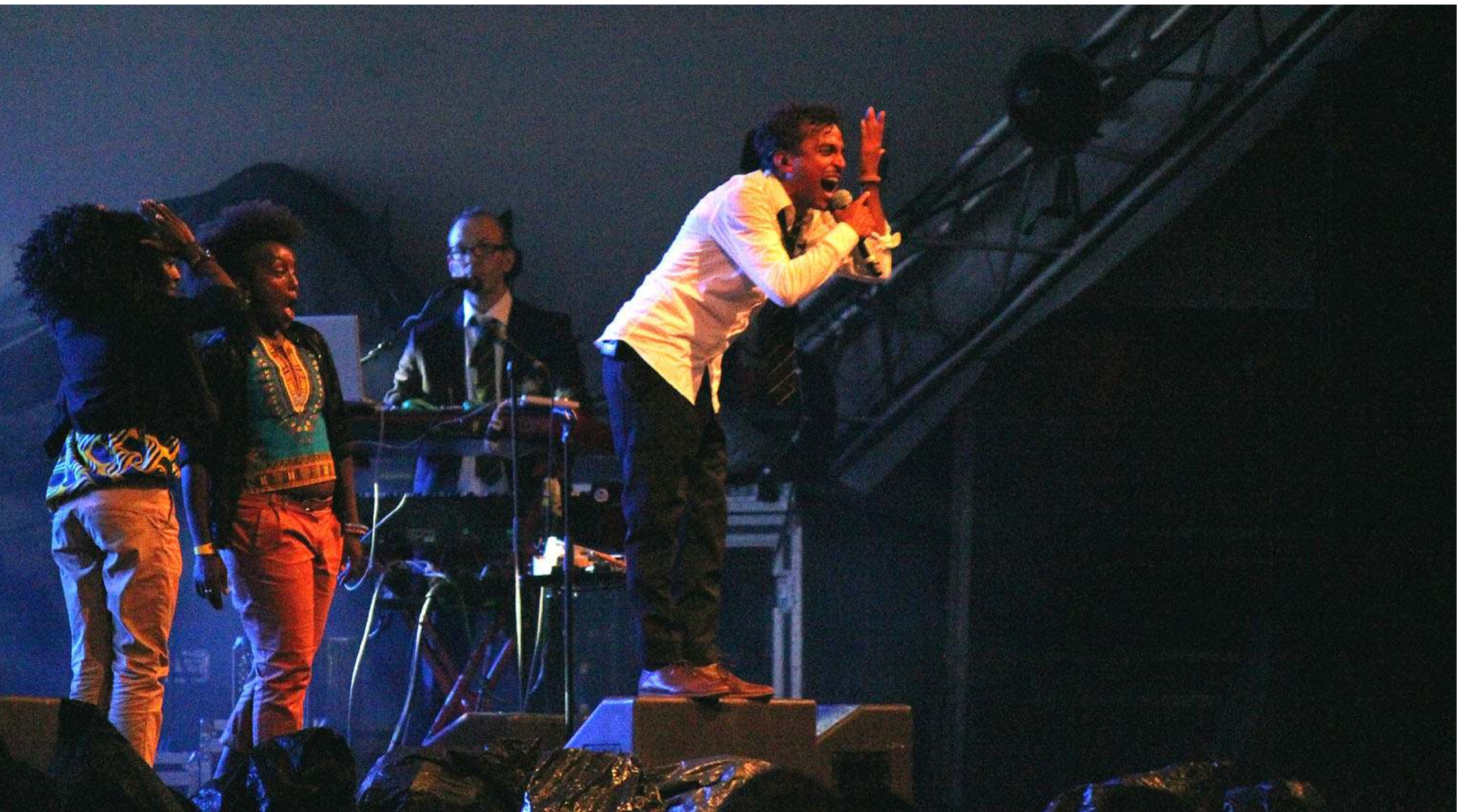
Från Swingtältet tog vi oss till Stora scenen, där Timbuktu & Damn! gav järnet inför ett fullpackat Stortorget.