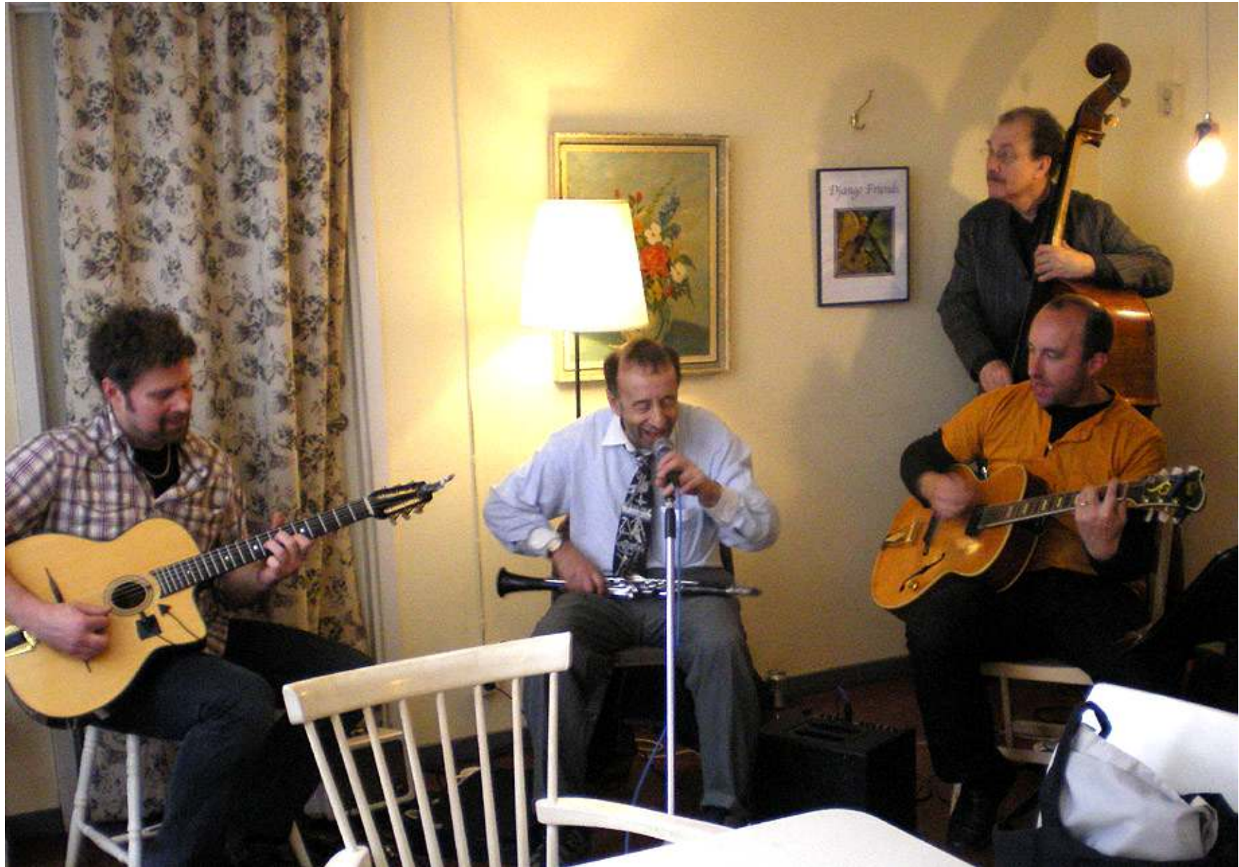
Musik hör till en stockholmsresa, här i form av swing med Django Friends på Vete-katten.