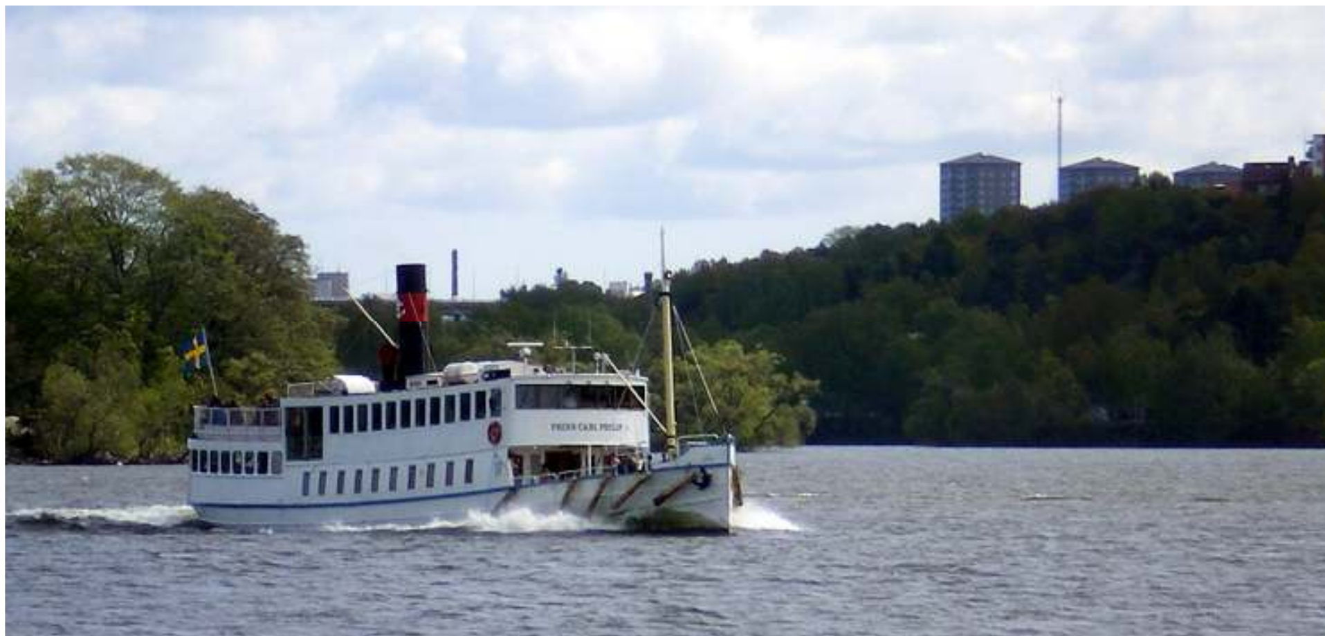
På vägen hem möter vi M/S Prins Carl Philip.