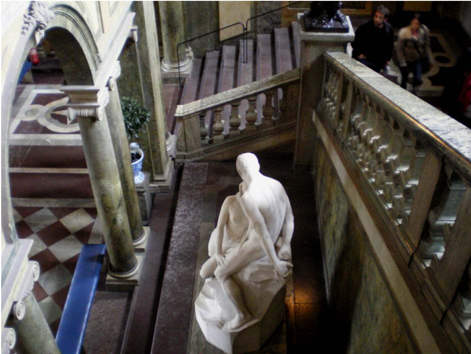
Under dagarna i Stockholm passade vi också på att titta närmare på insidan av Kungliga slottet. Det blev lite motion i trapporna.