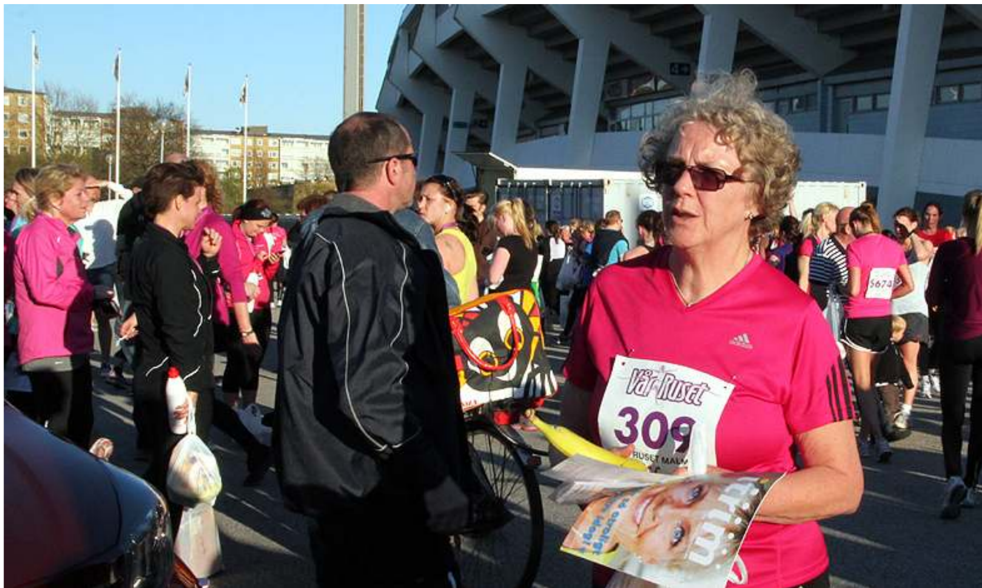
Ingemo pustar ut efter 5 kilometers springande under den varmaste dagen i loppets 24-åriga historia.