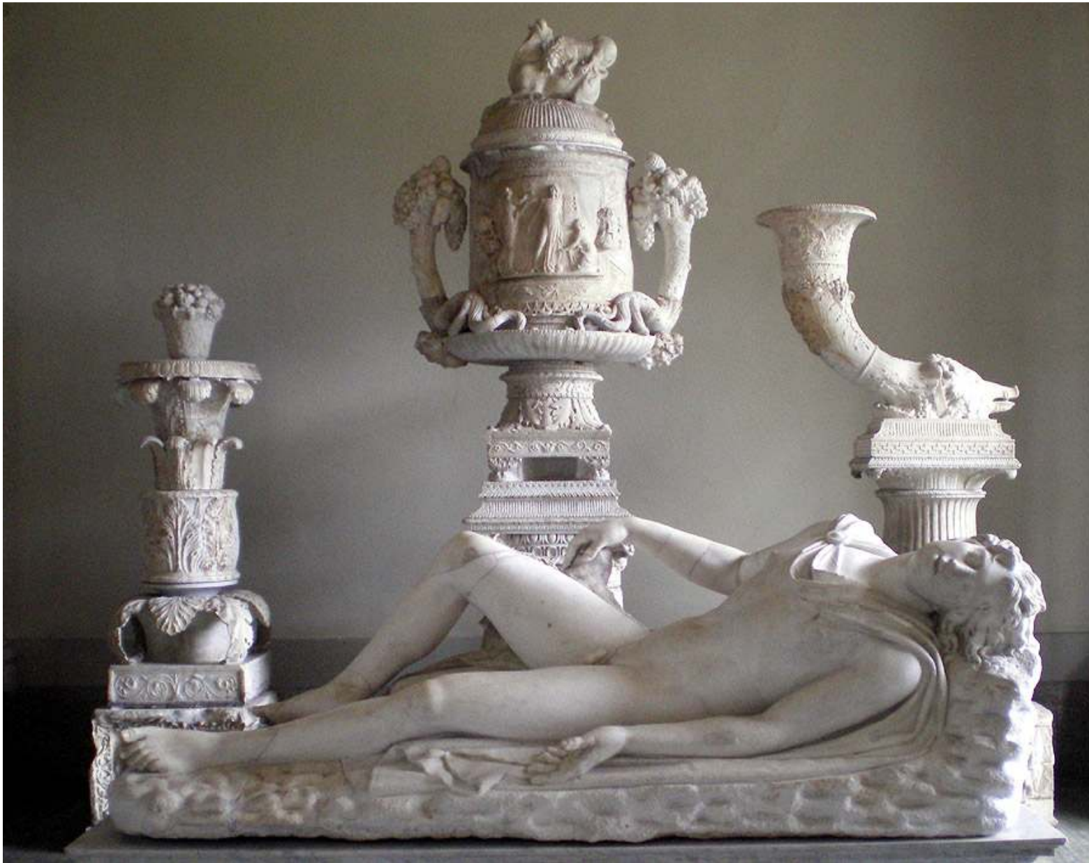
I Gustav III:s antikmuseum kan denna Endymion-staty beskådas. Statyn hittades 1738 och är eventuellt från romarrikets dagar.