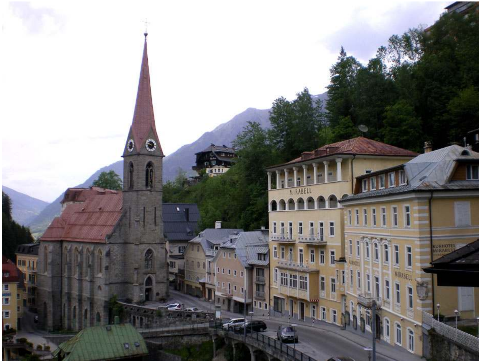
Hotellen sätter sin prägel på kurorten Bad Gastein, men här finns även en och annan kyrka.