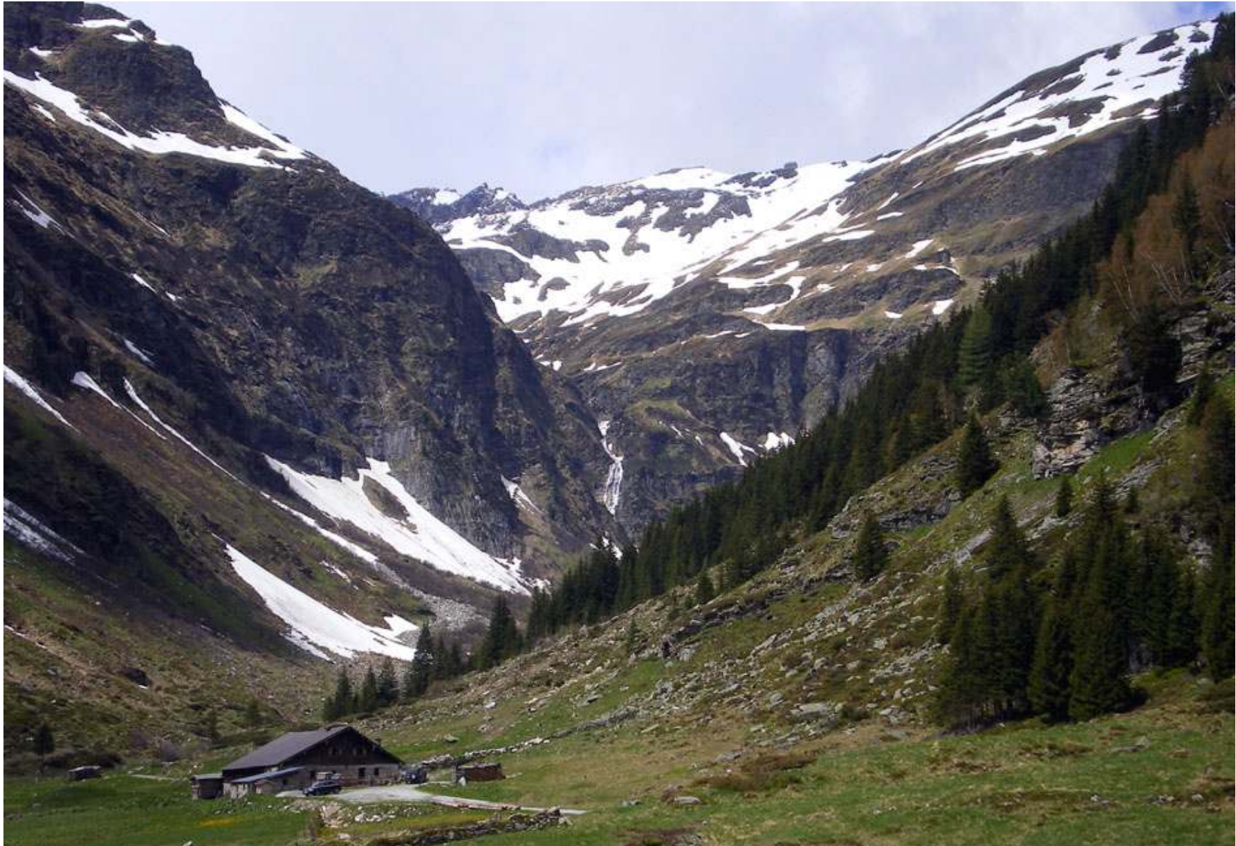
En mils vandring sydväst om Bad Gastein ligger Naßfeld (Sportgastein), varifrån vi tog oss upp till en 350 meter högre belägen stuga vid Untere Bockhartsee.