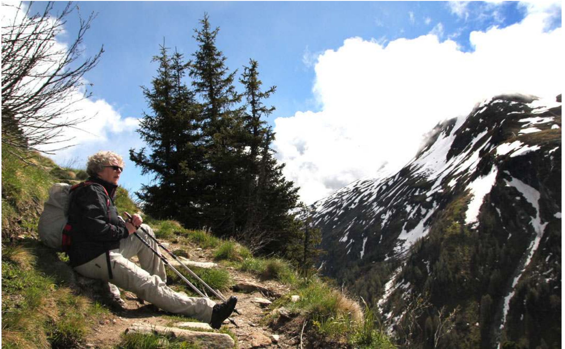
Mycket brant stig innebär en och annan paus.