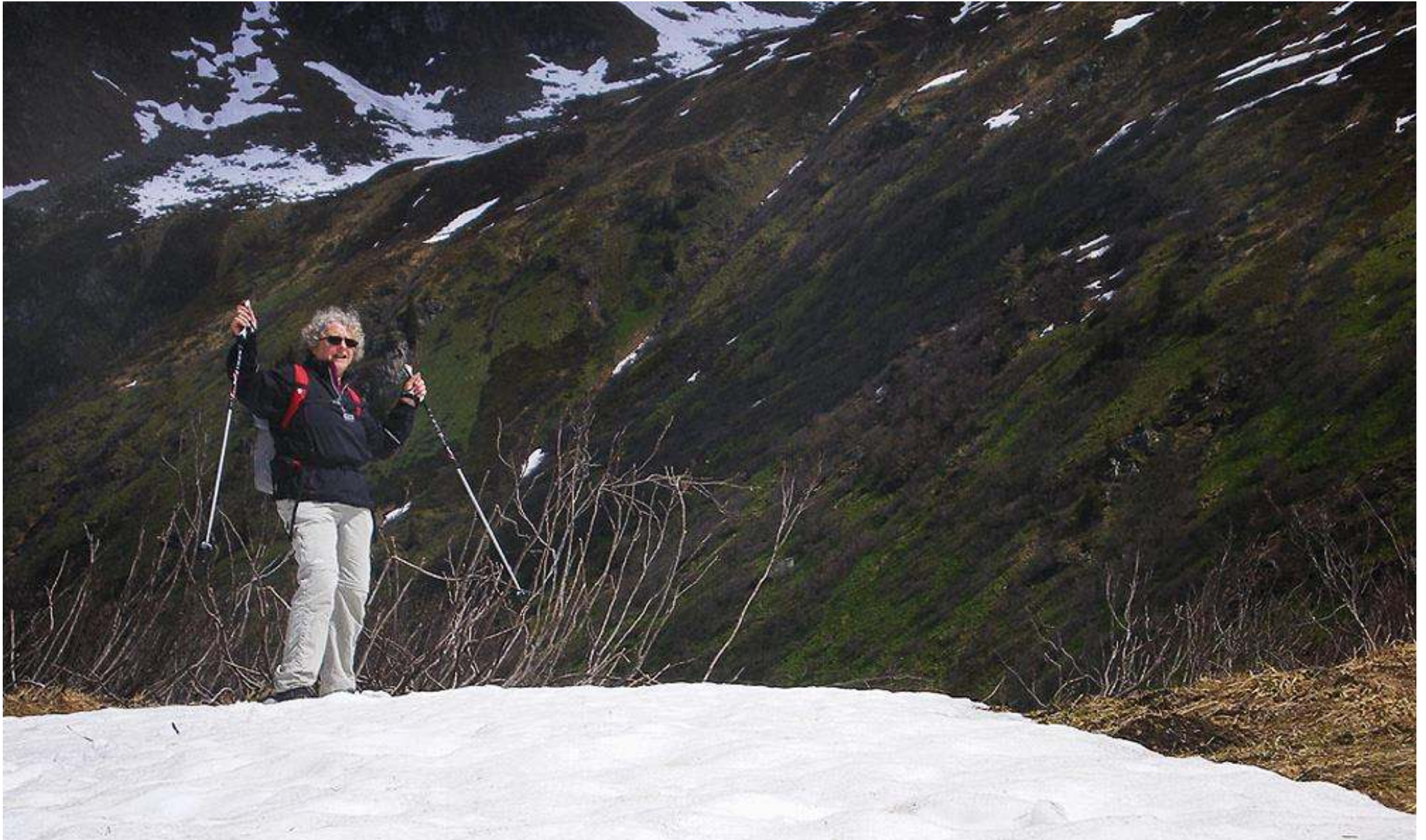
Framme vid Bockhartsehütte, 1 993 meter över havet.