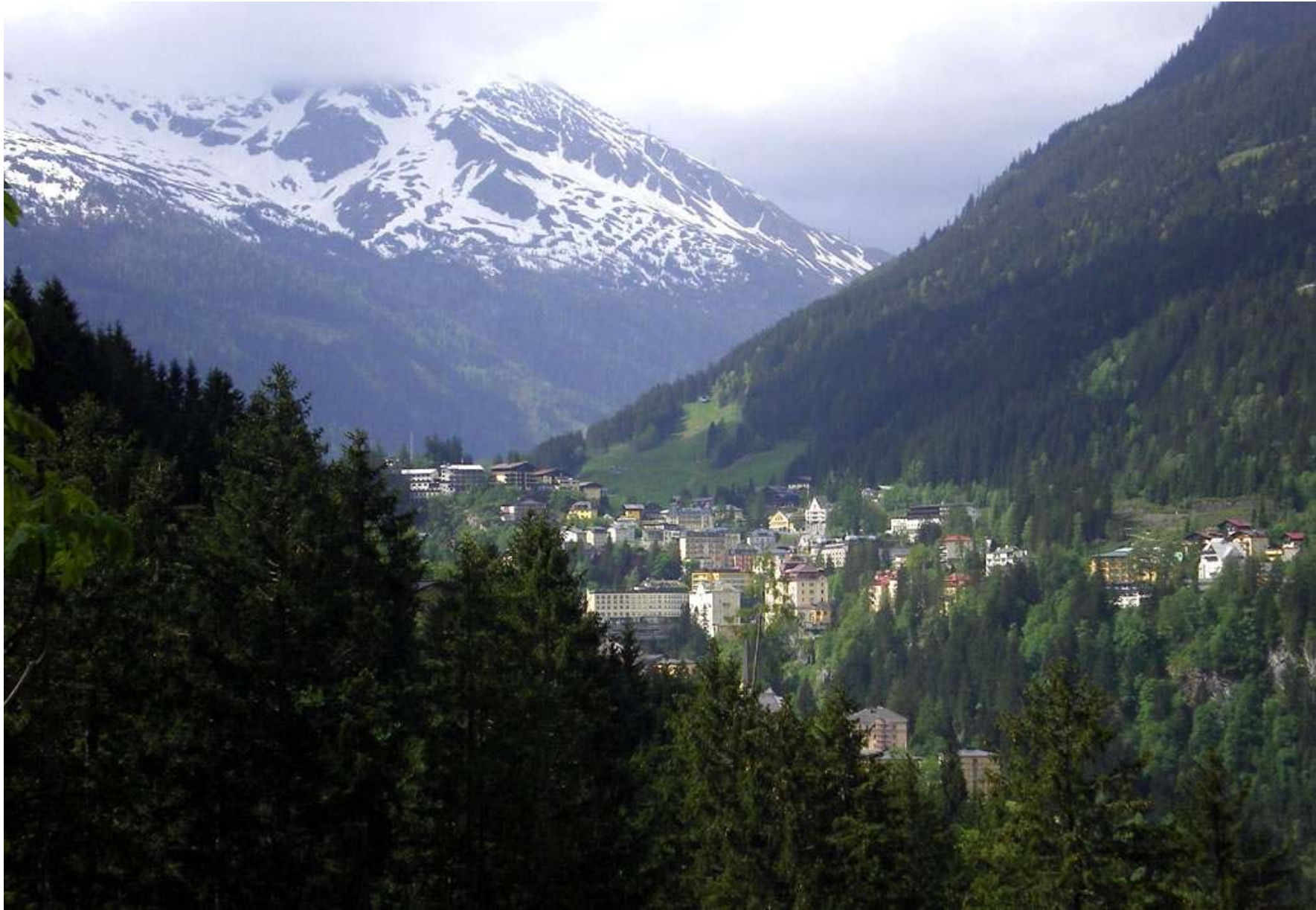
Bad Gastein har närmare 6 000 invånare och ligger omkring 1 000 meter över havet...