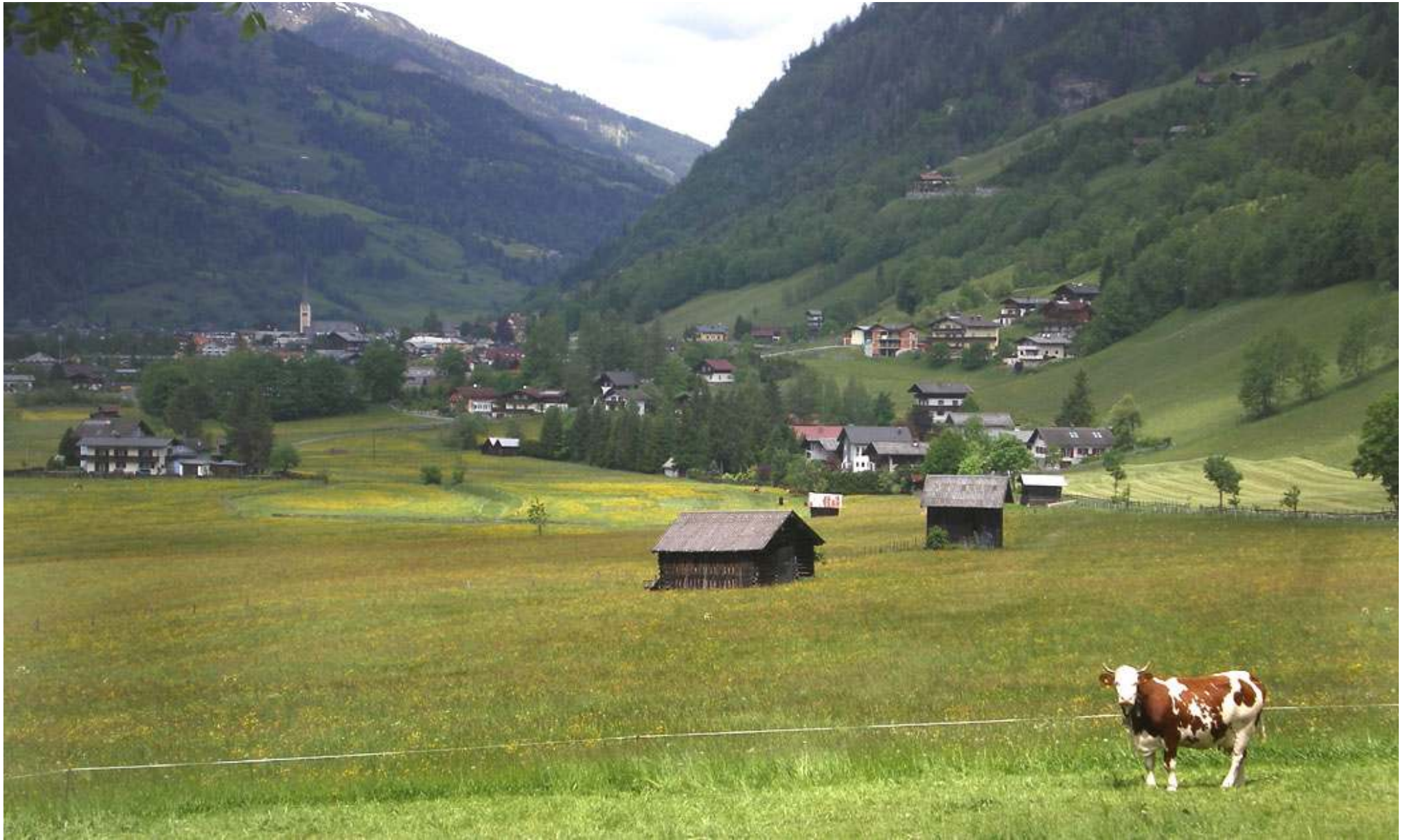
Nyfiken ko vid Gadaunern, tre kilometer sydost om Bad Hofgasteins kyrka.