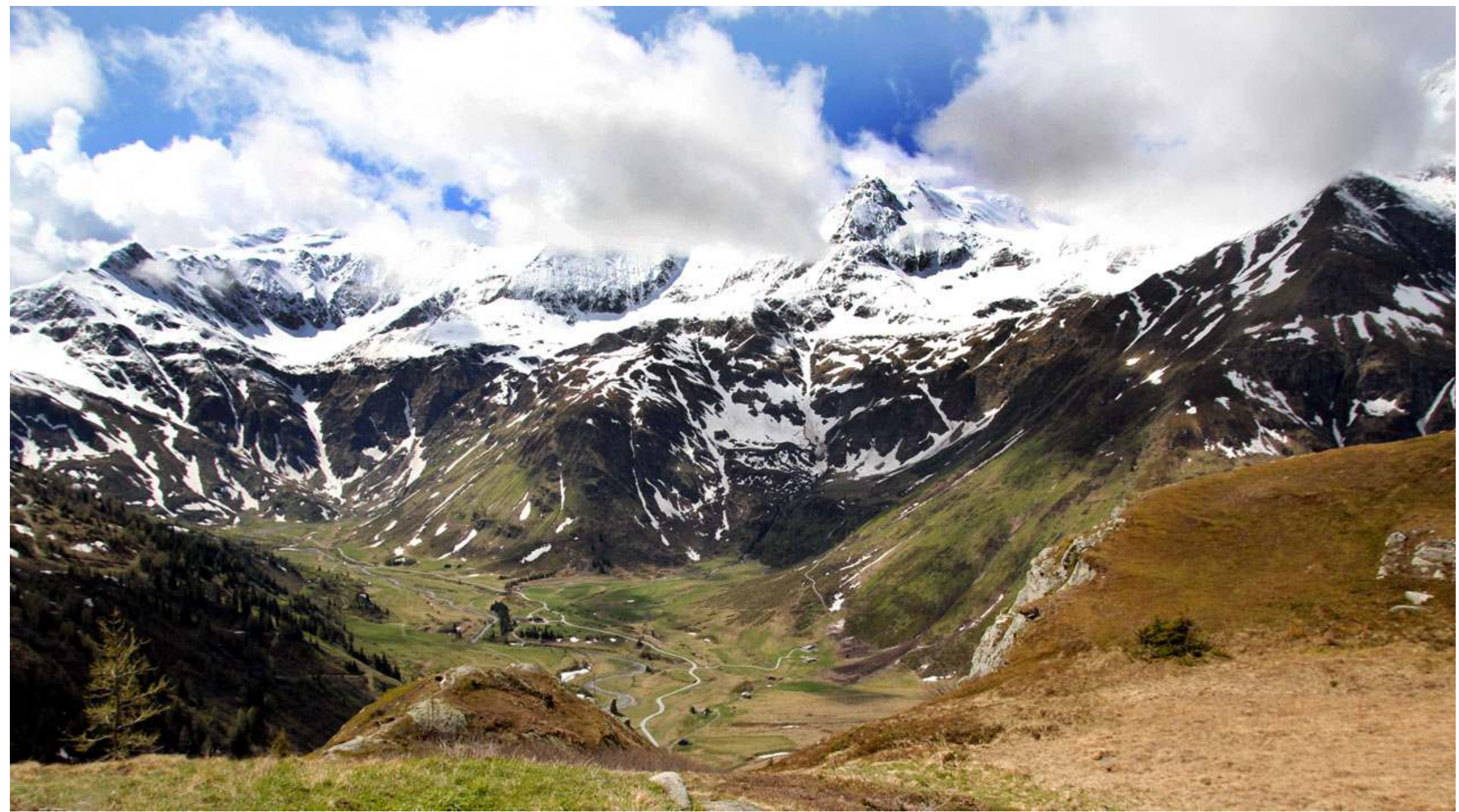
Från Bockhartseehütte har man denna utsikt över dalen med Sportgastein och omgivande berg.