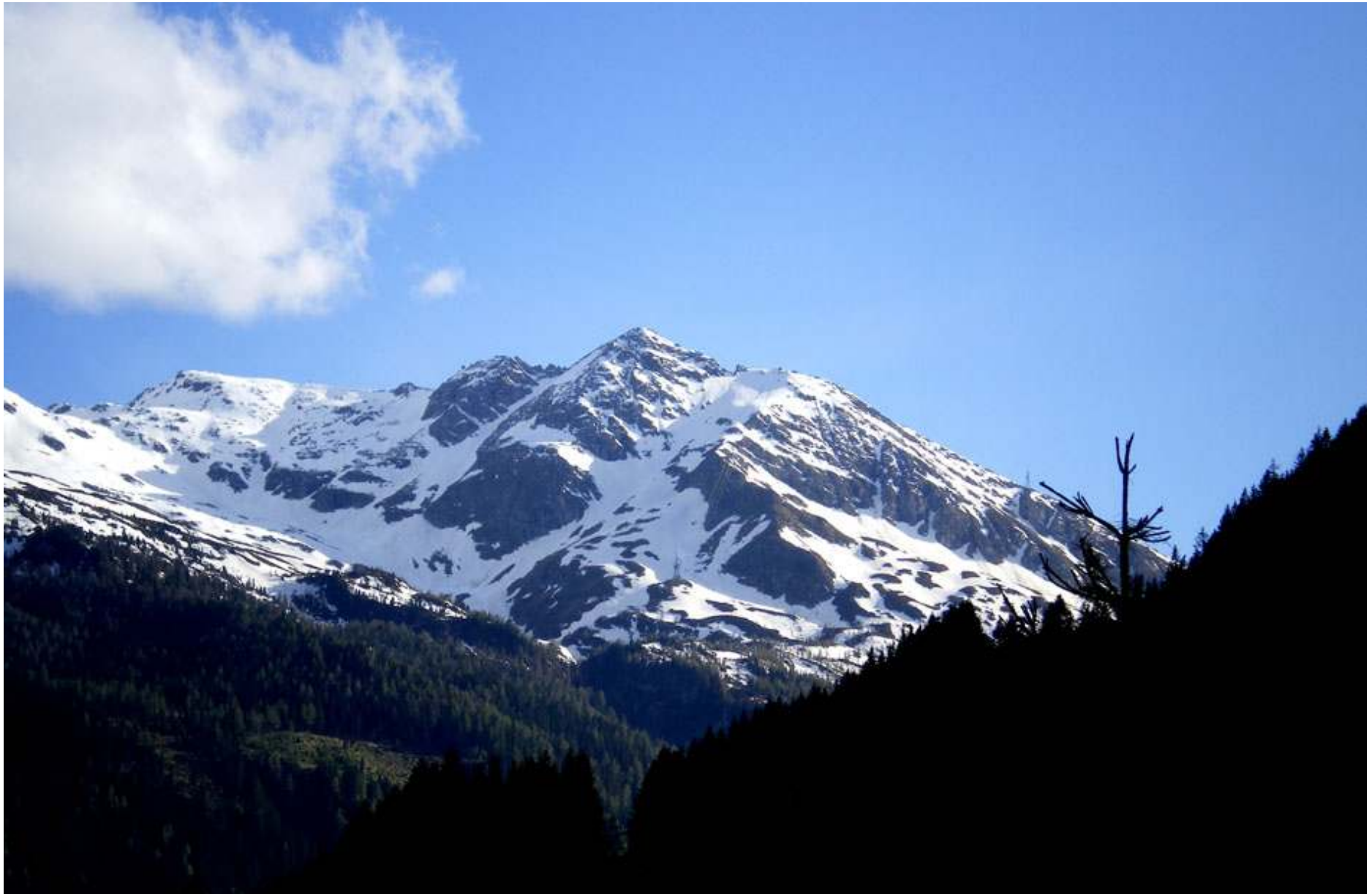
De omgivande alptopparna når närmare 2 500 meter över havet.