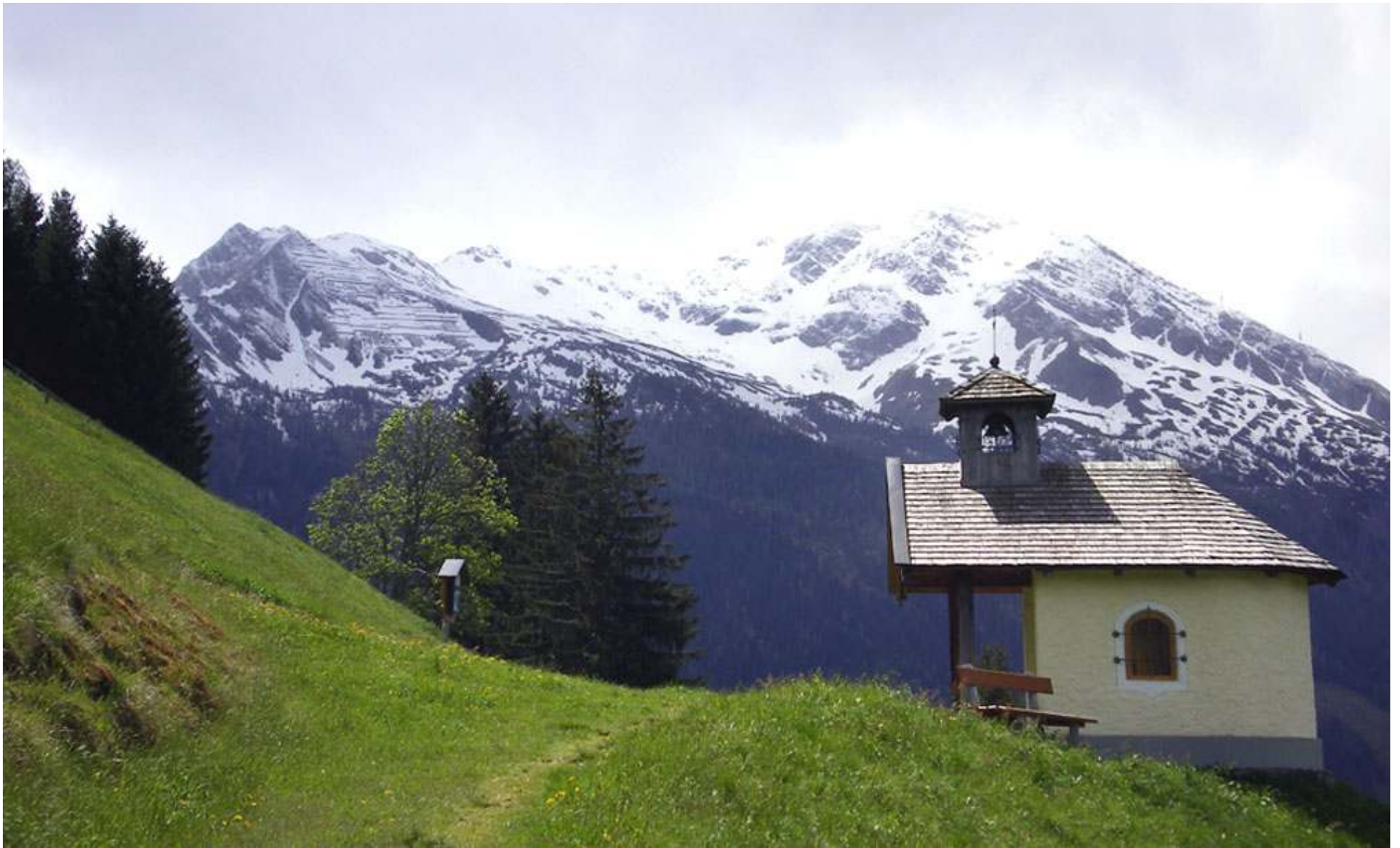
Omkring 200 meter över Bad Gastein passerar stigen detta lilla kapell.