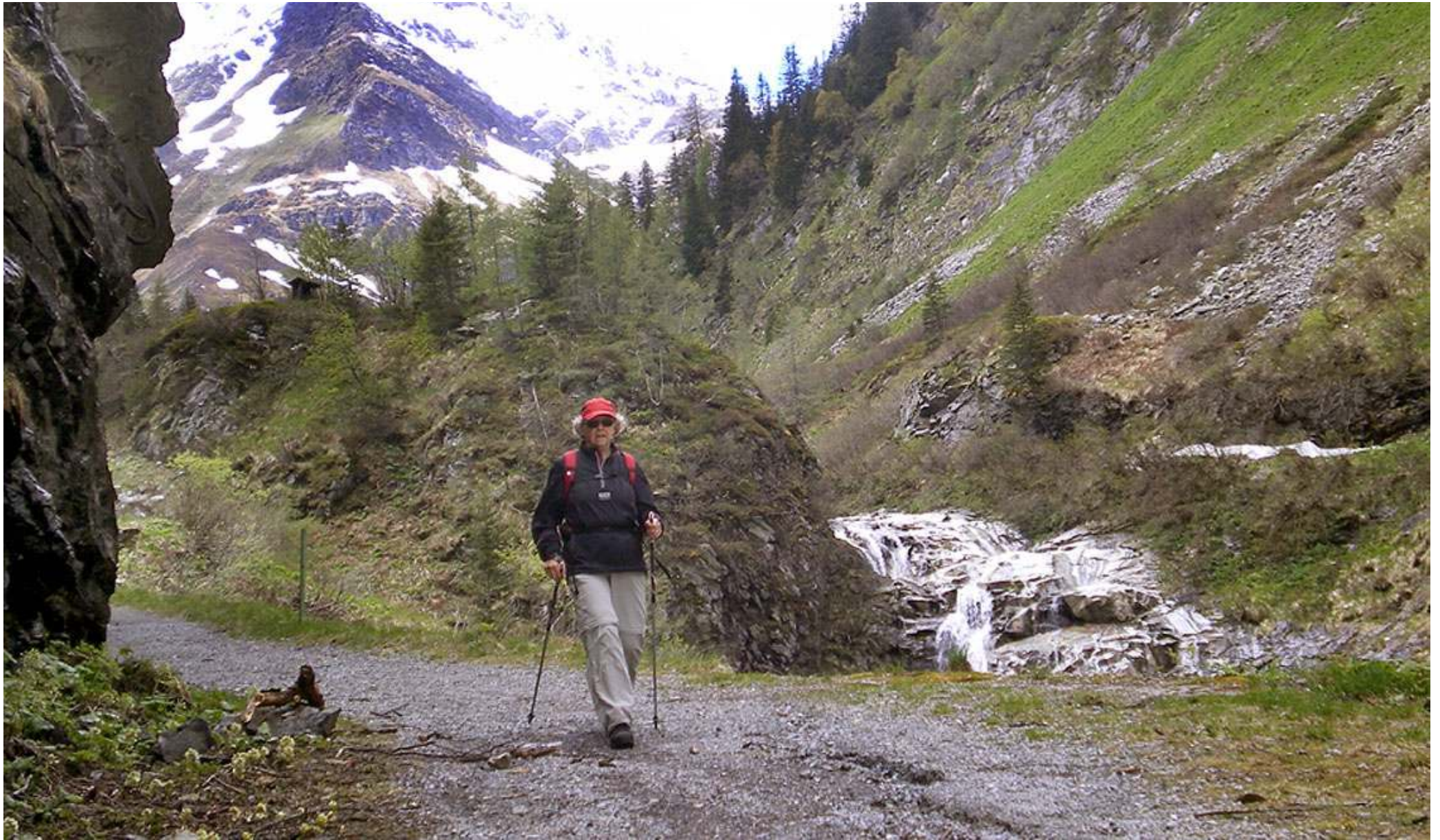
Så var vi nere igen och med raska kliv på väg hemåt.