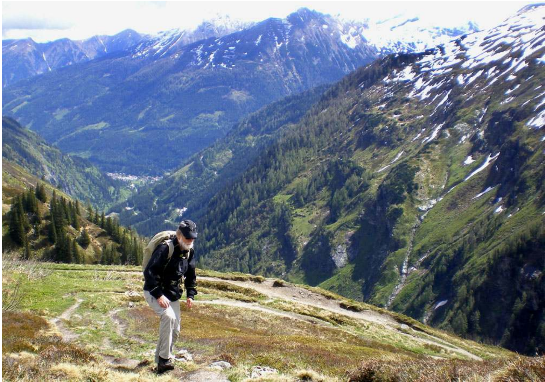
Bara en liten bit kvar.