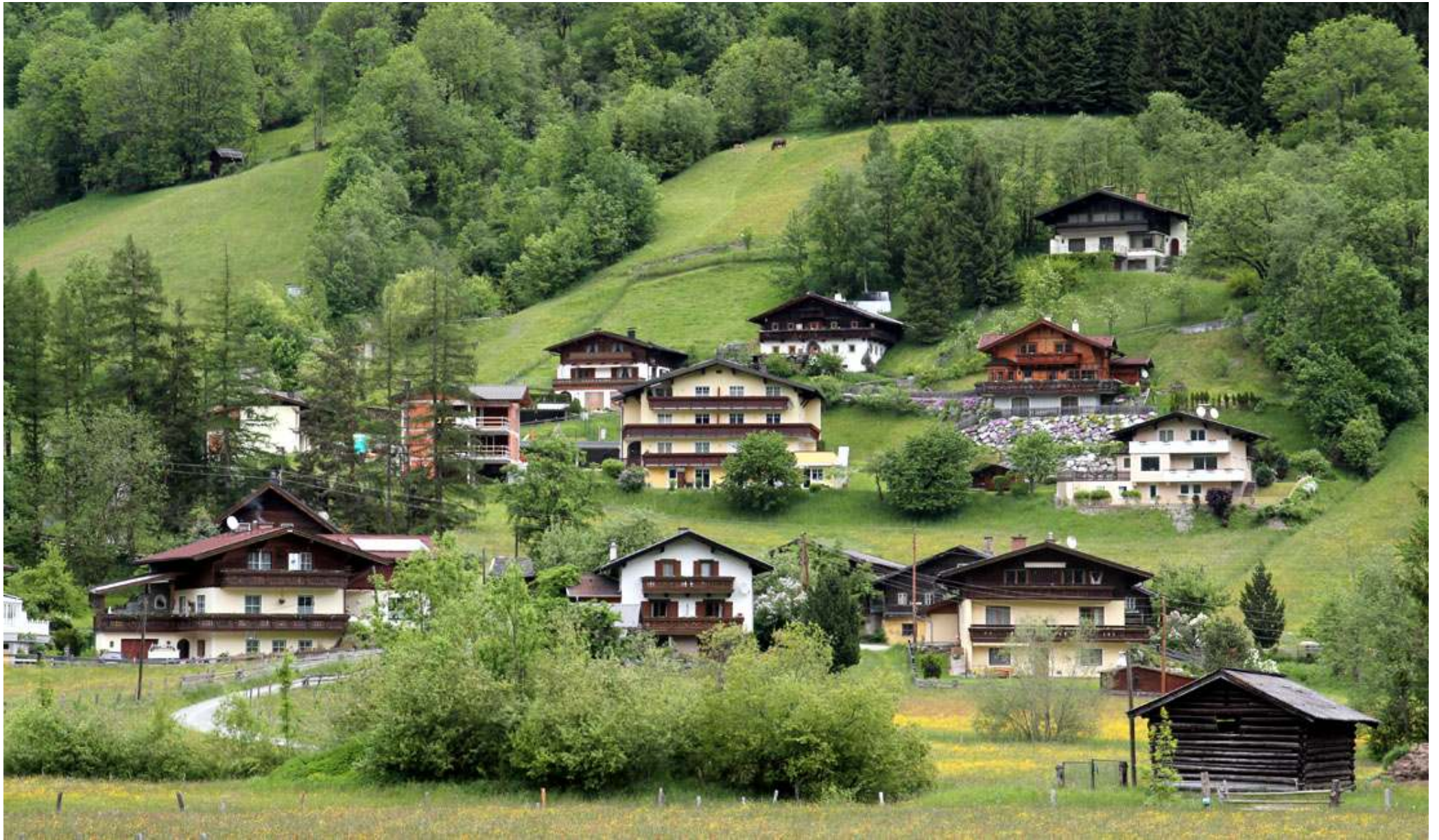
För Gasteinerdalen tämligen typiska hus.