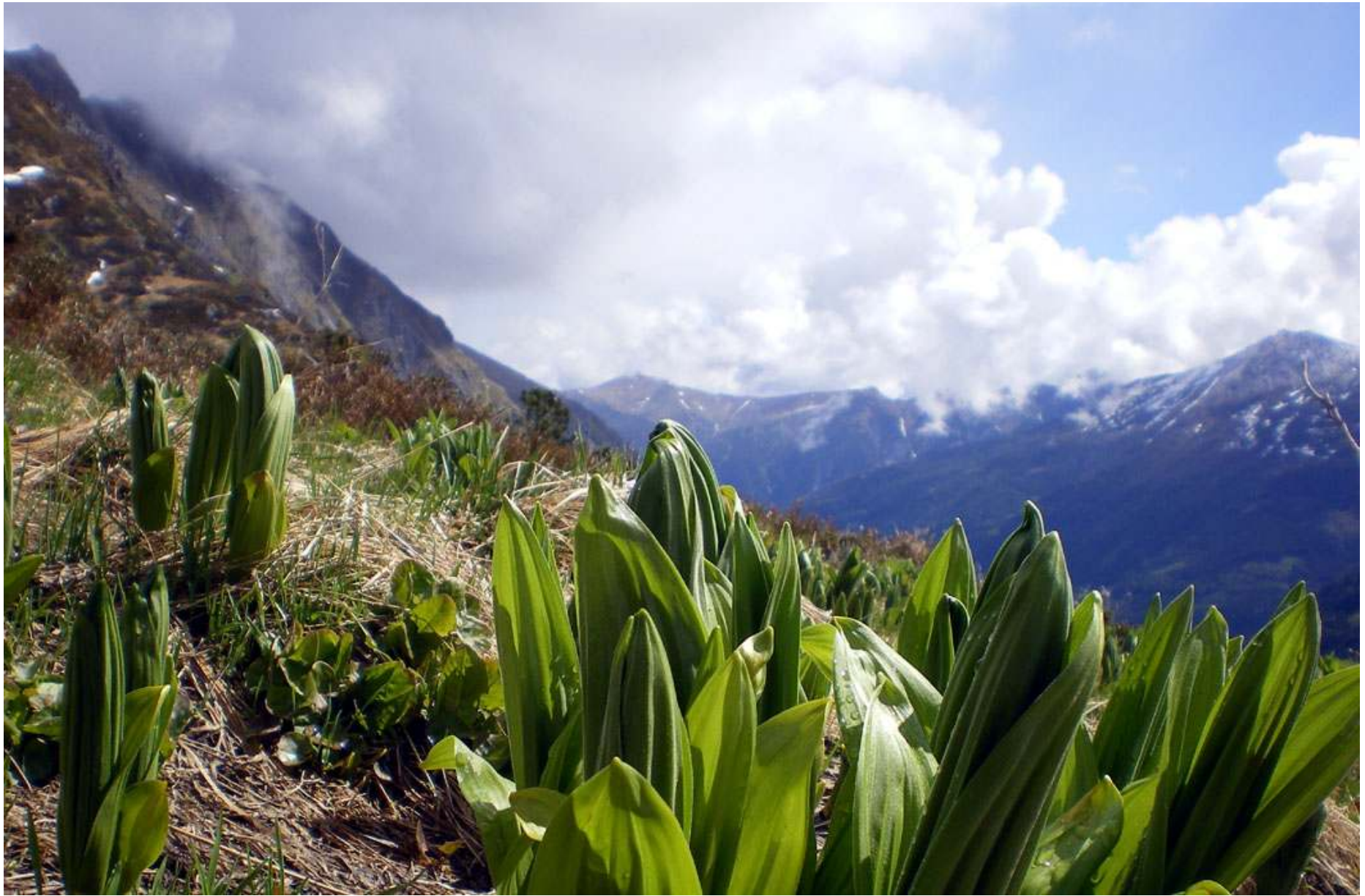
Växter av (för oss) kända och okända slag växte längs stigen.