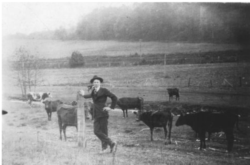
York county, Pennsylvania.