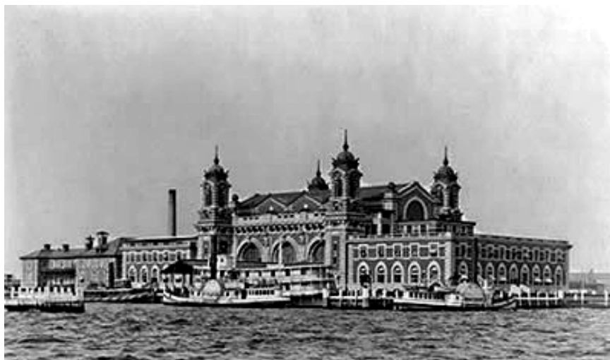
Immigrationskontrollplatsen på Ellis Island, New York.

För den som vill forska kring utvandringen till Amerika och andra länder finns det idag en uppsjö av olika sökmotorer och register tillgängliga på Internet. Detta underlättar givetvis forskandet väldigt mycket, samtidigt som de amerikanska källorna oftast saknar t.ex. konkreta födelsedata att förlita sig på och arbeta efter. Gapet är stort mellan de svenska, oftast mycket noggrant förda och detaljrika, kyrkoböckerna och den amerikanska folkräkningen m.fl. källor!